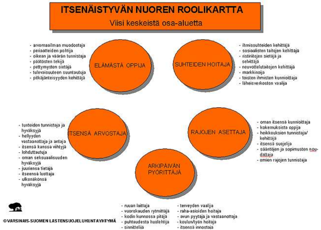
Kuvio 3. Itsenäistyvän nuoren roolikartta (Varsinais-Suomen lastensuojelukuntayhtymä 2008).