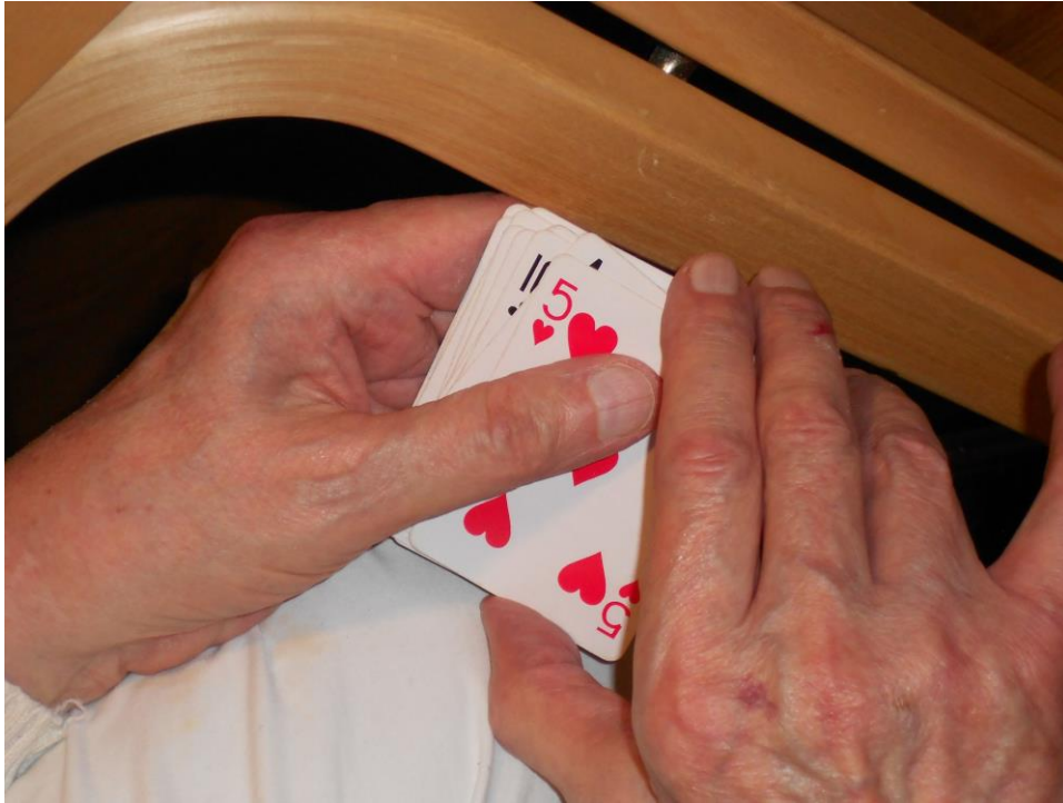
Kuva 7. Korttipeli

Ryhmäkertojen toiminta rakentui luontevasti suunnitelmiamme myötäillen. Kuulumisten vaihdon jälkeen kaikki hakeutuivat oma-aloitteisesti omiin töihinsä. Lopuksi kuuntelimme toivemusiikkia. Kolmannella kokoontumiskerralla kuulumiskierros alkoi hieman eri tavalla. Vaikka muutos aiheutti hieman hämmennystä, se sujui toinen toistaan auttaen.