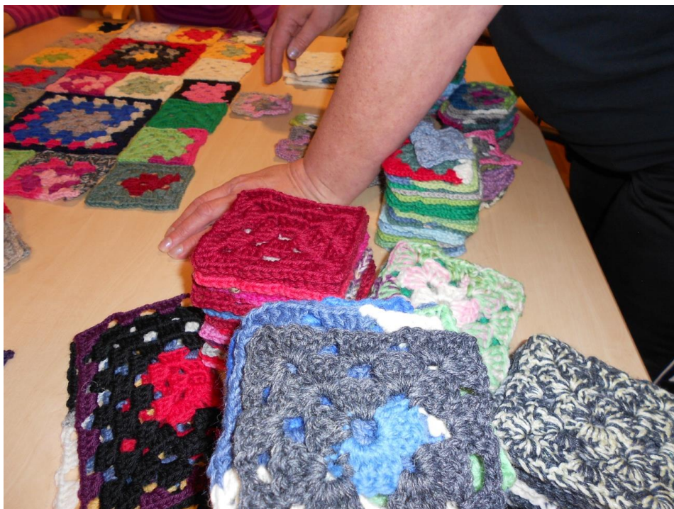
Kuva 5. Peiton sommittelua

Kurki korostaa, että sosiokulttuurinen innostaminen on ytimeltään ikäihmisten omaa, vapaaehtoista osallistumista toimintaan sen kaikissa vaiheissa. He ovat mukana toiminnan suunnittelusta arviointiin saakka. Innostamisen aktiviteetit toimivat hyvin silloin, kun ikäihmiset voivat itse valita vapaasti toiminnat, jotka tuottavat hyvinvointia ja mielihyvää. Ikäihmisten parissa innostaminen liittyy kiinteästi ihmisen arkipäivän ympäristössä tapahtuvaan sosiaaliseen oppimiseen. (Kurki 2008, 16, 75.)