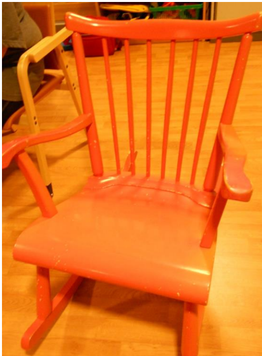
Kuva 3. Keinutuoli ideoinnin pohjana

Oli hiukan jännittynyt olo ensimmäisellä kerralla, uusi ikäryhmä ohjaustyössä. Olin väsynyt työpäivän jälkeen ja jotenkin jäi aika epävarma olo ryhmän jälkeen. Toivottavasti väsymys ja epävarmuus eivät vaikuttaneet ryhmän aloitukseen kovin paljon, ei ainakaan palautteesta päätellen. Kyselinkö liikaa ryhmäläisten tekemisen haluja? Jälkeenpäin ajattelin, että siinä oli puolensa: ryhmäläisille tuli varmasti olo, että saavat itse päättää mitä tehdään sekä kysellessäni muistuttelin myös miettimään sitä. Jostakin saattoi tuntua kiusalliselta utelu ja yhtäkkiä miettiminen, en tiedä... (Opinnäytetyöpäiväkirja 17.1.2013.)