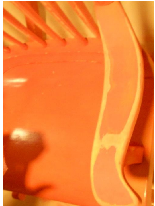
Kuva 4. Hiottu kädensija