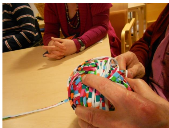
Kuva 2. Kerä puhujalla

Asukkaista neljä oli miehiä ja yksi nainen. Neljä asukkaista oli toimintakykyisiä, yksi toimintakyvytön. Omaisina osallistui kaksi puolisoa, yksi sisar, yksi tytär ja yksi tyttärentyttäjä. Neljä omaisista oli eläkeläisiä, yksi työikäinen. Yksi asukas ja hänen omaisensa jättäytyivät pois toiminnasta ensimmäisen ryhmäkerran jäl-