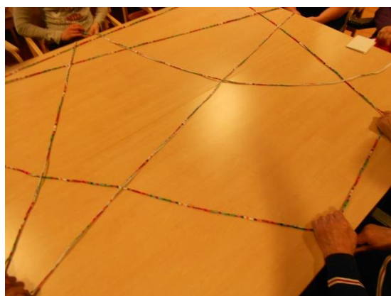
Kuva 1. Esittelykierros

Vanhustenhuollon ohjaaja jakoi laatimamme tiedotteen osallistujille (Liite 3) ryhmätoiminnasta hyvissä ajoin ennen toiminnan aloittamista. Ensimmäiseen ryhmäkertaan osallistui yksi hoitaja, viisi asukasta ja kuusi omaista. Aluksi esittelimme itsemme, mistä tulemme ja miksi olemme kokoontuneet. Ryhmä esittäytyi vierittämällä matonkudekerää pöydän yli toinen toisilleen (Kuva 1), kerän haltijalla oli puheenvuoro (Kuva 2).