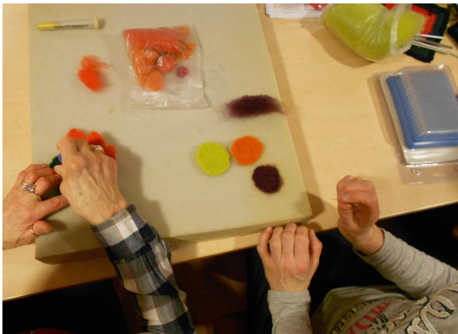
Kuva 6. Omainen opastaa hoitajaa

Muun toiminnan ohella opastimme ryhmäläisille neulahuovutusta, joka oli useimmille uusi tekniikka. Neulahuovutuksesta innostuneen omaisen taidot karttuivat työn edetessä siinä määrin, että hän rohkaistui näyttämään mallia hoitajalle (Kuva 6).