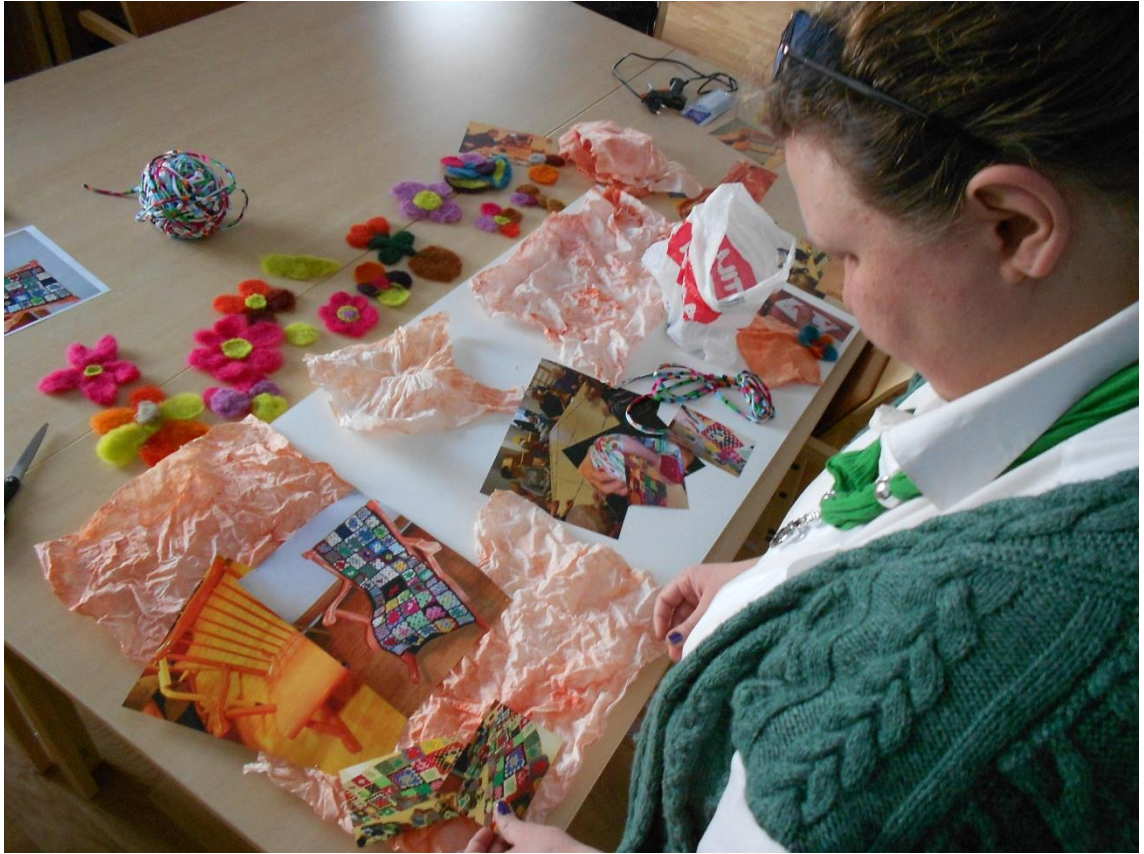
Kuva 8. Taulun sommittelua

Ensimmäisellä ryhmäkerralla olimme sopineet, että viimeisellä kerralla järjestäisimme juhlat. Työelämän ohjaajamme ja kaikki toimintaan osallistuneet omaiset, yhtä lukuun ottamatta, osallistuivat juhlaan. Valitettavasti toimintaan osallistuneet asukkaat ja hoitajat eivät voineet osallistua juhlaan palvelukodissa vallinneen epidemiauhan vuoksi. Sisustimme kohtaamispaikan (Kuva 9) valmiilla töillä, joimme kahvit ja nautimme leivonnaisista, joita ryhmäläiset olivat itse leiponeet.