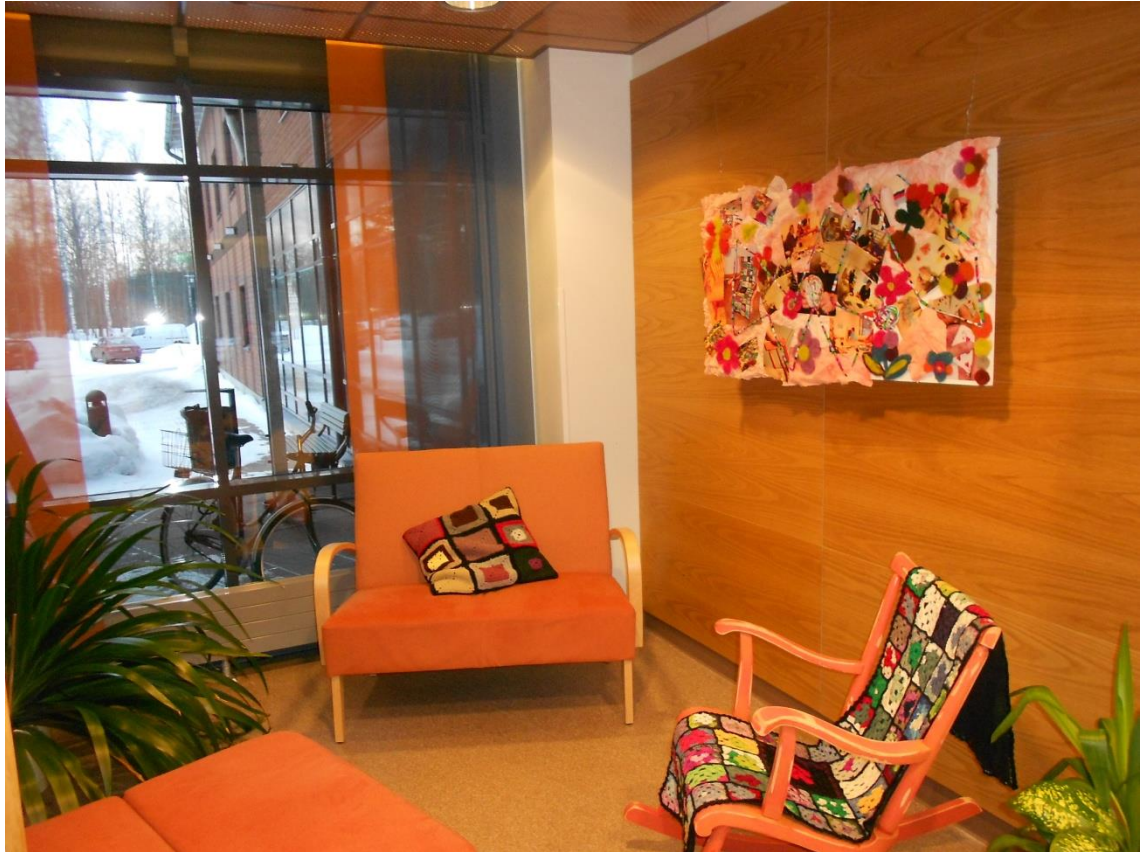
Kuva 9. Kohtaamispaikka