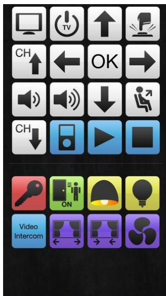
Kuva 1. Evoassist-ohjelman käyttöliittymä

Ainoa varsinainen apuvälineeksi suunniteltu ympäristönhallintajärjestelmä iPadille on RSLSteeperin valikoimassa oleva Evoassist (Kuva 1.), joka tukee valmistajan mukaan infrapuna- ja radiotaajuusohjattavia laitteita. Ohjelmistossa on myös mahdollisuus tallentaa fraaseja, jolloin ohjelmistoa voidaan käyttää kommunikoinnin apuna yleisimmissä tilanteissa. Tätä ohjelmaa ei tällä hetkellä ole Suomen markkinoilla. (RSLSteeper 2012)