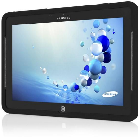
Kuva 5. Incipio Capture-kotelo