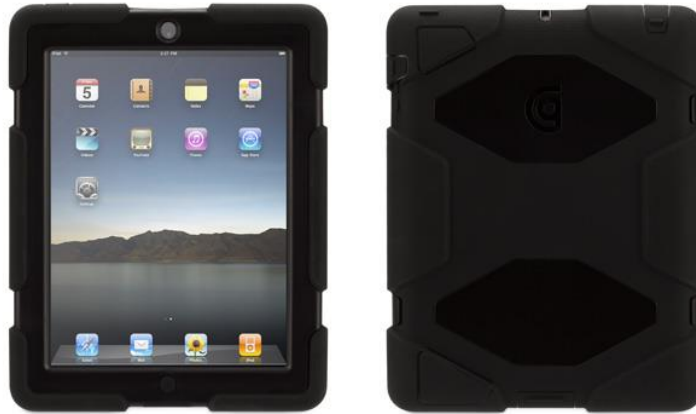
Kuva 3. Griffin Survivor-kotelo

Griffinin toinen kotelo AirStrap Med on suunniteltu yhteistyössä terveystuollon ammattilaisten kanssa. Se ei ole yhtä hyvin suojattu ulkoisia iskuja vastaan kuin Survivor-malli, mutta siinä on sisäänrakennettu olkahihna ja sen takaosassa on kahva, joka mahdollistaa iPadin pitelemisen yhdellä kädellä helpommin. Suojassa on myös sisäänrakennettu näyttösuoja, joka suojaa nesteroiskeilta. Kotelossa on myös teline stylus-kynälle (Griffin n.d.).