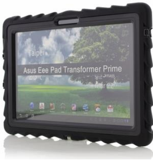
Kuva 4. Gumdrop Drop Tech-kotelo

tajan omien tai kolmansien osapuolien normaalien suojakoteloiden varaan. Suuren mallivalikoiman vuoksi lisätarvikkeita ei kolmansien osapuolien koteloiden myöskään ole Suomen markkinoilla saatavilla kovin paljoa ja usein kotelot joudutaan tilaamaan ulkomaisilta verkkokaupoilta. Otterbox:lta löytyy valikoimastaan myös paremmin suojattuja android-suojakoteloiden, näitäkin tosin lähinnä Samsungin laitteille. Myös DiCAPac:in koteloiden voi käyttää android-tablettien kanssa, kunhan ne ovat kooltaan samankokoisia tai pienempiä kuin iPad. Kotelo saattaa kuitenkin vaikuttaa laitteen fyysisten painikkeiden käytettävyyteen. Ulkomailta tilattavista kotelovalmistajista mainitsemisen arvoisia ovat Bobj ja Gumdrop, joita on saatavilla ainakin Amazon-verkkokaupasta. Gumdrop koteloiden on saatavilla myös Expansys verkkokaupasta.