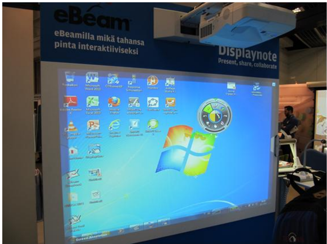
Kuva 5.1 Lisälaite eBeam edge tekee projektorin heijastamasta pinnasta interaktiivisen.

nalle mahdollisuutta interaktiivisten esitysten kommentointia ilman tietokonetta. Interaktiivisia projektoreita tarjoavat mm. Epson ja Hitachi (Interaktiivisten projektorien tuote-esitteet Epson ja Hitachi Educa-messuilta 25.1.2013). Interaktiivisista valkotauluista ja projektorista poiketen valmistajat eBeam ja Mimio tarjoavat toisenlaisen ratkaisun: Tavalliseen valkotaulun reunalle magneetilla kiinnitettävän ja tietokoneeseen liitettävän lisälaitteen, joka tekee tavallisen projektorin heijastamasta pinnasta interaktiivisen valkotaulun. Lisälaite on edullinen ratkaisu, se on pienikokoinen, siirrettävä ja tarjoaa interaktiivisuutta mille tahansa tasaiselle pinnalle kuva 5.1.