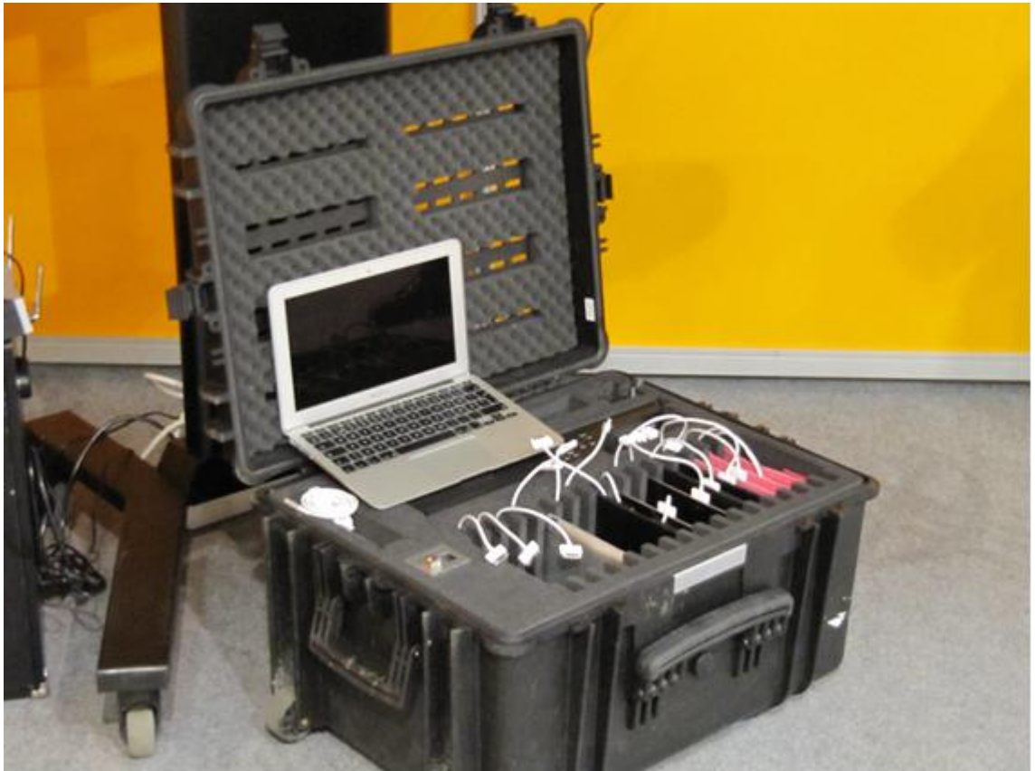
Kuva 5.2 Mobiililuokka ja latausvaunu. Educa -messut 26.1.2013.