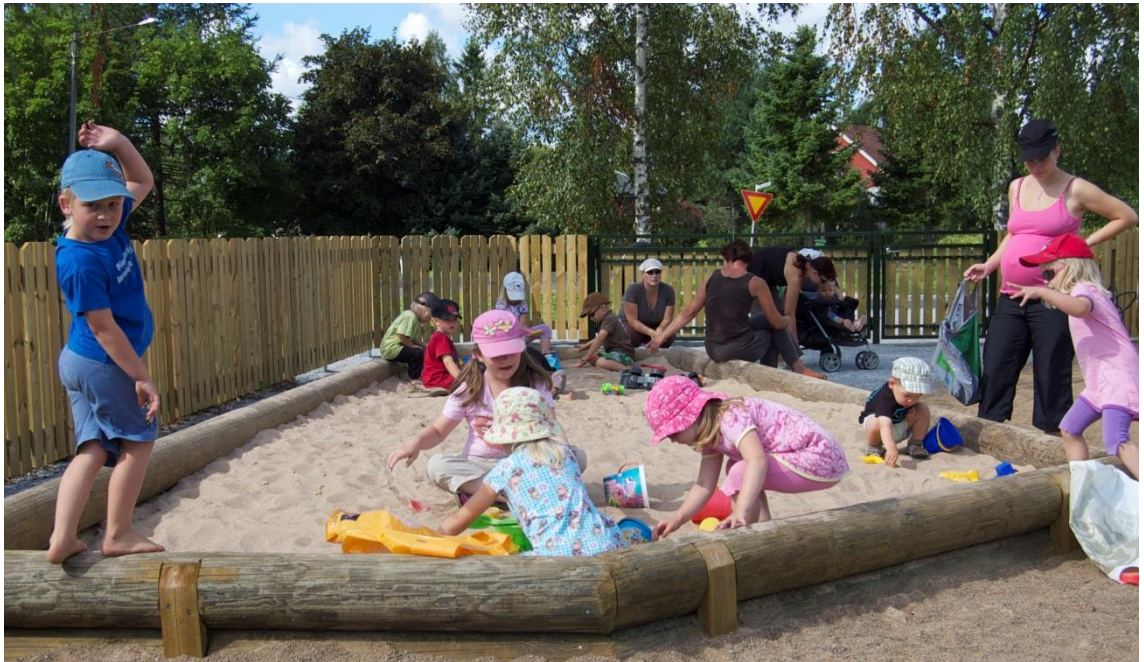
Kuva 7. Kuva Salonjokilaakson lehtiartikkelin yhteydestä. (Nikander Minna, 2013).

Lehdistötiedote tehtiin myös ottaen huomioon tapahtuman järjestäjän tavoitteet. Koska itse tapahtumassa puhetta ei pidetty, halusin tuoda ajatukseni esille lehdessä, jossa pääasiana tulisi olla itse puisto projekti avajaisineen, en suinkaan minä itse (liite 5). Sain olla mukana muokkaamassa julkaistavaa tekstiä, jolloin tiesin, että juttuun ei pääsisi livahtamaan mitään suurempaa yllätyksellistä tai väärin ilmaistua asiaa. Haastattelu sekä kuvat puistosta käytiin ottamassa jo etukäteen ennen avajaisia sekä avajaisten yhteydessä. Lopullisen tekstin sekä julkaistavat kuvat valitsi toki Salonjokilaakson toimitus (kuva 7). Kaiken kaikkiaan itselleni jäi varsin positiivinen kokemus lehdistöstä.