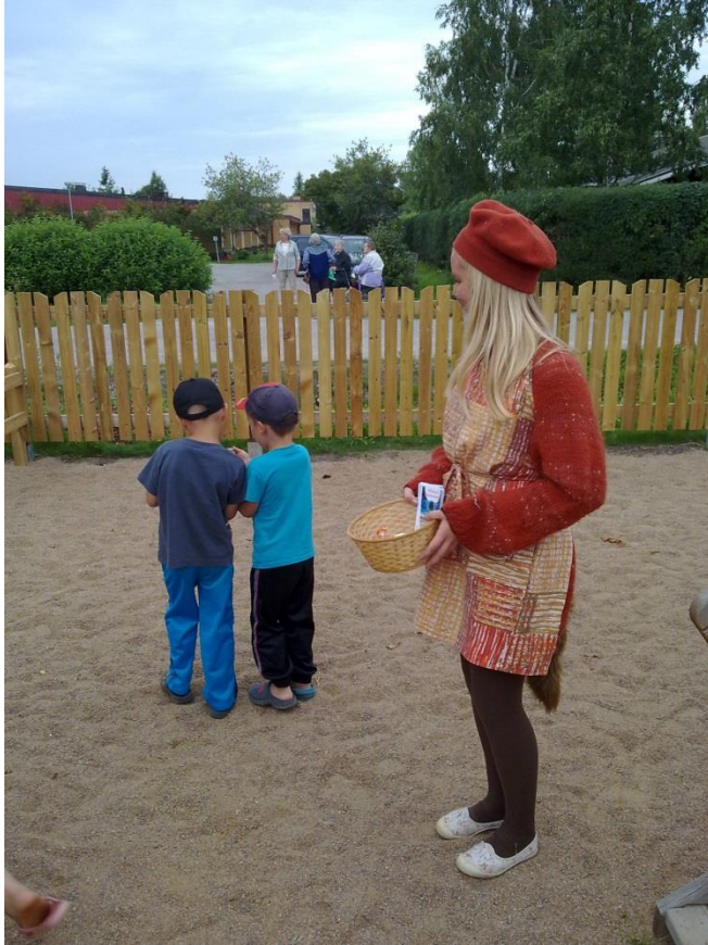
Kuva 5. Satuhahmo jakamassa karkkeja sekä lentolehtisiä. (Soininen, 2011).

Vaskion POP Pankin silloinen toimitusjohtaja Reino Härö toivoi tapahtumalle lisänäkyvyyttä sekä enemmän yrityksiä ja yhdistyksiä mukaan. Pankki tuki tapahtumaa sponsoroimalla tarjoilun, jossa oli pankin logolla varustetut mukit, lautaset ja servietit. Alun perin sähköpisteen puutteen vuoksi oli tarkoitus järjestää vain mehutarjoilu, mutta POP Pankin toive oli saada kahvitusta mukaan tapahtumaan, jolloin kysyin kokemuksen omaavilta maa- ja kotitalousnaisilta hakukkuutta tulla avustamaan kahvituksessa. Vaatii oman taitonsa osata arvioida tarjottavien ja muiden tarjoiluun liittyvien materiaalien määrää. Järjestely oli luonnollinen, sillä heillä oli kokemusta jo muista paikallisten tapahtumien kahvitarjoiluista ja osallistujamääristä. He huolehtivat myös Vaskion POP Pankin omien tilaisuuksien kahvituksesta ja omistivat tarvittavan kaluston. Heiltä pystyi lisäksi kysymään neuvoa POP Pankilta saadun summan riittävyyteen tarjoilun osalta, jolloin tiesi tarvittaisiinko lisää sponsoriyhteistyötä paikallisten yritysten kanssa. Itse esitin toiveen tarjottavista erikoisruokavaliot huomioiden, mutta muuten an-