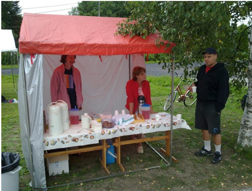
Kuva 6. Kahvitustelulta. (Soininen, 2011).

noin heille vapaat kädet tarjoilun järjestämisen suhteen. Sateen varalle heiltä löytyi myös tarjoiluteltta, joka sijoitettiin aivan puiston pääportin tuntumaan (kuva 6). Vaskion POP Pankki vahvisti myös, että heidän keittiötä voisi tarpeen tullen käyttää kahvinkeiton ja tarjoilujärjestelyjen osalta. Lopulta maa- ja kotitalousnaisten jäsenen lähempänä puistoa olevaa kotia käytettiin tähän tarkoitukseen.