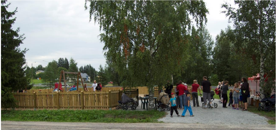
Kuva 8. Tapahtumaan saapuvaa väkeä. (Nikander Minna, 2011).

tyksessä, satuhahmojen karkkien jaossa, nurmialueen aktiviteettien järjestämisessä sekä ollen apuna muissa käytännön järjestelyissä sekä kyselyissä. Itse toimitin puistoon mm. pöydän, tuolin, karamellit ja kilpailun järjestämiseen liittyvät tavarat. Alku sujui hienosti, suunnitellusti ja ajallaan.