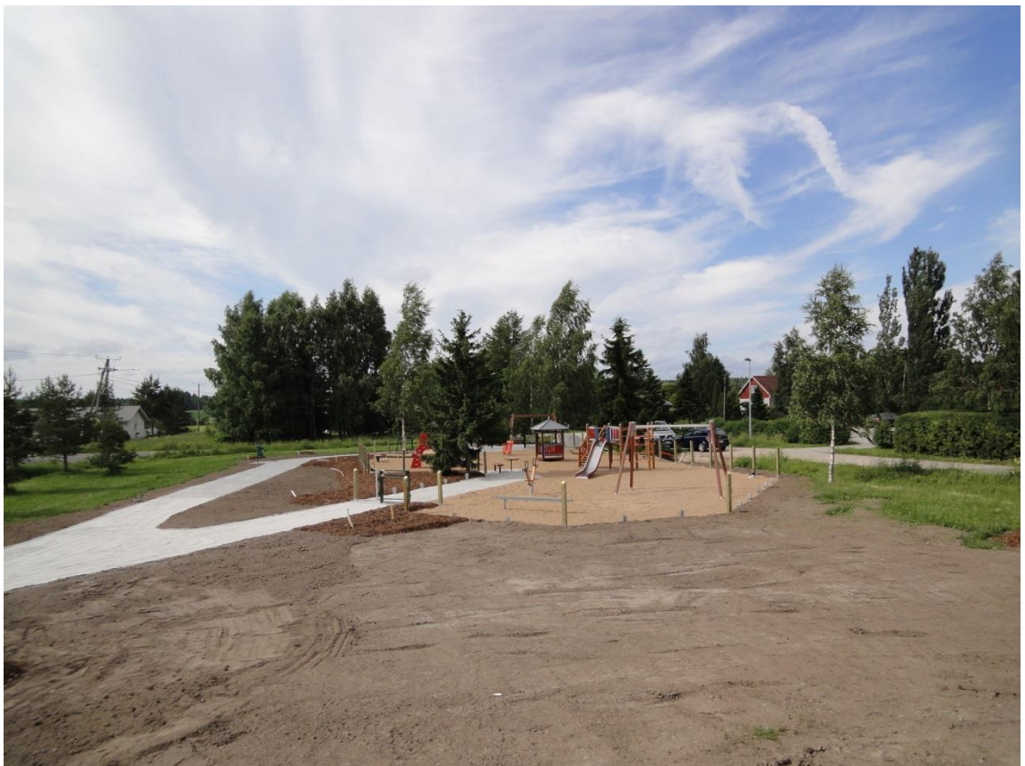
Kuva 2. Puisto 30.6.2011.

Puistoalueen kunnostustyöt alkoivat toukokuussa 2011 ja toiveissa oli päästä uuteen kunnostettuun puistoon juhannuksen jälkeen (kuva 2). Valaistuksen asentaminen sekä viimeisten istutuksien lisääminen jäivät syksyyn. Valitettavasti aikataulut venyivät ja puiston valmistumista odotellessa kehiteltiin ideoita avajaisiin.