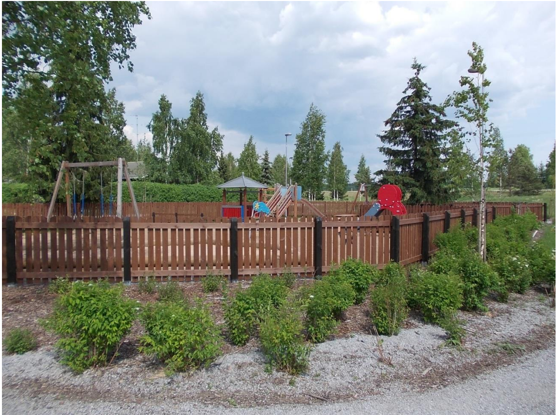
Kuva 10. Puiston aita sai keväällä 2013 uuden värin. (Soininen, 2013).

Yhteistyö puistoyksikön sekä kyläläisten kanssa sujui hyvin ja saimme toteutettua myös omia ideoitamme. Puutarhansuunnittelukurssin sekä rakennusprojektin jälkeen ideoin mm. leikkikummun puistoalueelle, jolla saatiin säästöä myös kuljetuskustannuksiin. Ylijäämämaasta tehty kumpu on kiva muuten niin tasaisella puistoalueella, mutta toistaiseksi en ole havainnut, että talviaikaan sitä olisi käytetty pulkan laskuun. Sen sijaan latu on kulkenut tasaisemmalla alueella. Toimintaa voisi siis kehittää lisää leikkialueen ulkopuolelle, jossa tilaa kyllä riittää erilaisiin toimintoihin.