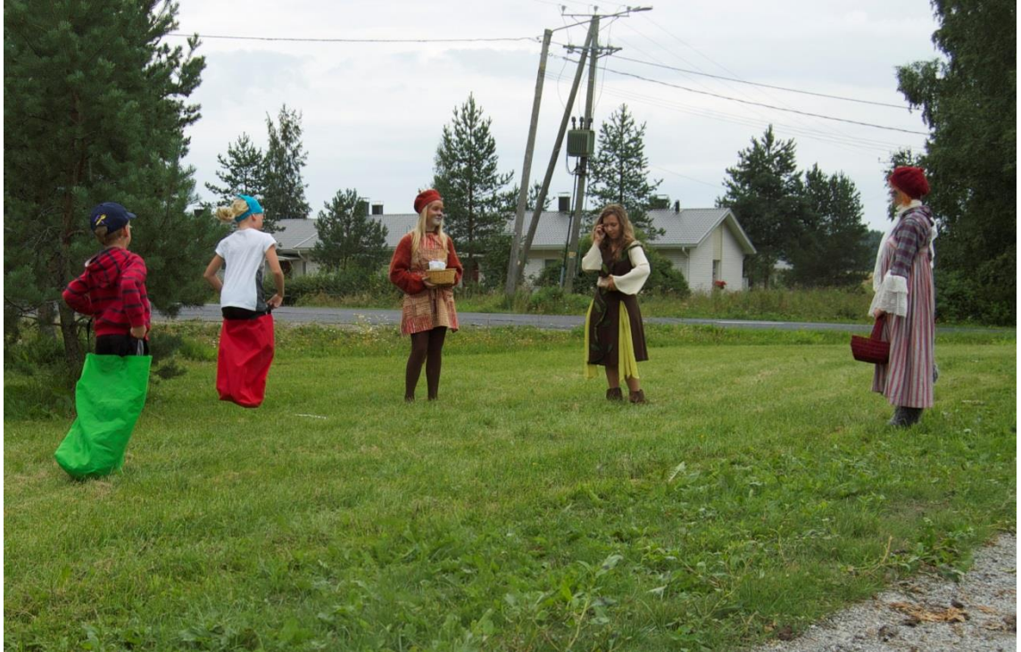
Kuva 4. Pussihyppelyä ja satuhahmoja. (Nikander Minna, 2011).

Halikon VPK halusi osallistua hälytysvarauksella toimintaan esittelemällä sammutusautoa sekä toimittamalla ja kokoamalla isot katokset sateen varalle. Sää aiheuttaa aina omat riskinsä ulkoilmatapahtumissa, mutta onneksi sateen mahdollisuus ei ollut suuri.