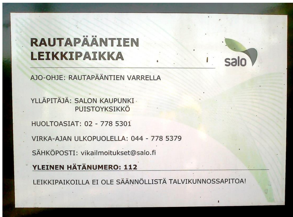
Kuva 3. Puiston kyltti. (Soininen, 2013).

Salon kaupungin ylläpitämien leikkipaikkojen lukumäärä on tällä hetkellä 95. Leikkipaikoilla noudatetaan SFS-standardin mukaisia turvallisuusnormeja ja ne tarkastetaan säännöllisesti ja ilmenneet puutteet ja viat korjataan. Tarkastuskierrokset alkavat huhtikuussa ja jatkuvat loka-marraskuulle. Leikkipaikoilla havaituista vioista ja puutteellisuuksista tulee ilmoittaa puiston kyltissä sekä nettisivuilla mainittuun numeroon (kuva 3).