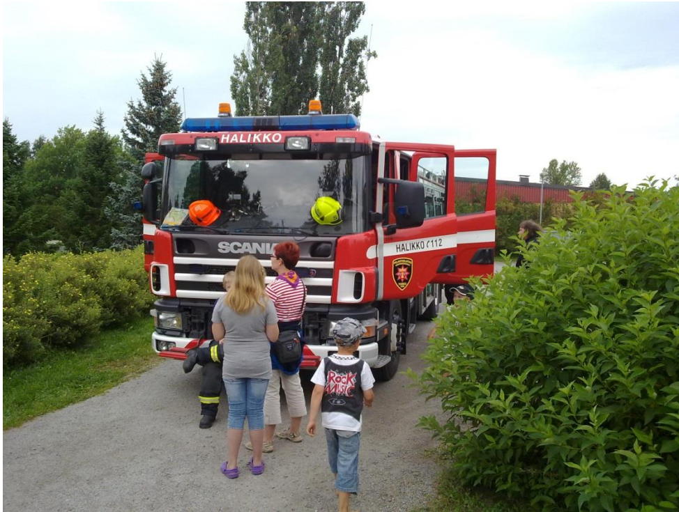
Kuva 9. Sammutusauto kiinnostaa kävijöitä. (Soininen, 2011).

Tapahtuman loppupuolella satoi silloin tällöin ripaus vettä, mutta suurimmalta sateelta vältyttiin. Teltat ja sateenvarjot olivat siis tarpeen. Taivas repesi vasta tapahtuman päätyttyä, kun kaikki tavarat ja roskat oli saatu kerättyä ja lähdetty kotiin. Hieman sateinen ilma saattoi myös vaikuttaa myöhemmin puistoon saapuvaksi ajatelleiden tulon.