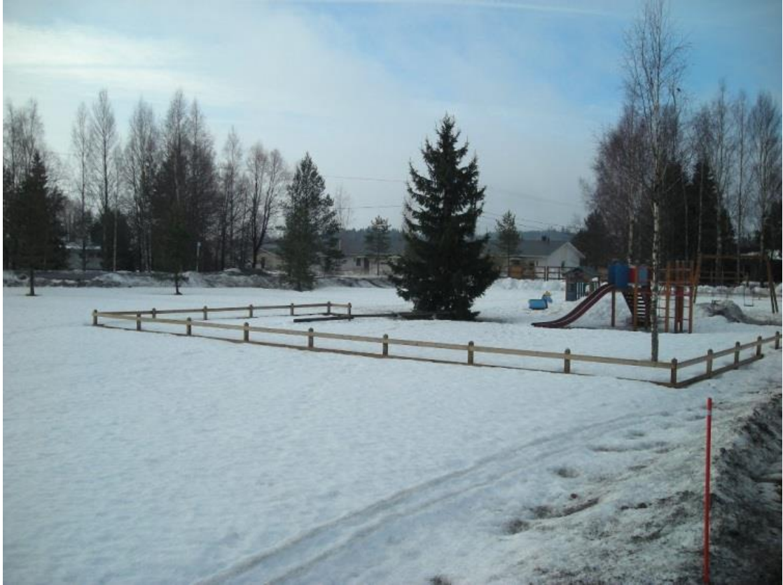
Kuva 1. Puisto ennen kunnostamista keväällä 2011. (Nikander, 2011).

Ennen suunnittelun alkua Salon Seudun Sanomissa oli ilmoitus vuoden budjetoiduista kohteista, johon puistoalue kuului. Tämän pohjalta otin yhteyttä Vaskion puiston suunnittelusta ja rakentamisesta vastaavaan Salon kaupungin puistojen ja yleisten alueiden yksikköön. Useampien yhteydenottojen jälkeen saatiin vihdoinkin asioihin muutosta. Itse olin mukana alueen kehittämisessä muun muassa keräämällä puiston käyttäjiltä, MLL:n perhekahvilan jäseniltä sekä perhepäivähoitajilta palautetta. Kerätyn palautteen jälkeen toimitin yhteenvedon viheraluesuunnittelijalle, joka tunsu parhaiten leikkivälineet, niiden kunnon ja ennen kaikkea niitä koskevat standardit sekä laati toteutussuunnitelmat. Varsinaisessa neuvottelussa 20.4.2011 mukana olivat itseni lisäksi viheraluesuunnittelija ja kaksi kysymääni koti- ja koulutoimikunnan aktiivijäsentä. He olivat mukana tukemassa suunniteltua ajatusta puiston toiminnallisuudesta. Kerätyn palautteen pohjalta neuvottelimme parhaimmat ratkaisut budjettia silmällä pitäen. Kaikkia toiveita ei voitu toteuttaa ja saimme myös kuulla perustelut. Yllätykseksemme puistokäytävän osuus tuli loppujen lopuksi perustelemallemme paikalle.