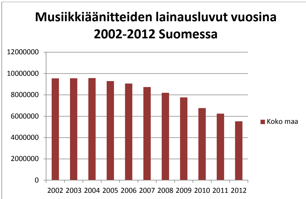
KUVIO 1. Suomen yleisten kirjastojen musiikkiäänitteiden lainausluvut 10 vuoden aikana. (Kirjastot.fi 2013, hakupäivä 15.10.2013).