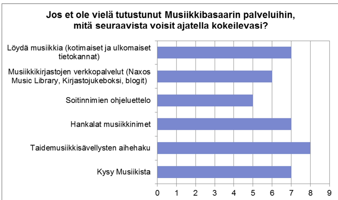
KUVIO 4. Kuvia palveluista, joita vastaajat voisivat kuvitella käyttävänsä.

Seuraava kysymys oli tarkoitettu lähinnä niille, jotka eivät vielä ole Musiikkibasaarin palveluita käyttäneet. Kun kysyttiin, mitä Musiikkibasaarin palveluita voisit ajatella käyttäväsi (kuvio 4), eniten ääniä sai taidemusiikkisävellysten aihehaku. Myös Kysy musiikista, Hankalat musiikkinimet ja Löydä musiikkia -palvelut saivat paljon ääniä. Kaikki palvelut saivat kuitenkin ääniä, joten on positiivista huomata, että palveluilla olisi niin sanotusti kysyntää.