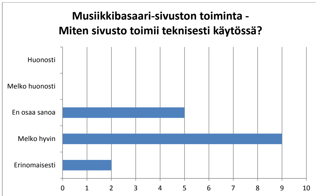
KUVIO 5. Musiikkibasaari-sivuston tekninen toimivuus. Vastaajia oli 16.

Jatkokysymyksenä kysyttiin, että jos on havainnut ongelmia sivuston teknisessä toiminnassa, mitä ongelmat ovat. Ainoastaan yksi viidestä vastaajasta vastasi, että jotkut linkit eivät toimi sivustolla. Suurin osa vastaajista jätti vastaamatta tähän kysymykseen.