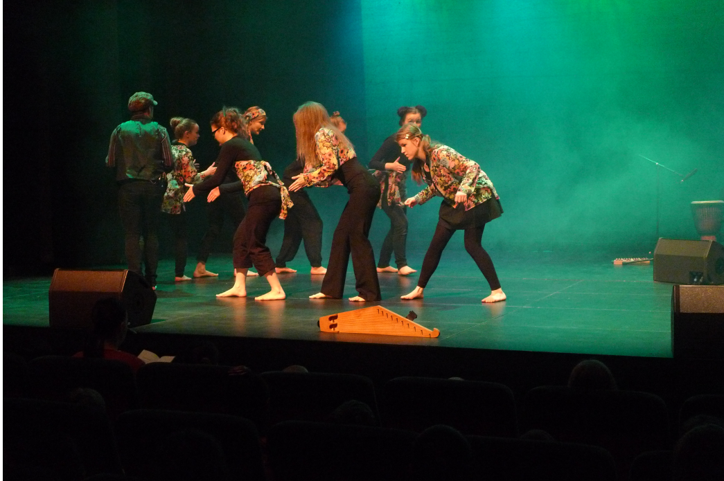
Kuva 6. Juna on pysähtynyt asemalle.

Esiintyjät kääntyvät jonoksi, josta tulee juna. Juna alkaa puksuttaa lavalla eteenpäin kierrellen ja kaarrellen. Juna pysähtyy asemilla. Päätepysäkkinä tällä a capella-junalla on Taikametsä.