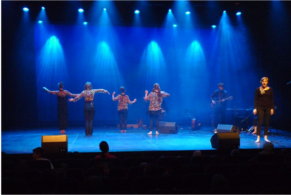
Kuva 14. Meduusat aloittavat hiljalleen tanssinsa.