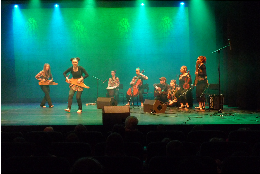
Kuva 7. Nallekarhut lähdössä liikkeelle.