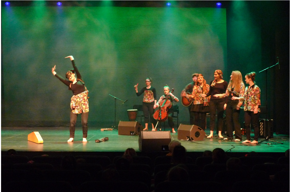
Kuva 11. Blueskissan herkkuhetki on alkamassa pienen aamuvenyttelyn jälkeen.