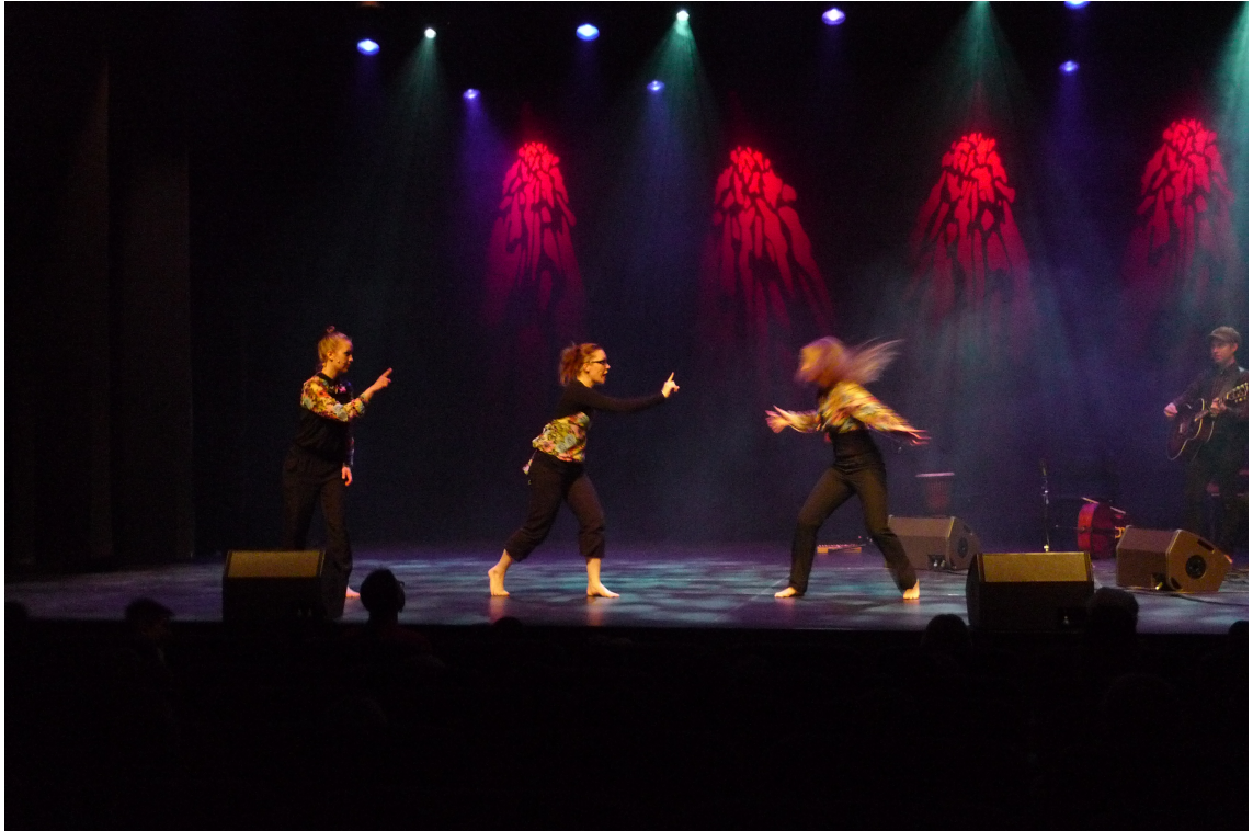
Kuva 10. Peikot matkimisleikissä.