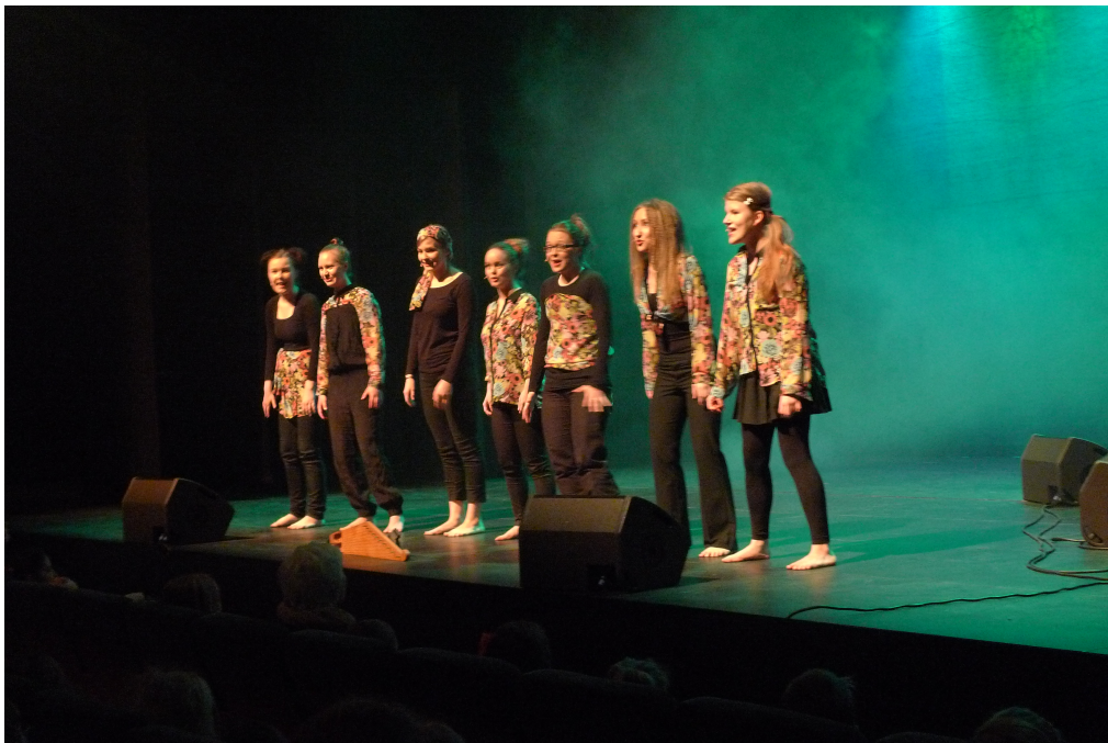
Kuva 5. Esiintyjät tulevat kertomaan yleisölle kevään saapuneen.

Aluksi soi pitkähuilu. Valaistukseltaan lava oli vihreä kuin metsä. Esiintyjät asettuivat lavalle stillikuvaksi yksitellen rakentaen metsän itsestään lavalle. Soiton loppuessa metsä alkaa elää. ”Kevät on tullut meille tänne.” –hokema alkaa iloisesti kaikua pitkin tätä metsää. Lopulta se yltyy rytmiseksi kehorytmi-iloitteluksi, kunnes se päättyy äkisti esiintyjien seistessä lavan reunalla.