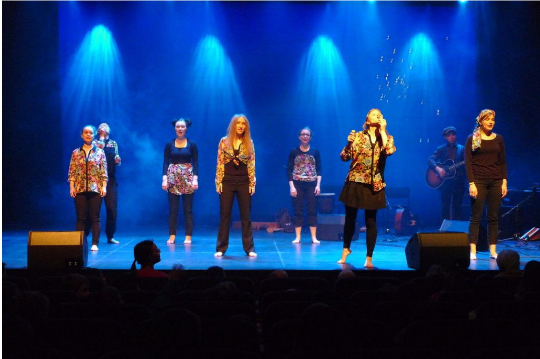
Kuva 13. Pieni krokotiili-kappaleen hellää tunnelmaa korostettiin puhaltamalla saippuakuplia.