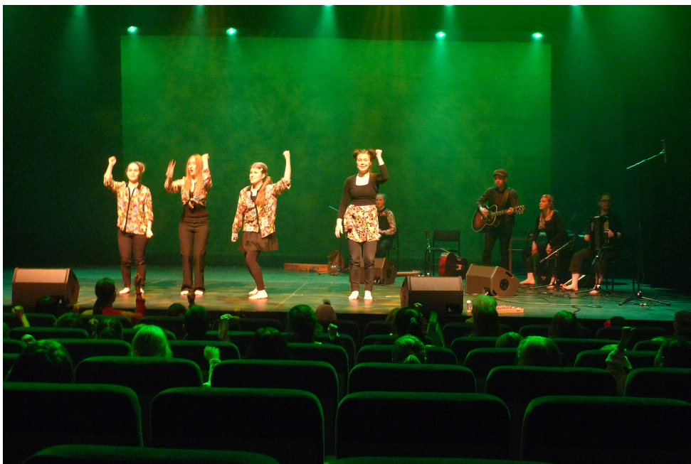
Kuva 15. Junan pillit tarkistetaan ennen kotiinpaluuta.

Alussa kuultu Juna-kappale kuullaan uutena sovituksena ja tällä kertaa lapset saavat osallistua mukaan junanpilleinä. Esiintyjä laskee neljään, jonka jälkeen kuuluu aina "Tuut tuut." ja matka jatkuu. Samalla esitellään esiintyjät ja kiitetään yleisöä konsertista. Tämän jälkeen juna saapuu päätepysäkille ja konsertti päättyy.