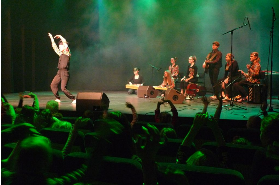
Kuva 12. Kokki osallistamassa lapsia räppisopan keittoon.