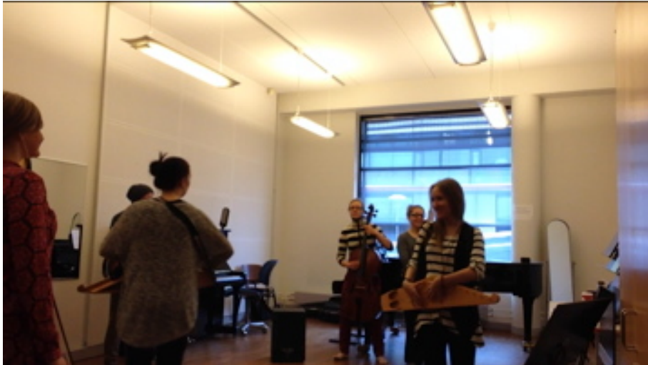
Kuva 3. Nallekarhuja -sovituksen jälkeen harjoittelimme siihen kuuluvan piiritanssin, jossa soitimme samalla

Ohjaajani antoi myös vinkkejä valo- ja äänisuunnitteluun. Sain esimerkiksi neuvoja lavakartan piirtämiseen, jotta valomies tietää, miten liikumme ja minkälaista tunnelmaa halusin mihinkin kohtaan esitystä. Äänimiehelle lähetin tarkan listan soittimista ja laulajien lukumäärästä. Teknisistä ongelmista ja tuottajan vaihtumisesta johtuen, pääsin valo- ja äänimiehen kanssa suunnittelutapaamiseen vasta päivää ennen konserttia, mutta ammattilaisten ja tarpeeksi tarkkojen suunnitelmien ansiosta, lopputulos oli hyvä. Jouduimme hieman myös pienentämään verhoilla lavaa, koska varsinaisia lavasteita ei ollut.