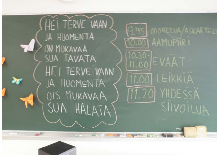
Kuva 3. Muksupiirin ohjelma

Seuraavassa kuvassa on liitutaulu, johon kirjoitetaan Muksupiirin ohjelma. Vanhemmat näkevät liitutaulusta, mitä on luvassa kyseisellä kerralla. Taulussa lukee aloituslaulun sanat. Laulun avulla toivotetaan perheet tervetulleiksi joka kerta. Aamupiirissä lauletaan usein myös muitakin lauluja.