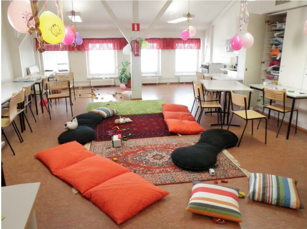
Kuva 4. Muksupiirin toimintaympäristö

Kuvassa on Muksupiirin tila vapputunnelmissa. Erivärisillä tyynyillä, matoilla ja ilmapalloilla tilasta on pyritty luomaan virikkeellinen ja viihtyisä.