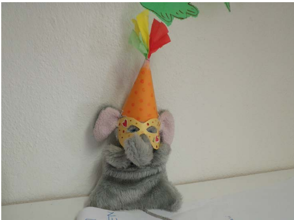
Kuva 1. Muksupiirin Paavo-norsu

Muksupiirille on varattu ammattikorkeakoulun tiloista yksi luokka ja käytössä on myös muita luokkia, esimerkiksi draamaluokka. Muksupiiri alkaa kello kymmenen, mutta perheet saattavat tulla paikalle jo puoli kymmeneltä. Toiminta alkaa aamupiirillä, jolloin ohjaajat kertaavat omat nimensä ja kertovat mitä on tiedossa. Aamupiirin aloittaa Paavo-norsu, joka on käsinukke, jota yksi opiskelijoista ohjaa. Paavo-norsu kyselee lasten kuulumiset ja kertoo myös omasta viikostaan. Paavosta on tullut suosittu lasten keskuudessa. Kuvassa Paavo on pukeutunut vappuasuun.