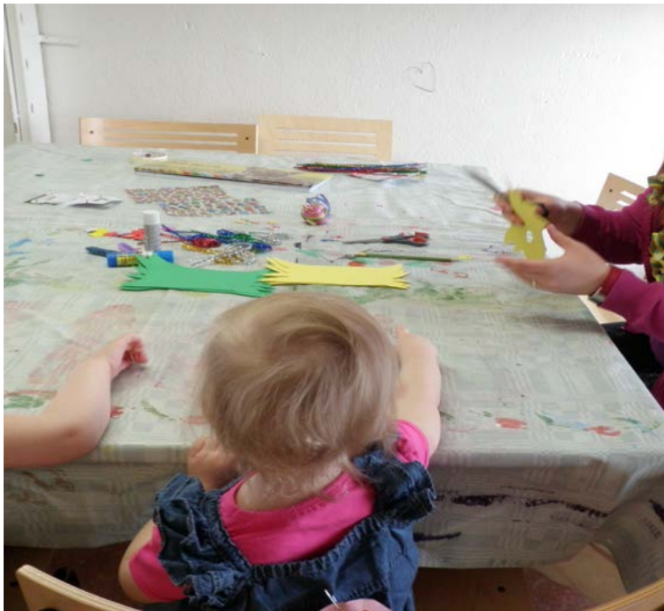
Kuva 2. Askartelutuokio

Alla olevassa kuvassa on askartelutuokio meneillään. Tällä kerralla askarreltiin vapunaamarit lapsille. Muksupiirin askartelut ovat olleet suosittuja ja lapset ovat olleet niistä ylpeitä.