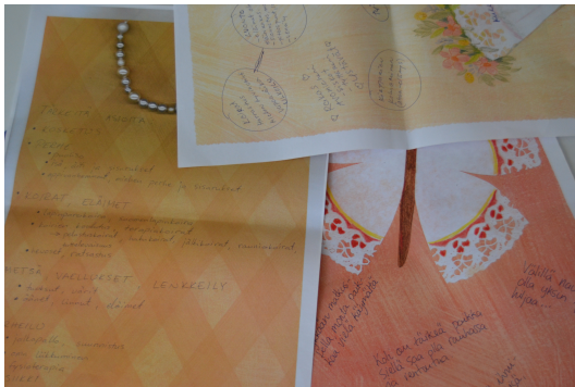
Kuvio 4. Työpajan Huoneentauluja

Todettiin, että kukaan ei halua seinälle, kaikkien nähtäville, intiimejä tai esimerkiksi hoitotoimenpiteisiin liittyviä asioita itsestään. Edellä mainitut tiedot toki helpottavat hoitajan työtä, mutta eivät kerro mitään asiakkaan persoonasta ja mielenkiinnon kohteista. Todettiin myös, että Huoneentaulua asiakkaalle tehtäessä olisi luontevaa käyttää apuna elämänkululomaketta. Tavoitteena on, että elämänkululomake täytetään yhteistyössä asiakkaan, omaisen ja hoitajan kanssa.