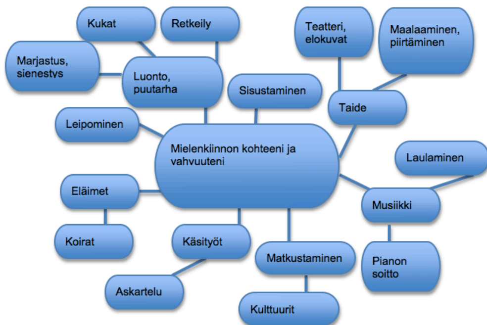
Kuvio 3. Esimerkki Mind mapista eli käsitekartasta

Mind map (kuvio 3) eli käsitekartta on kaavio, jonka avulla esitetään ideoita ja asioita, jotka liittyvät kartan keskelle sijoitettuun avainsanaan tai ideaan (Opetushallitus 2012). Käsitekartta auttoi työpajaan osallistuneita hahmottamaan ja havainnollistamaan omia vahvuuksiaan ja mielenkiinnonkohteitaan.