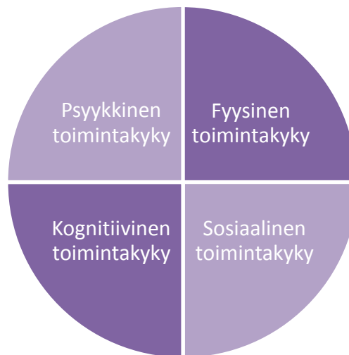
Kuvio 1. Toimintakyvyn muodostama kokonaisuus (mukaillen Lähdesmäki & Vornanen 2009, 17)

neksella yli 75 -vuotiaalla ja joka toisella yli 85 -vuotiaalla. (Eloranta & Punkanen 2008, 9-10.)