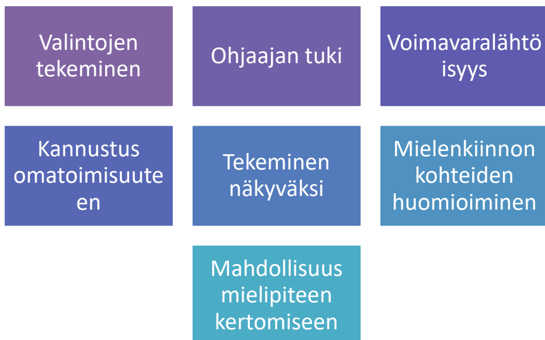
Kuva 3. Osallisuuden edistäminen

Raakahavainnoista nousseet teemat vastauksena kysymykseen: ”Millä keinoilla osallisuutta voi edistää taidetoiminnassa?” ovat kuvassa 3.