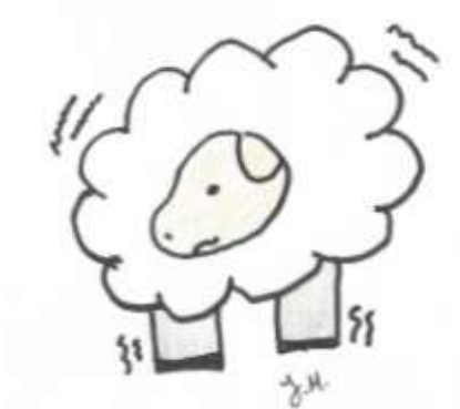
Kuva 2: Pelokas lammas

Elämä ei aina ole iloista, sillä siihen kuuluu väistämättä myös surullisia hetkiä, pettymyksiä ja vastoinkäymisiä. Lapsi oppii kotoaan, miten elämän vastoinkäymisiin suhtaudutaan. Vanhemmat voivat huomaamattaan luoda lapsilleen epätoivon tulevaisuutta kohtaan vaikeina hetkinä. Tärkeää olisikin kiinnittää huomiota siihen, minkälaisen mallin haluaa antaa lapsilleen, kun vastassa ovat elämän vaikeudet. (Ijäs 2009, 133.) Tähän pyrin antamaan vastauksia kirjani kertomuksilla. Esimerkiksi kertomus eksyneestä lampaasta antaa voimaa ja toivoa parempaan. Siinä lammas "karkaa" ja lähtee yksin seikkailemaan. Pian lammas kuitenkin huomaa, että yksin on pelottava olla pimeässä ja nälissään (KUVA 2).