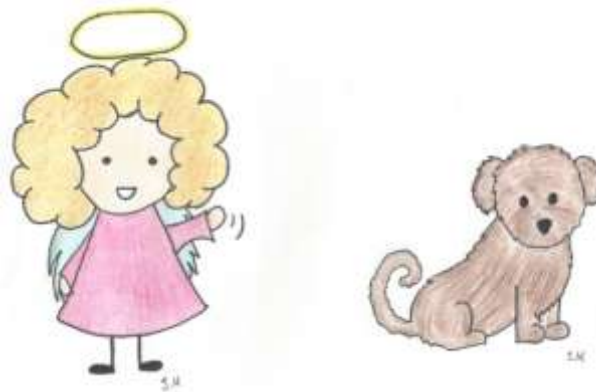
Kuva 3: Ellen- enkeli ja Bona

kokonaisuudessaan yksinkertaisen kaunis (KUVA 3). Päädyin enkelin valintaan päähenkilöksi myös siksi, että enkelit ovat hahmoja, jotka tuovat lapselle turvaa ja lohdutusta. Kristinuskossa enkelit myös mielletään todeksi ja siksi ne ovat niin tärkeitä lapsille (Ylönen & Luumi 2002, 41). Ellen- enkeli toimii myös kertomusten kertojana. Tällä haluan luoda lapselle tunteen, että hän elää itse kertomuksissa mukana. Lapsi pääsee Ellen- enkelin kanssa seikkailemaan Raamatun kertomuksiin ja auttamaan häntä tarvittaessa. Samalla Ellen- enkeli toimii myös eräänlaisen vanhemman roolissa. Lapsi voikin rinnastaa enkelin omiin vanhempiansa ja samaistua itse kirjan toiseen päähenkilöön. Vanhempi lapsi voi taas kokea samaistuvansa nimenomaan enkeliin, joka seikkailuillaan valloittaa maailmaa ja uskomalla Jumalaan selviytyy elämässään ja tehtävissään eteenpäin.