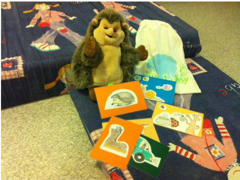
Kuva 2: Herra Siili ja lorukortteja ensimmäisellä tuokiolla