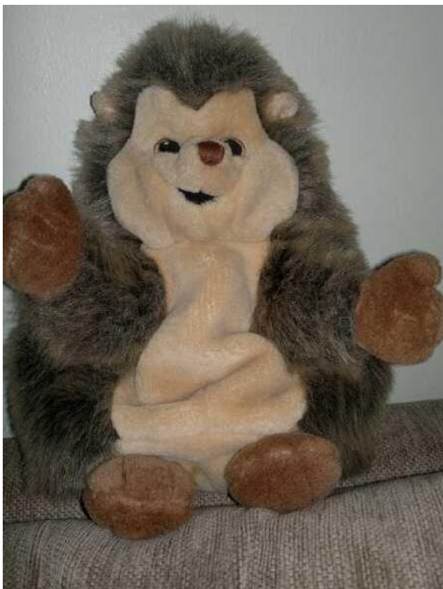
Kuva 1: Kirpputorilta löytynyt siilikäsinukke sai nimen Herra Siili

luontoaiheen ympärille erilaista luovaa toimintaa. Pohdimme kahden eri ryhmän toteuttamista, jotta voisimme vertailla suoritustamme kahden eri ryhmän välillä ja silloin myös mahdollisimman moni lapsi pääsisi toimintaan mukaan. Opinnäytetyömme suunnitelmaseminaari pidettiin 2. huhtikuuta 2013 ja tämän jälkeen laitoimme tutkimuslupahakemuksen vireille Vantaan kaupungin sivistystoimelle.