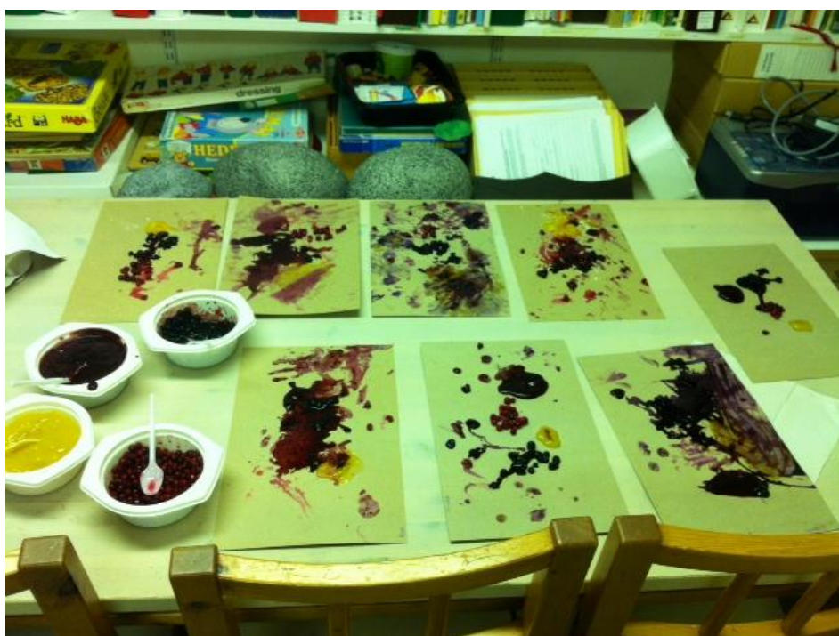
Kuva 6: Molempien ryhmien valmiit tuotokset kuivumassa

Tuokioiden jälkeen meiltä jäi vielä ylimääräisiä marjoja ja soseita, joten jätimme ne työntekijöiden luvalla odottamaan mahdollista seuraavaa käyttäjää. Myöhemmin kuulimme, että päiväkodin toinen lapsiryhmä olikin käyttänyt loput maalaustarvikkeet omiin värikylypökykeiluihinsa. Ryhmän lapset olivat 3-5-vuotiaita ja he olivat myös innostuneet ja tykänneet maalauksesta syötävillä väreillä. Värikyly-metodin soveltaminen päiväkodissa oli nostanut esiin myös yleistä keskustelua työntekijöiden välillä. Osa työntekijöistä mietti, oliko lasten sovelias antaa ”leikkiä” ruualla ja heittää ruokatarvikkeita hukkaan. Muutamat työntekijät taas innostuivat toiminnasta niin, että voisivat kokeilla värikylyä vielä uudemman kerran.