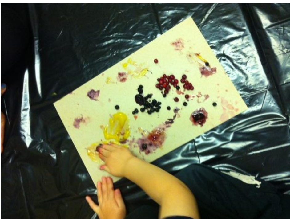
Kuva 4: Maalaustouhua parhaimmillaan

Aikaa kului huomaamatta puolisen tuntia, ja kun lasten paperit alkoivat olla täynnä väriä, siirryimme vähitellen käsienpesulle. Pestyään kädet lapset saivat silittelä Herra Siiliä sillä aikaa, kun odottelivat muita. Lopuksi lauloimme maalausalueen sivussa loppulaulun (liite 3) ja vilkuttelimme ”heipat” Herra Siilille, joka kömpi tutusti omaan pussukkaansa. Isojen ryhmän