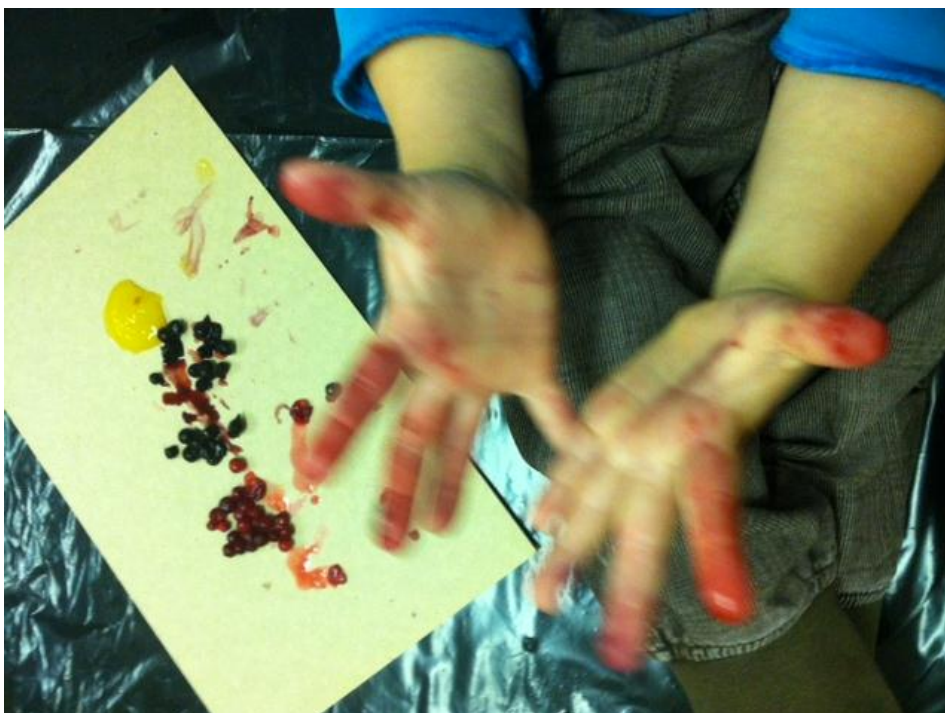
Kuva 5: Käsien tahriintuminen oli jännittävää