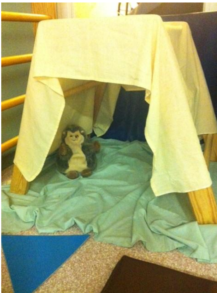
Kuva 9: Tunnelin toisessa päässä odotti Herra Siilin pesäkolo