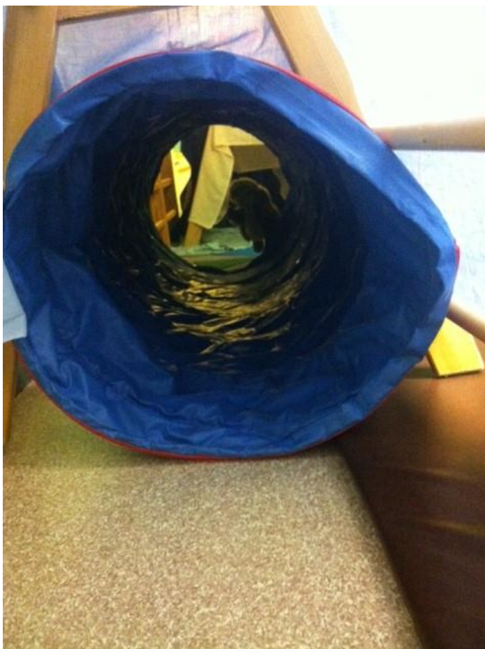
Kuva 8: Tunneli, joka oli jännittävä, mutta siitä huolimatta lasten suosikki