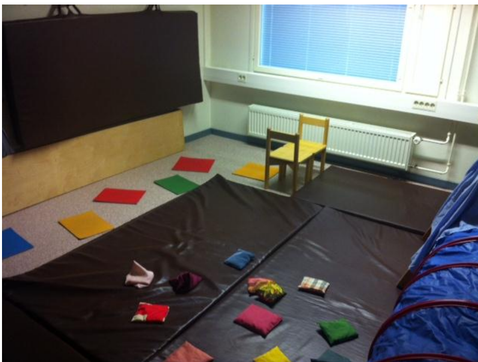
Kuva 7: Joen ylitys kiviä hypellen (värikkäät lätkät) sekä vuoren ylitys (kaksi tuolia)

Tuokion aloitukseen ja tempurataan olimme varanneet aikaa noin 10-15 minuuttia. Tämän jälkeen oli vuorossa ”Herra Siilin läksiäistanssit”, jossa ideana oli innostaa lapsia tanssimaan vapaasti valitsemamme musiikin tahtiin erilaiset huivit rekvisiittana. Tanssin musiikkina soitimme kappaleen Kuulle ystäväksi albumilta Silkkipaperitaivas - rakastamislauluja vauvalle . Tanssin jälkeen oli vuorossa lyhyt rentoutus, joka tapahtui vaihtamalla musiikki rauhallisempaan Silkkipaperitaivaan takana - kappaleeseen samalta cd:ltä. Samalla hämärsimme tilan sammuttamalla valot ja kehotimme lapsia käymään pitkälle patjoille. Rentoutuksen jälkeen laitoimme valot takaisin päälle, kehotimme lapsia nousemaan ylös ja päätimme tuokion Loppulauluun (liite 3).