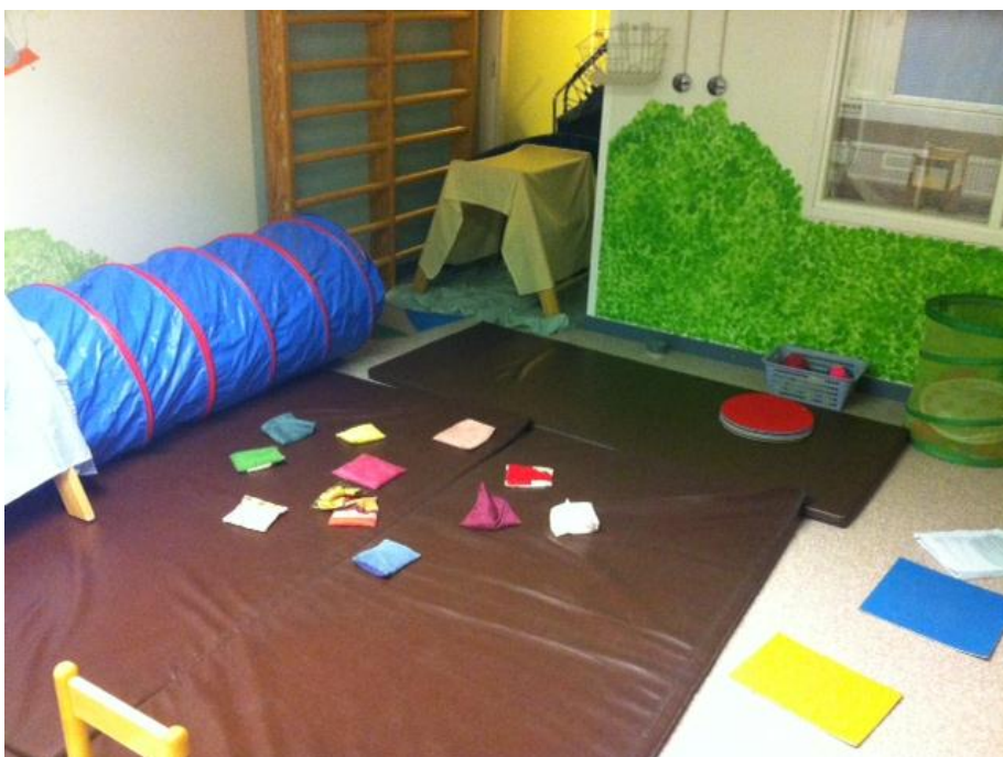
Kuva 10: Herra Siilin metsään levinneitä tavaroita (hernepussit) heiteltiin vihreään koriin