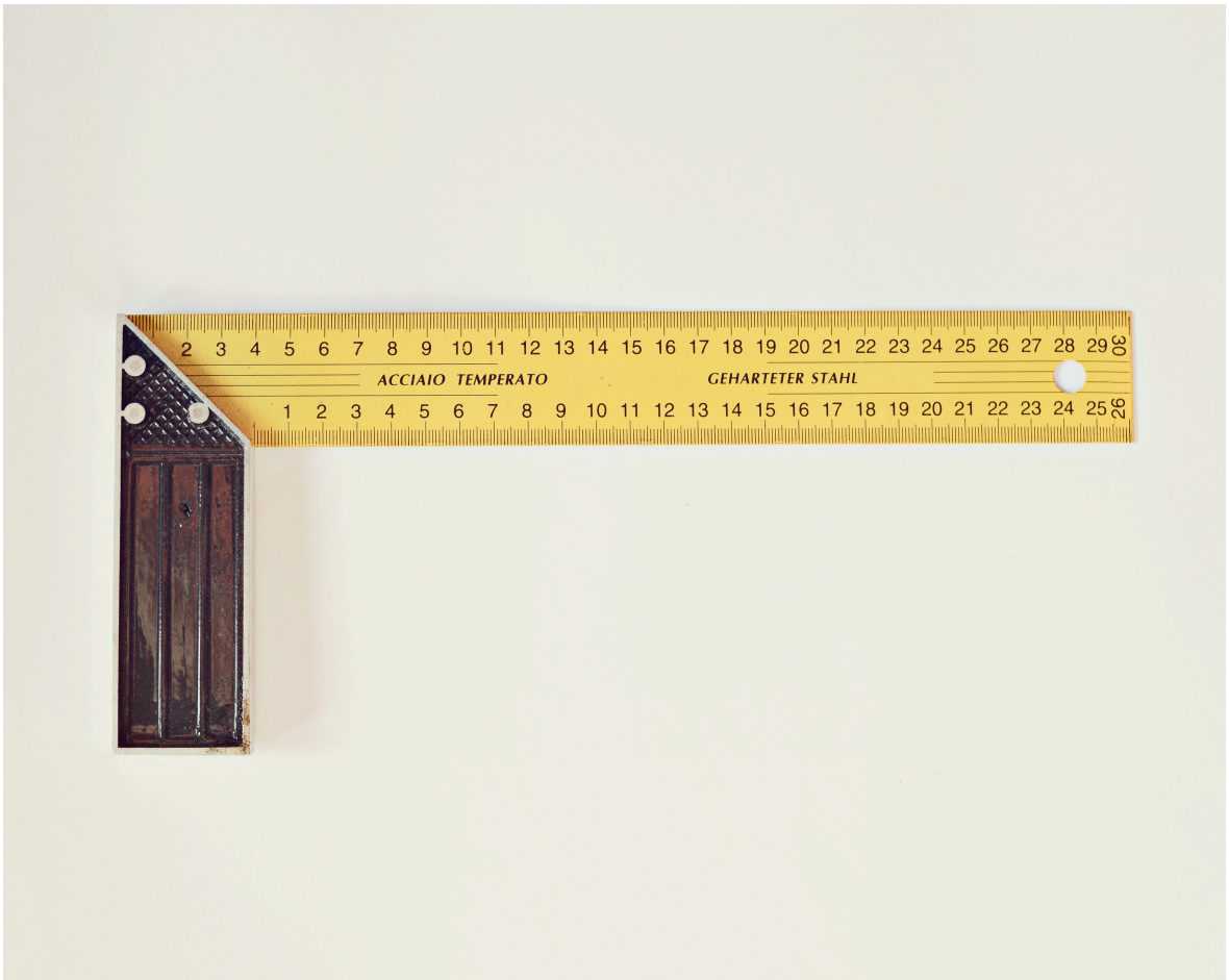
Kuva 4. Nimetön.