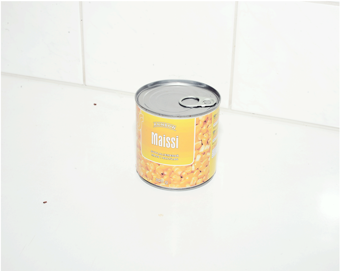
Kuva 3. Nimetön.