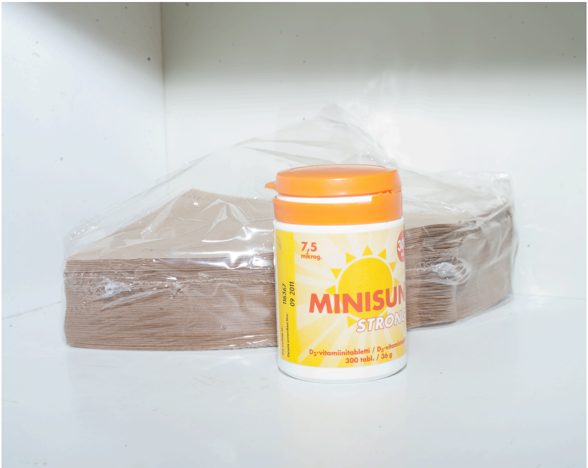
Kuva 5. Nimetön.