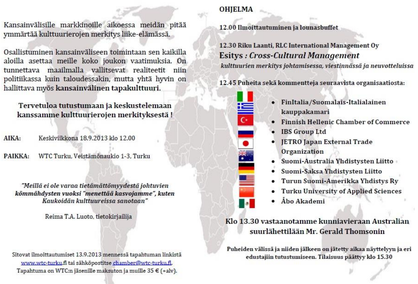
Figur 1. Programbladet

Dagen innan evenemanget gick jag till WTC Turku för att förbereda evenemangsplatsen. Vi ordnade borden längs sidorna av konferensrummet så att det skulle förbli utrymme för deltagarna att röra sig i. Dessutom hade vissa av representanterna redan i förväg fört sitt material till WTC Turku och dessa lades ut på borden samtidigt som ländernas flaggor placerades på borden. Under samma dag gjorde jag också en sista kontroll över att allt är färdigt inför evenemanget och printade ut programblad.