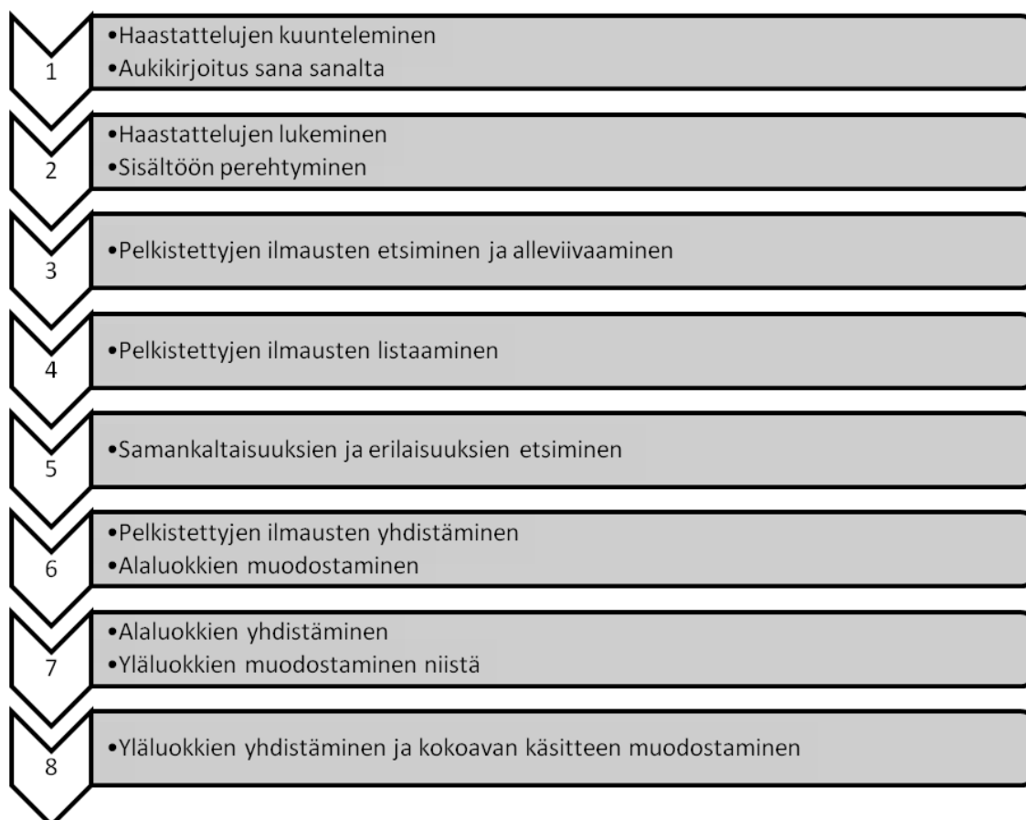
Kuvio 2: Sisällönanalyysin eteneminen (mukaillen Tuomi & Sarajärvi 2011)

Sisällönanalyysillä tarkoitetaan kerätyn aineiston tiivistämistä niin, että tutkittavia ilmiöitä voidaan yleistävästi kuvailla, tai että tutkittavien ilmiöiden väliset suhteet saadaan esille. (Latvala & Vanhanen-Nuutinen 2003.)