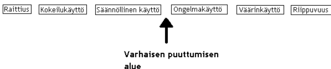
Kuvio 1: Nuorten päihteiden käyttöön puuttuminen (mukaillen Pirskanen 2007)

Viime vuosina on toteutettu valtakunnallista Varpu -hanketta (varhainen puuttuminen) Sosiaali- ja terveysministeriön johdolla. Tavoitteena on edistää lasten ja nuorten sekä lapsiperheiden hyvinvointia sekä ehkäistä syrjäytymistä antamalla koulutusta ja jakamalla tietoa varhaisen puuttumisen ja tukemisen hyvistä käytännöistä ja kehittämällä lasten ja nuorten kanssa toimivien tahojen yhteistyötä. (Sisäasiainministeriö 2007.) Päihdeongelmien ja sitä kautta myös syrjäytymisen ehkäisemiseksi varhainen puuttuminen on erityisen tärkeää. Varhaisen puuttumisen tärkein osa-alue on kokeilukäytön ja riippuvuuden välimaastossa (Kuvio 1).