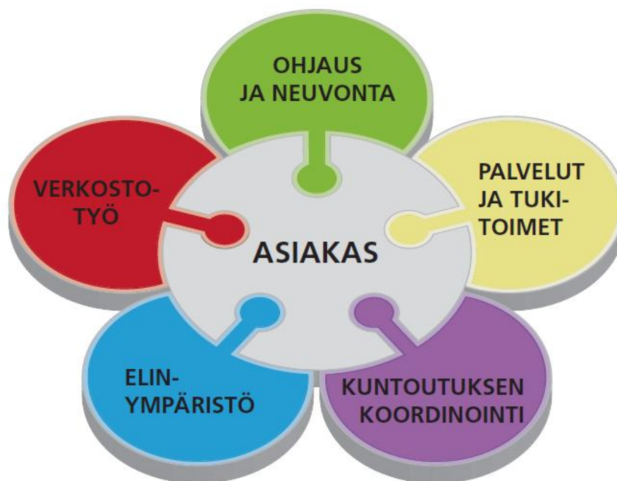
Kuvio 3. Kuntoutusohjaus koostuu useasta osa- alueesta (RAY juliste Suomen kuntoutusohjaajat. 2011).

Kuntoutusohjauksesta käytetään englannin kielessä termiä rehabilitation counselling. Alla oleva kuva (Kuvio 3.) havainnollistaa kuntoutusohjaajan osaamisen tärkeyttä moniammatillisen yhteistyössä.