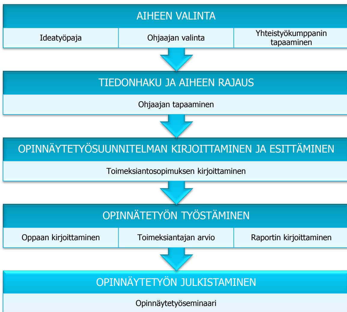
Kuvio 1. Opinnäytetyöprosessi (katso Savonia-ammattikorkeakoulu 2010)

Opinnäytetyön työstäminen alkoi tiedonkeruulla. Tiedonhaun avulla koottiin ajantasaista tutkimustietoa (Liite 1.) Elsevier ScienceDirect, Cinahl-, Cochrane- ja Medic-tietokannoista. Opinnäytetyön pohjana käytetyt tutkimukset on koottu tutkimustaulukkoon (Liite 1). Ensin kirjoitettiin opinnäytetyön suunnitelma, jonka jälkeen aloitettiin produktin eli oppaan tekeminen. Toimeksiantaja ja opinnäytetyön ohjaaja antoivat palautetta produktista. Opinnäytetyön kirjoittaminen eteni prosessikirjoittamisen periaatteiden mukaisesti (Airaksinen 2009). Opinnäytetyöprosessin eteneminen ilmenee oheisesta kaaviosta (Kuvio 1.)