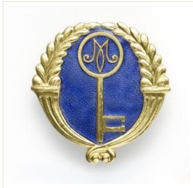
Kuva 3: Marttojen erikoisavain -rintamerkki (Martat 2013)

Ennen erikoisavainopintojen aloittamista tulee opiskelijalla olla suoritettuna III-taitoavain. Erikoisavainten ohjauksesta ja arvioinnista vastaavat Marttaliiton toimihenkilöt. Erikoisavaimen suorittaminen perustuu vapaaehtoistyöhön. Se on syvällisempää erikoistumista johonkin Marttajärjestön aiheeseen. Henkilökohtaisen opetussuunnitelman, perusopintojen, syventämisen ja toimintatapahtuman järjestämisen jälkeen tehdään osaamiskansio ja itsearvio. Kokonaisuudessaan erikoisavain on 20 opintopisteen arvoinen opintokokonaisuus. (Martat, 2013.)