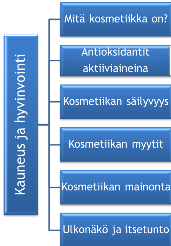
Kuvio 1: Kauneus ja hyvinvointi -teeman aihealueet Martat-lehteen

Opinnäytetyön toiminnallinen osuus käsittää kuusi lehtiartikkelia Marttaliitolle. Artikkelisarjaa käytetään myöhemmin myös järjestön opintomateriaalina. Artikkelien aiheet on esitetty alla olevassa kuviossa.