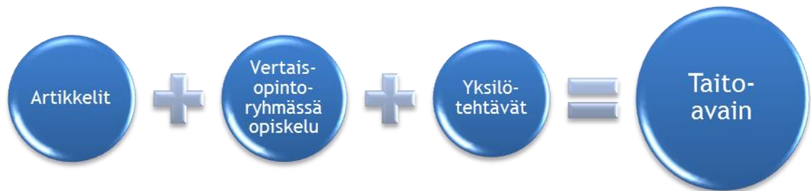
Kuvio 2: Artikkeleista taitoavaimeen

tavoitteleva jäsen tekee kirjalliset yksilötehtävät kulloinkin esillä olevasta aiheesta. Alla oleva kuvio (Kuvio 2) kuvaa sitä, kuinka artikkelit mahdollistavat taitoavaimen suorittamisen.