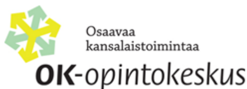
Kuva 5: Osaavaa kansalaistoimintaa - OK-opintokeskus-logo (OK-opintokeskus)

OK-opintokeskus on valtakunnallinen aikuisoppilaitos ja koulutuksen järjestäjä 67 valtakunnalliselle kansalaisjärjestölle. Niitä yhdistää puoluepoliittinen sitoutumattomuus.