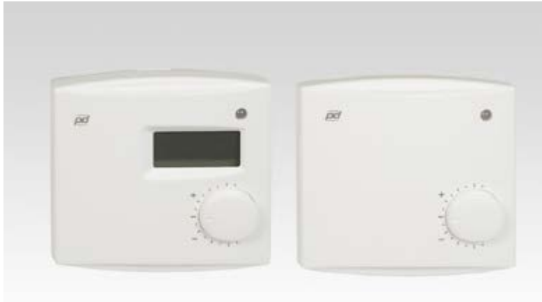
KUVIO 9. Lattialämmityssäädin HLS 16