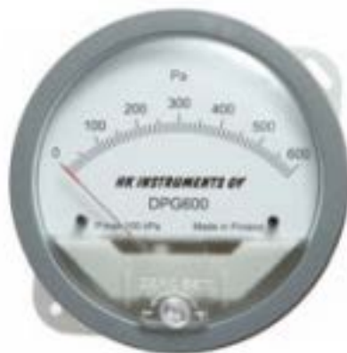
KUVIO 2. Kalvotoiminen paine-eromittari (DPG)

Kalvotoiminen paine-eromittari soveltuu parhaiten puhdastilojen ja vetokaappien paine-eron mittaukseen sekä ilmastointisuodattimien ja puhaltimien paine-eromittariksi. Sitä käytetään ilman ja neutraalien kaasujen mittaukseen. (HK Instruments Oy, Kalvotoimiset paine-eromittarit.)