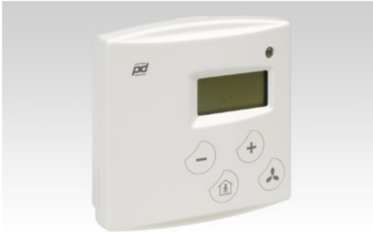
KUVIO 11. Huonesäädin HLS 34.