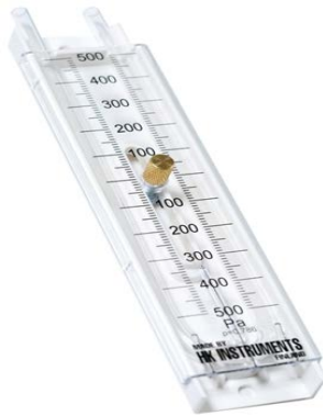
KUVIO 5. U-putkimanometri

Nestemanometrit soveltuvat parhaiten ilmastointisuodattimien likaantumisen tarkkailuun. Yritys valmistaa kolmea erilaista manometrimallia. Vinoputkimanometrit sopivat peruskäyttöön, pystyputkimanometrit suurille paineille ja U-putkimanometrit pienille paineille. (HK Instruments Oy, Nestemanometrit.)