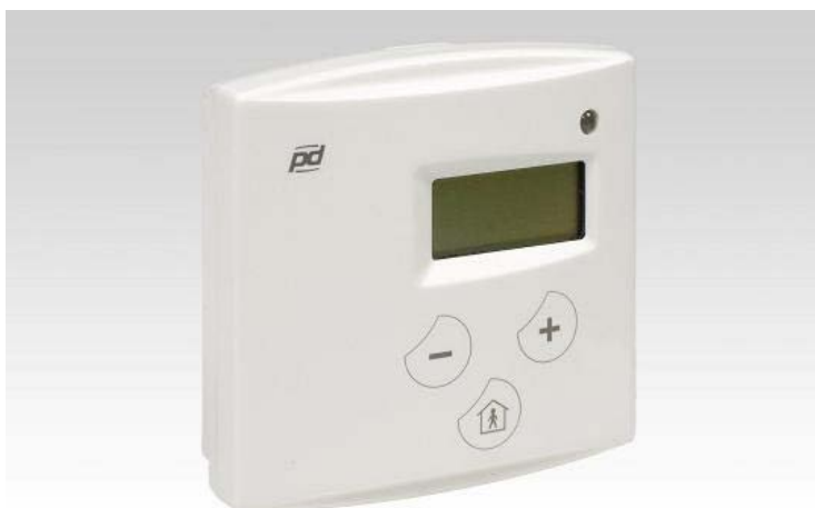
KUVIO 12 Lattialämmityssäädin HLS 35.

Kuten kaikki Pro dualin HLS- sarjan säätimet, myös HLS 35 tulee asentaa pinta asennuksena kuivaan tilaan.