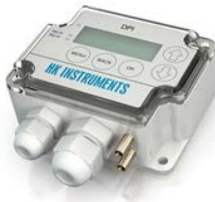
KUVIO 6. Elektroninen paine-erokytkin (DPI)

tä käytetään virtausnopeuden ja lämpötilan mittaamiseen ilmastointikanavissa. Elektroninen paine-erokytkin soveltuu rakennusautomaatio-, ilmastointi- ja puhdistilasovelluksiin. Hiilimonoksidilähetintä käytetään kyseisen kaasun havaitsemiseen tiloissa joissa sitä esiintyy, esimerkiksi parkkihalleissa, autotalleissa, varastoissa ja tehtailla. Kosteuslähetintä on mahdollista saada kanavamallina, jota käytetään ilmanvaihtokanavissa tai sitten perusmallina, jota puolestaan käytetään huonetiloissa suhteellisen kosteuden mittaamiseen. Molemmat mallit on mahdollista saada myös lämpötilanmittauselementillä varustettuna. (HK Instruments Oy, Ilman virtauslähetin; HK Instruments Oy, Elektroninen paine-erokytkin; HK Instruments Oy, Hiilimonoksidilähetin.)