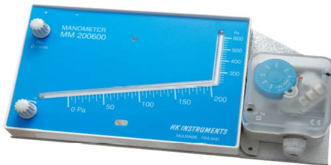
KUVIO 6. Manometri/PS- yhdistelmä

Tuotevalikoimaan kuuluvat myös manometri/PS- sekä DPG-PS- yhdistelmät. Jokaisen tuotteen osalta valmistetaan eri malleja ja eri painealueelle soveltuvia tuotteita. Kaikkia tuotteita on mahdollista kustomoida asiakkaiden tarpeiden ja toiveiden mukaisesti. HK Instruments myös jälleenmyy rakennusautomaatioon suunnattuja tuotteita.