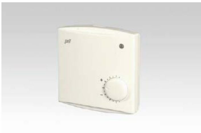
KUVIO 10. Huonelämpötilasäädin HLS 21

2-portainen säädin huonekohtaiseen lämpötilan säätöön. Termomoottorit soveltuvat myös näiden säätimien toimilaitteiksi, erona edelliseen säätimen tekniikkaan, näissä HLS 21- sekä HLS 21-EXT- malleissa lämmitykselle ja jäähdytykselle on molemmille omat toimilaitteensa, tarvitaan siis kaksi termomoottoria. HLS 21- mallissa lämpötilan mittaaminen tapahtuu laitteen sisäisellä NTC10 anturilla. HLS 21-EXT- malli sisältää liittimen, johon voidaan kytkeä ulkoinen lämpötila-anturi. Muuta eroa näillä HLS 21 ja HLS 21-EXT huonelämpötilasäätimillä ei olekaan. (Huonelämpötilasäädin HLS 21 2012.)