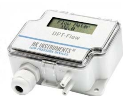
KUVIO 4. Ilman tilavuusvirtaus- ja nopeusmittari (DPT-Flow)

Ilman tilavuusvirtaus- ja nopeusmittari on suunniteltu käytettäväksi yleisimpien radiaalipuhaltimien kanssa. DPT-Flow näyttää halutun puhaltimen ja virtauksen kätevästi mittarin näytöllä. (HK Instruments Oy, Flow meter for fun control.)