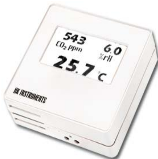
KUVIO 7. Kosteuslähetin (RHT)