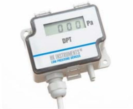
KUVIO 3. Paine-erolähetin (DPT)

Instruments valmistaa myös puhdastiloihin ja sairaalaympäristöihin soveltuvaa DPT-Span lähetinmallia. Tämän paine-erolähtetimen tekee erityisen tarkaksi sen kalibrointimahdollisuudet, se voidaan kalibroida sekä nolla- että yläpisteen kohdalta. (HK Instruments Oy, Paine-erolähtetimet; HK Instruments Oy, Paine-eromittari yläpisteen säädöllä.)