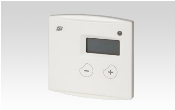
KUVIO 13 Yleissäädin HS 2.2.