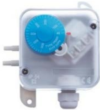
KUVIO 1. Paine-erokytkin (PS)

Kalvotoiminen paine-eromittari soveltuu parhaiten puhdastilojen ja vetokaappien paine-eron mittaukseen sekä ilmastointisuodattimien ja puhaltimien paine-eromittariksi. Sitä käytetään ilman ja neutraalien kaasujen mittaukseen. (HK Instruments Oy, Kalvotoimiset paine-eromittarit.)