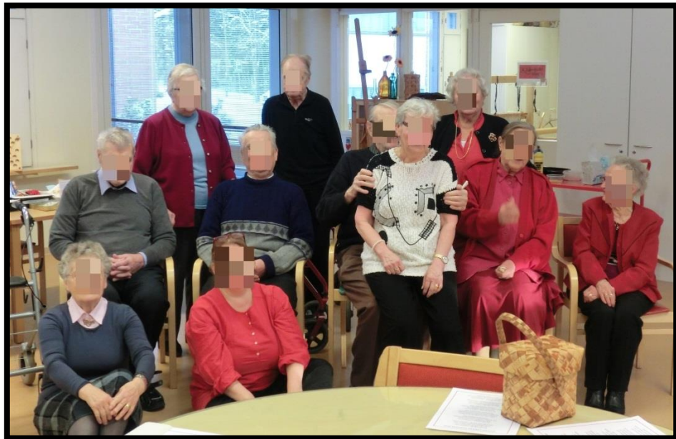
Kuva 2. Martin valokuva-albumista perhepotretti (kuvaa on käsitelty osallistujien anonymiteetin säilyttämiseksi.)

Pullaukko-työtavan, hahmon puvustamisen ja kuumen tuolin kautta Martti hahmona oli jo melko selkeä. Halusin saada osallistujat vielä syvemmälle Martin ajatuksiin ja elämään tekemällä tilannekuva- nimisen työskentelytavan. Siinä selataan yhdessä ideoidun hahmon valokuva-albumia ja esite-tään valokuvia patsastyöskentelyllä. Tämä työtapa vaatii osallistujilta heit-täytymistä, luottamusta ryhmässä ja myös mielikuvitusta. Kaikki osallistu-jat työskentelevät rooleissa yhtäaikaaisesti. Alla olevassa kuvassa (kuva 2) osallistujat esittävät yhdessä luodun roolihahmon, Martin perhepotrettia. Jokainen osallistuja sai itse luoda hahmon valokuvaan. Osallistujat loivat kuvaan niin Martin kissan, koiran kuin myös isotäidin ja teini-ikäisen nuoren.