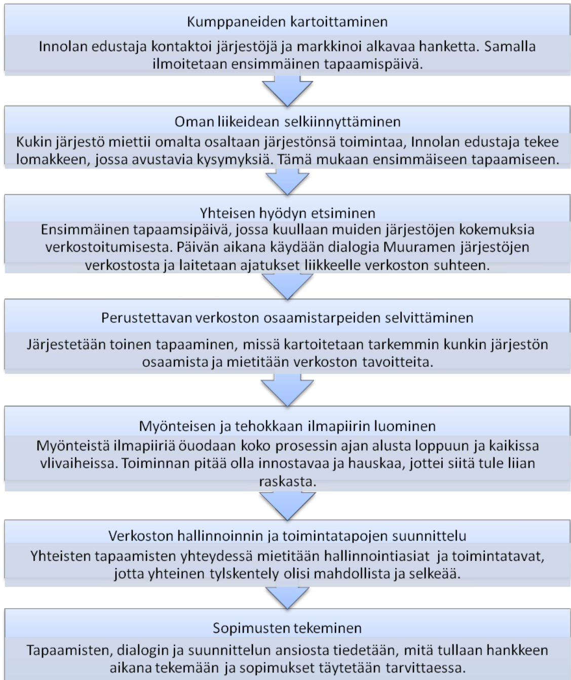
Kuvio 2. Verkoston luomisen askeleet Muuramessa. (Hakanen ym. 2007, 68)