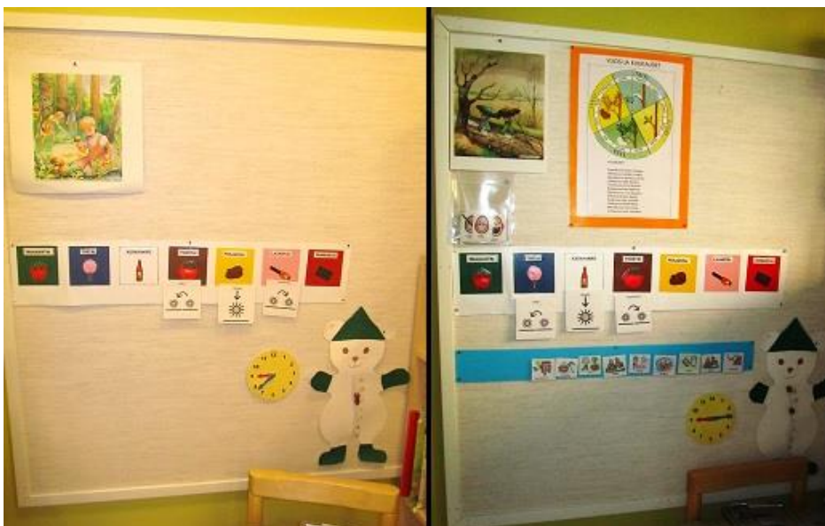
Kuva 12: Lepuhuoneen ilmoitustaulu ennen ja jälkeen

Kuva, jossa on nimetty kuukaudet sijoitettiin yksittäisen kuukausikuvan viereen ilmoitustaululle (Kuva 12). Samalla taululla oli kehittämistyön loppuessa siis kuukausikuvat, viikonpäivät, päiväjärjestys, sekä kello ja säähahmo. Toisen kuukausikuvan kiinnitin aakkoskuvan kanssa tyhjälle ilmoitustaululle kotileikinurkkaukseen (Kuva 13).