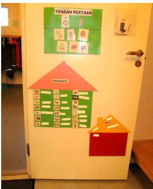
Kuva 4: Talot ja vaatekuvat pesutilan ovesta

Kun olin saanut edellä mainitut kuvat valmiiksi, minulle tuli tarve laatia kuvien käytön havainnointilomake (Liite 3) nopeasti työntekijöiden käytettäväksi. Laadin lomakkeen loppuviiikon aikana ja toisen kuvien laatimisviikon alussa annoin kopioituja lomakkeita työntekijöille täytettäväksi. Kehotin heitä täyttämään lomakkeita niin, ettei siitä muodostu suurta rasietta ja sanoin lomakkeen tarkoitukseksi pääasiassa sen, että työntekijä todella miettisi kuvien