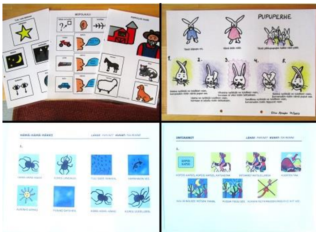
Kuva 5: Kuvitettuja lauluja

Toisella kuvien laatimisviikolla vein päiväkotiryhmään kuvitettuja lauluja (Kuva 5). Kopioin erään toisen päiväkodin laulukokoelmasta 10 kuvitettua laulua. Laulut olivat perinteisiä ja tuttuja lastenlauluja, kuten Piippolan vaari , Kolme varista , Tuiki tuiki tähtönen ja Pienet sammakot . Lisäksi laadin kahden laulun sanat ja kuvat käyttäen Papunetistä löytynyttä materiaalia, jota muokkasin Word-ohjelmalla suurentaen kuvia ja poistaen muutaman mielestäni tarpeettoman kuvan välistä niin, että yksi laulusäkeistö mahtui yhdelle A4-arkille. Nämä laulut olivat Intiaanit (Kopsis kopsis, kopsis kopsis ratsastaa...) sekä Hämä-hämähäkki . Muokkasin aikaisemmin harjoittelussani laatimat kortit Pupuperhe-laulusta (Tässä isä pupu on, tässä äidin näät...) niin, että ne mahtuivat yhdelle A4-arkille teksteineen. Otin koululla värillisen kopion laulusta. Laulujen säilytystä varten otettiin käyttöön oma kansio. Kaikki laulut otettiin innolla vastaan ja yksi laulamisesta ja musiikista kiinnostunut työntekijä otti ne heti käyttöönsä.