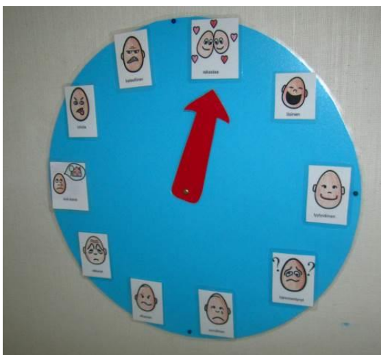
Kuva 6: Tunneympyrä

Pääsin viimein käyttämään Boardmaker® -ohjelmaa. Laadin PCS-kuvista kuvat päivärytmiin, tunnekuvat tunneympyrään (Kuva 6), askartelun vaihekuvat sekä kuvat WC-tilaan pöntön vetämisestä muistuttamiseen. Tein tunnekuville pyöreän sinisen alustan ja sen keskelle punaisen nuolen. Kiinnitin tunneympyrän ryhmätilan ilmoitustaulun alareunaan, jotta lasten on helppo sitä myös itsenäisesti tutkia ja katsella. Lisäksi tein päivärytmiä kuvaaville kuville sinisen alustan, johon kaikki päiväjärjestys-kuvat mahtuvat vierekkäin. Päivärytmikuvat kiinnitin ilmoitustaululle viikonpäiväkuvien alapuolelle. Vaihtuvia kuvia (askartelu, jumppa, metsäretki, lukuhetki jne.) varten kiinnitin ilmoitustaululle pienen muovitaskun.