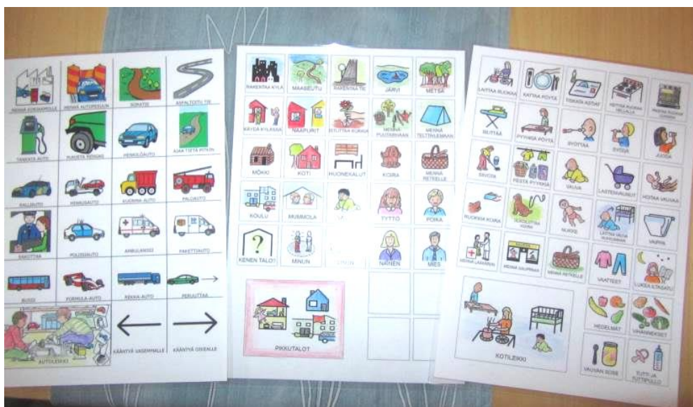
Kuva 11: Kuvatauluja leikkeihin

Laadin kuvatauluja leikkeihin Boardmaker® -ohjelmalla ja yhden taulun kokonaan Papunetin kuvista. Kuvatauluja (Kuva 11) syntyi kotileikkiin, junaleikkiin, kampaamoleikkiin, pikku talot -leikkiin, lääkrileikkiin, autoleikkiin sekä palikkaleikkiin sekä pelien pelaamiseen. Joitakin kuvia en kuvaohjelmasta löytänyt, joten täydensin tauluja Papunetin kuvilla liimaamalla ne tauluihin, joihin olin jättänyt tyhjiä ruutuja juuri näitä kuvia varten.