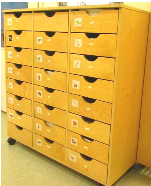
Kuva 3: Lokerikkokuvat