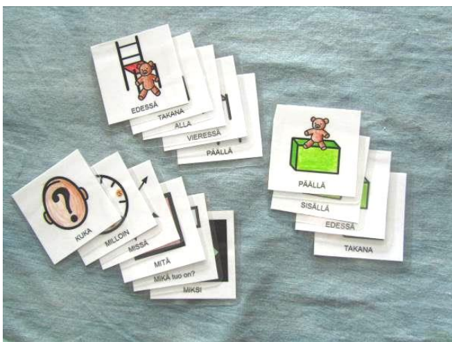
Kuva 8: Kysymyssana- ja paikanmäärekuvat

Ryhmän työntekijä kertoi tarpeesta paikanmäärekuville (edessä, takana, päällä, alla jne.) sekä kysymyssana-kuville (mitä, miksi, mihin, kuka, milloin jne.). Niinpä laadin näitä kuvia PCS-kuvina (Kuva 8). Kysymyssanoja ilmaisevat kuvat olivat hyvin abstrakteja ja mietin, miten lapset pystyvät ne hahmottamaan. Ilmaisin ajatukseni myös työntekijälle, joka oli samaa mieltä, mutta sanoi myös, että vaikea niitä (sanoja) on muulla tavoin kuvin ilmaista. Paikanmäärekuvat laadin joko laatikon ja nallen tai tuolin ja nallen kuvia käyttäen. Yhden kuvan jouduin piirtämään itse toista paikanmäärekuvaa apuna käyttäen.