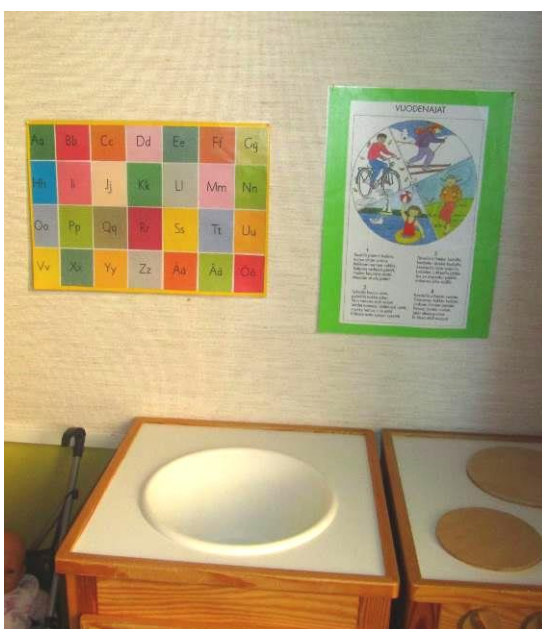
Kuva 13: Aakkos- ja vuodenaikakuvat