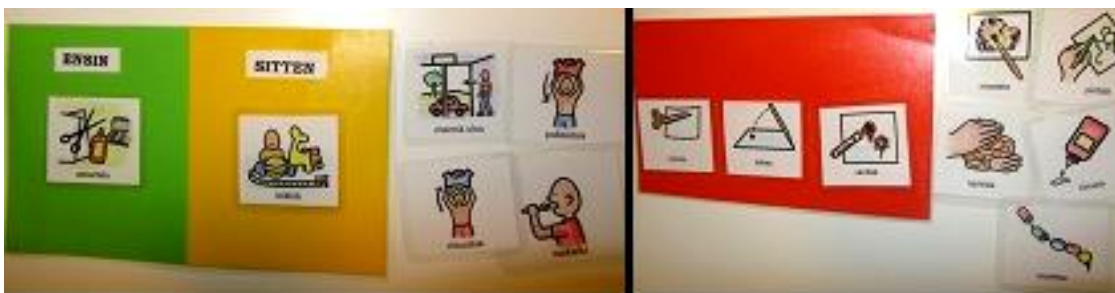
Kuva 7: Ensin ja sitten -kuvat sekä askartelun vaihekuvat

Ryhmän työntekijä kertoi tarpeesta paikanmäärekuville (edessä, takana, päällä, alla jne.) sekä kysymyssana-kuville (mitä, miksi, mihin, kuka, milloin jne.). Niinpä laadin näitä kuvia PCS-kuvina (Kuva 8). Kysymyssanoja ilmaisevat kuvat olivat hyvin abstrakteja ja mietin, miten lapset pystyvät ne hahmottamaan. Ilmaisin ajatukseni myös työntekijälle, joka oli samaa mieltä, mutta sanoi myös, että vaikea niitä (sanoja) on muulla tavoin kuvin ilmaista. Paikanmäärekuvat laadin joko laatikon ja nallen tai tuolin ja nallen kuvia käyttäen. Yhden kuvan jouduin piirtämään itse toista paikanmäärekuvaa apuna käyttäen.