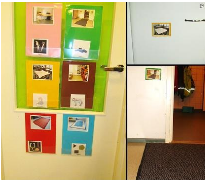
Kuva 2: Leikinvalintataulu ja leikkipaikkakuvat omilla paikoillaan

Ensimmäiseksi tein leikinvalintataulun eli leikkikartan (Kuva 2) sekä sitä varten pieniä eläinkuvia. Jokaisesta leikkipaikasta (6) laadin kaksi värillistä valokuvaa. Jokainen kuvapari sai oman värikoodinsa taustalle. Toinen kuvista sijoitettiin itse leikkipaikkaan ja toinen seinään kiinnitettäväksi A4-kokoiselle arkille. Leikinvalintataulun valmistuttua työntekijä halusi ottaa sen heti käyttöön. Työntekijä kertoi lasten ollen hyvin kiinnostuneita kuvista ja innokkaita nimeämään leikkipaikkoja.