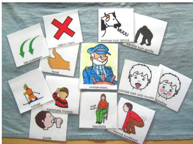
Kuva 9: Kapteeni käskee -leikin kuvia