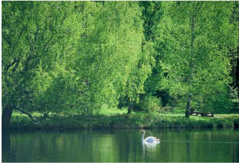
AULANGON ANKKALAMPI