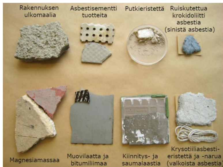
KUVA 1. Materiaaleja, joissa usein käytetty asbestia (Työterveyslaitos 2019)

Nuttusen (2014, 19) mukaan asbestia on Suomessa käytetty vuosien 1922–1993 aikana hyvin paljon rakennusmateriaaleissa. Sen suosituksen syitä olivat mm. kuumuuden kesto, lämmöneristävyys, mekaaninen kestävyys, vedeneristävyys ja sen kyky parantaa aineiden koossapysymistä. Suuren käytön syitä oli myös edullinen hinta. Nuttusen (2014, 19) työssä ilmenee myös, että korjaushank- keessa asbestia voi löytyä miltei kaikista rakenteista ja yleisimmin sitä on käytetty talotekniikan eris- tyksissä, rakennuslevyissä, lämmön- ja vedeneristeissä, maaleissa, laasteissa, sekä muovimatoissa ja niiden liimoissa (kuva 1.) Rakennusmateriaalissa ollessaan asbesti ei ole vaarallista terveydelle, mutta purettaessa näitä rakennusmateriaaleja asbestikuidut pääsevät vapautumaan hengitysilmaan ja tätä kautta keuhkoihin. Korjaushankkeessa ennen purkamista on selvítettävä, sisältävätkö raken- teet mahdollisesti asbestia, toimenpidettä kutsutaan asbestikartoitukseksi ja sen saa suorittaa siihen koulutuksen saanut henkilö. Jos kartoitusta ei suoriteta, täytyy kaikki purkutyöt suorittaa asbestipur- kuina. (Työterveyslaitos, Oksa, Korhonen, Koistinen 2019, 10, 25.)