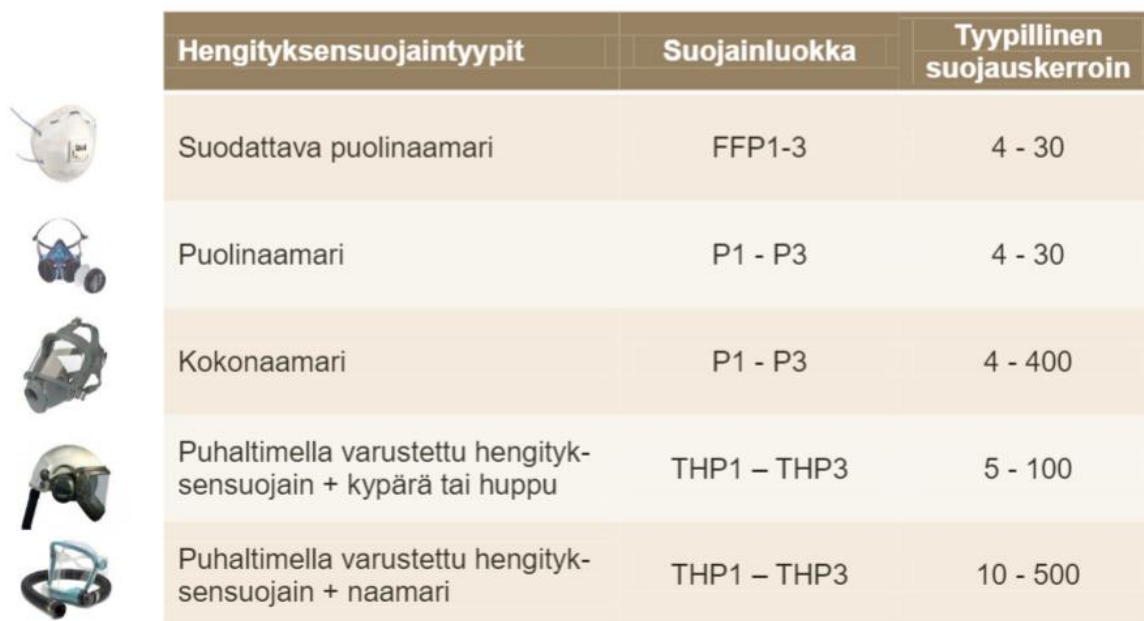
KUVA 3. Hengityssuojaintyyppi, luokka ja suojakerroin (Koski ym. 2013, 20)

Suojainta valittaessa on otettava huomioon työn laatu ja suojaimen suojauskerroin (kuva 3). Suojauskerroin ilmaisee moneenko osaan suojaimen sisällä pölypitoisuudet laskevat verrattuna ympäröivään ilmaan ja suojakertoimen täytyy nousta suhteessa työvaiheen pölyisyyteen. Mitä enemmän pölyä, sitä suurempi suojakerroin. (Koski ym. 2013, 20.)