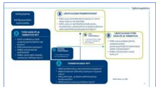
Työn kehityskarttan nelikenttä ja ulottuvuudet

Suurin osa työpajoista toteutettiin etänä. Suurimassa osassa pienryhmiä järjestettiin ensin Työn kehityskartta -työpaja, minkä jälkeen pidettiin Sytyttävä-työpaja. Työn kehityskartta -työpajassa rakennettiin yhteistä ymmärrystä asiantuntijatyön muutoksesta ja työn nykytilasta. Päätavoitteena oli määritellä yhteinen tulevaisuuden näkymä ja toimintatapa. Tässä hyödynnettiin nelikenttäanalyysia.