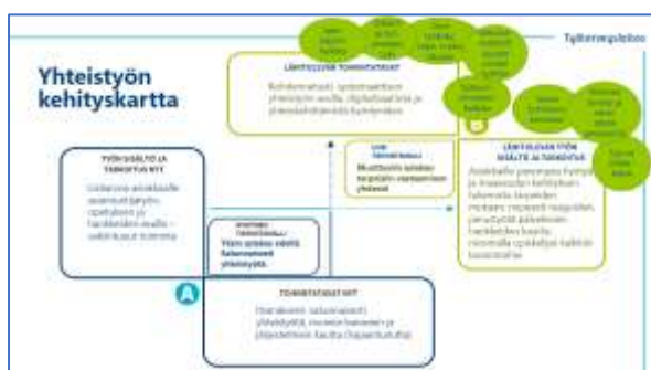
Alustava yhteenveto työpajojen tuloksista

Työterveyslaitos kokosi yhteen kahdeksan pienryhmän kahden työpajan tulokset syksyllä 2021. Kun nykyistä toimintamallia kuvaa yksin tekeminen ja yhteistyön satunnaisuus, uuteen toimintamalliin tiivistyy ajatus yhdessä tekemisestä muuttuvassa asiakasvirrassa. Nykyistä asiantuntijatyötä kuormittavat työn hajanaisuus, monikanavaisuus ja yksin tekeminen. Uudessa, lähitulevaisuuden toimintatavassa halutaan nähdä nykyistä laajempaa ja johdonmukaisempaa yhteistyötä sekä yhteiskehittämistä.