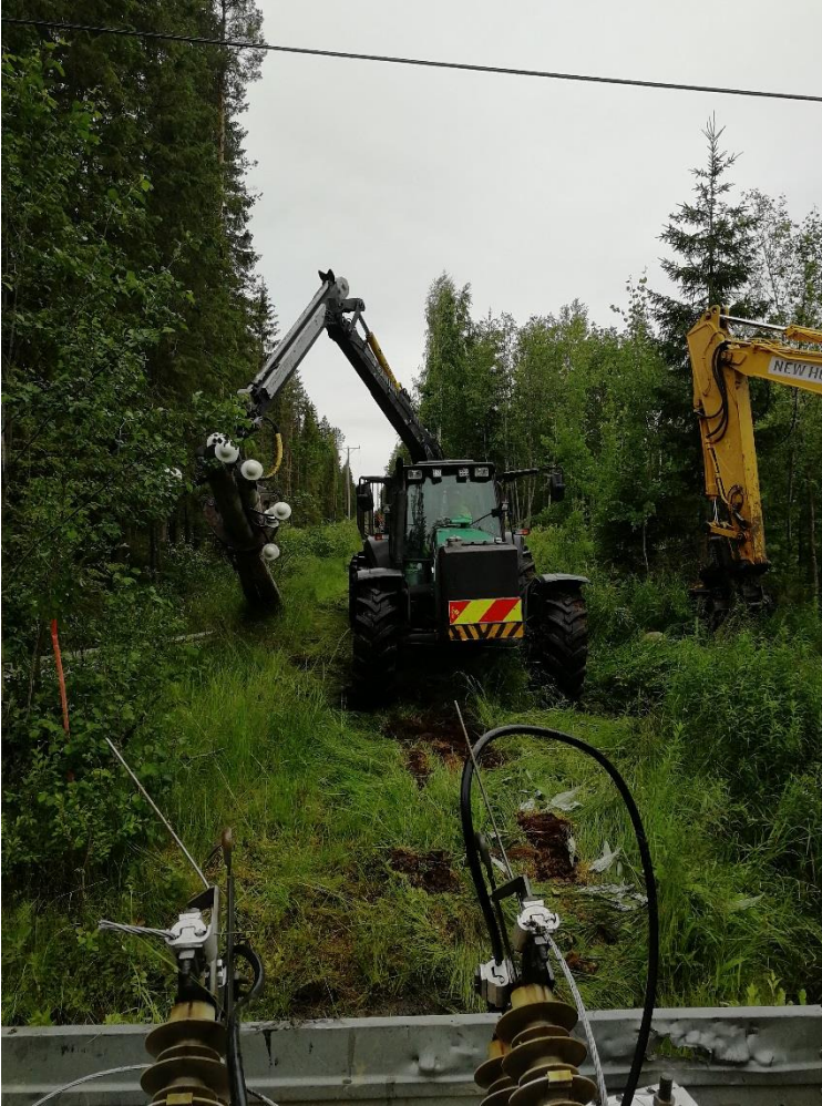
KUVA 9. Traktori nostamassa pylväitä kyytiin