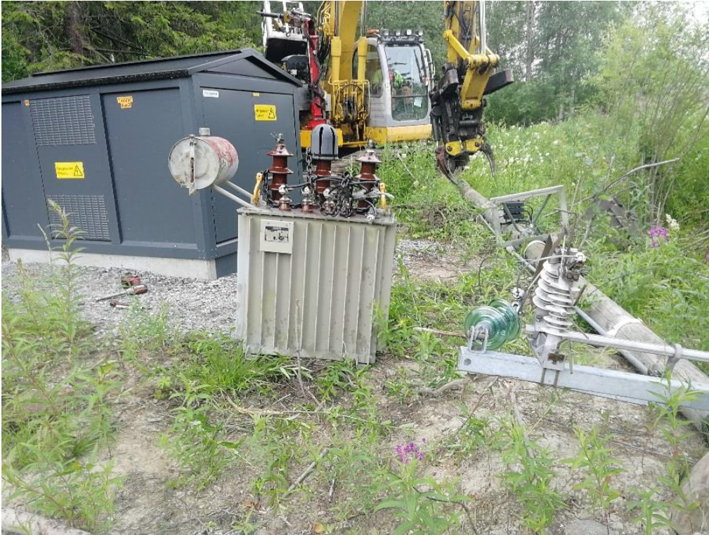
KUVA 10. Pylväsmuuntaja irrotettuna ja muuntajapylväs kaadettuna