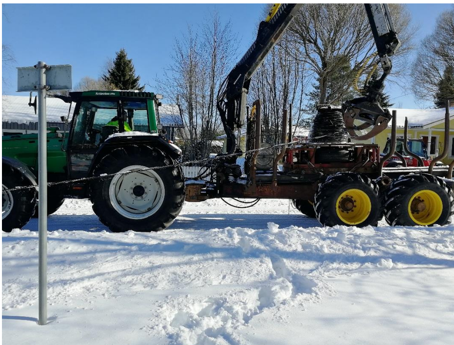
KUVA 6. Traktori, jolla kelataan johtimet ja kuljetetaan pylvää