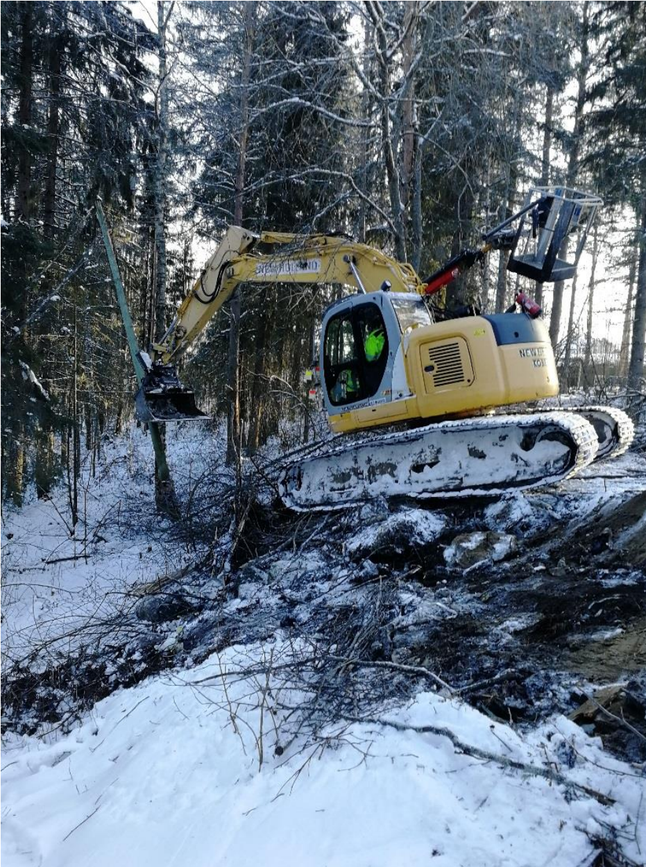
KUVA 8. Kaivinkone nostamassa pylvästä maasta