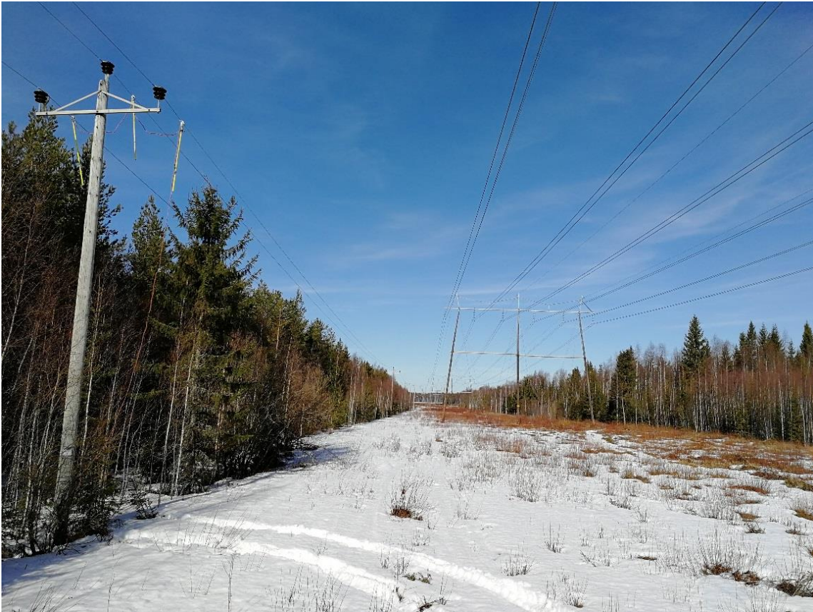
KUVA 14. Purettava linja maadoitettuna

Maadoitus suoritetaan kolmella sauvalla, jotka kiinnitetään johtimiin. Sauvat yhdistävät kaikki linjan kolme vaihetta ja sauvoista lähtevä johdin liitetään kuparitankoon, joka on asetettu maan sisään. Vaikka linja oli maadoitettu, indusoitunut sähkö oli havaittavissa pienenä kihelmöintinä koskettaessa johtimeen märillä hanskoilla.