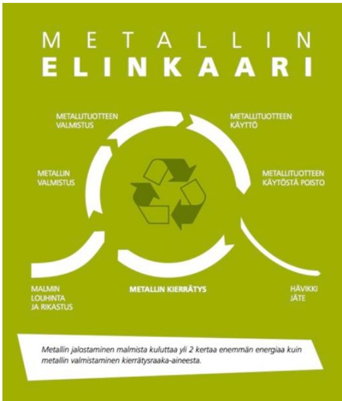
KUVIO 1. Metallin elinkaari (Ympäristöosaava 2021)