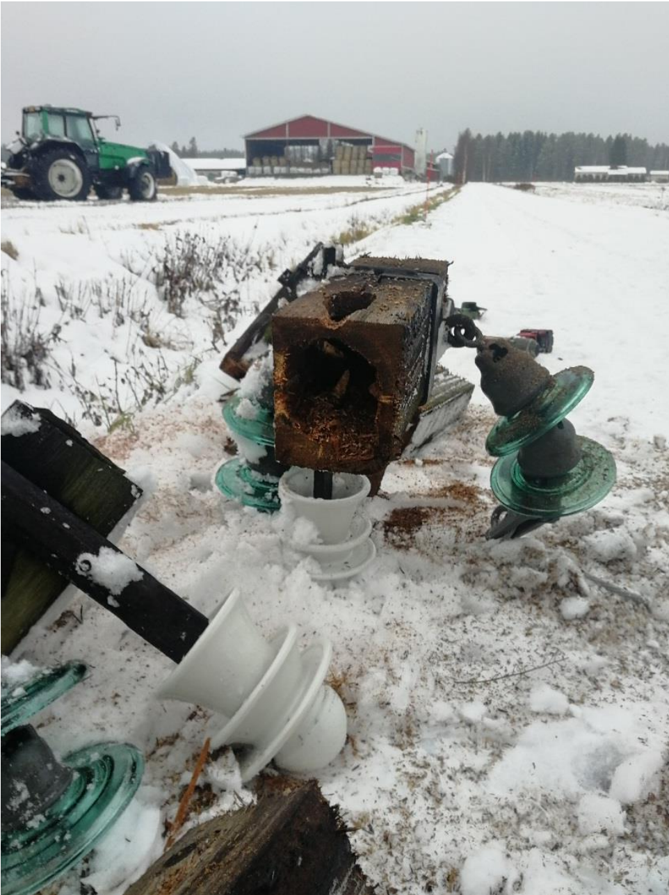
KUVA 12. Laho pylväsorsi