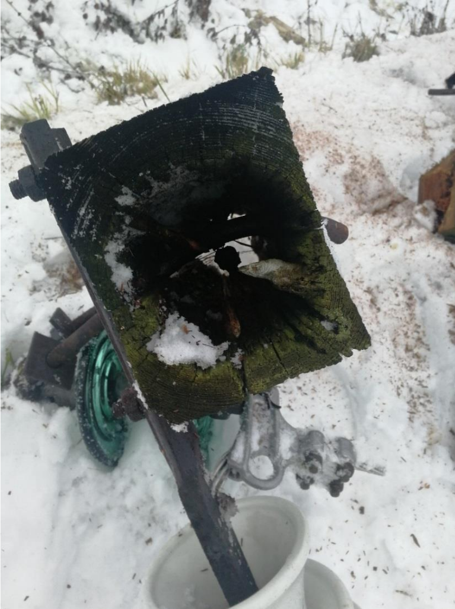
KUVA 13. Laho pylväsorsi läheltä