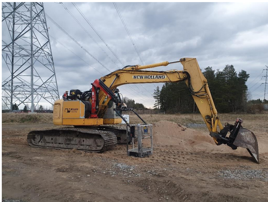
KUVA 4. Purkutöissä käytetty kaivinkone ja henkilönostin