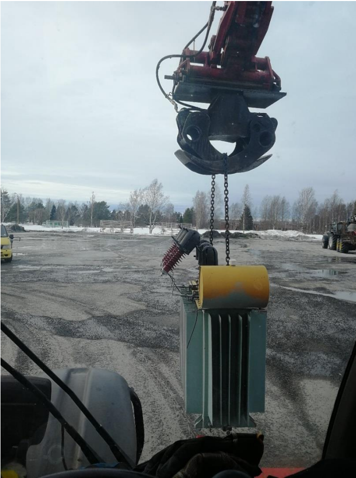
KUVA 11. Muuntajan kuljettaminen kurottajalla