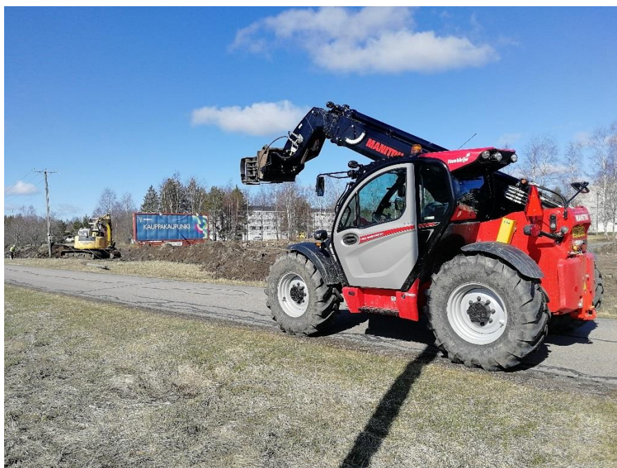
KUVA 5. Kurottaja purkukoura paikalla