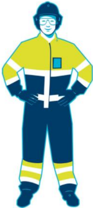
KUVA 2. Suojavarustus (Elenia 2021.)

Sähköverkkotyömailla turvallisuus näyttelee hyvin suurta roolia. Turvallisuus lähtee jo varustetasolta oikeaoppisten työvaatteiden käytöstä. Työmailla on käytettävä vähintään luokan 2 varoitusvaatetusta eli näkyvää vaatetusta. 2. luokan vaatteissa fluoresoiva pinta-ala on oltava 0.50m 2 ja heijastinpinta-ala 0.13m 2 . Suojakypärässä on oltava leukahihna. Työmailla on käytettävä turvajalkineita, joissa on nauhanastumissuoja ja varvassuoja. Silmäsuojaimet kuuluvat myös pakollisiin varusteisiin, kuten myös henkilökortti veronumerolla. Pakollisten varusteiden lisäksi eri työvaiheisiin saattaa kuulua muitakin vaadittavia suoja, esimerkiksi korilla tehtävissä henkilönostoissa on käytettävä turvavaljaita.