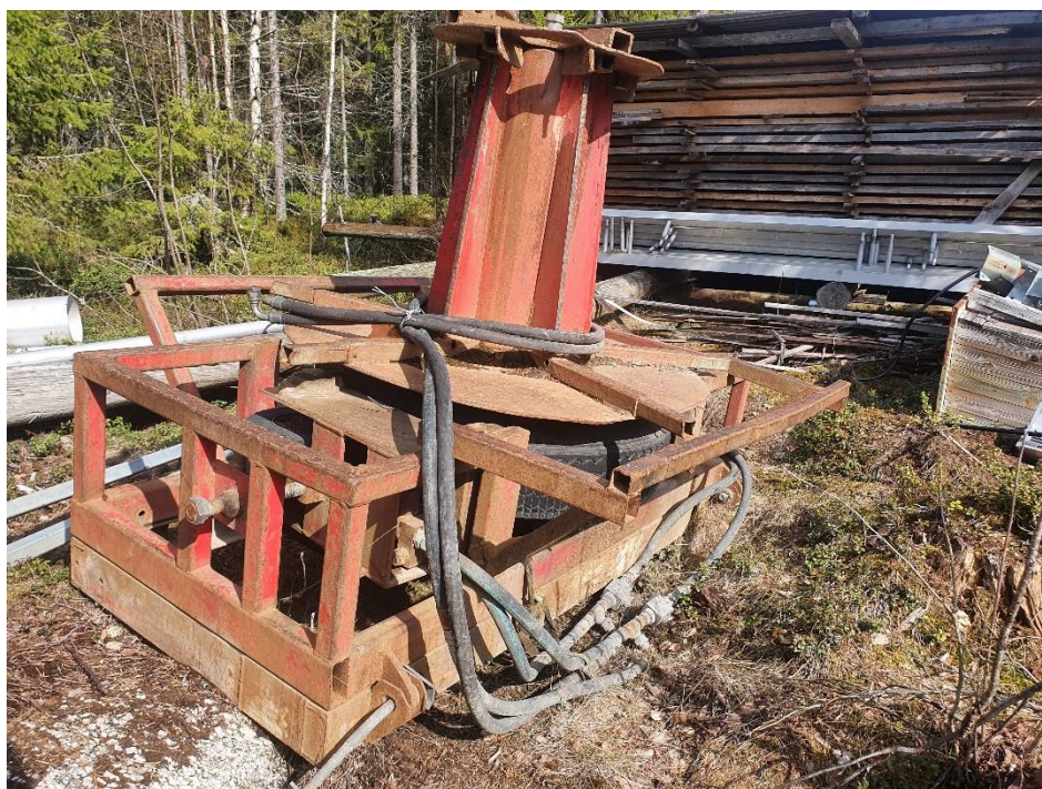
KUVA 7. Kelauslaite