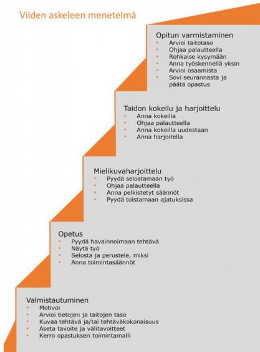
Kuva 1. Perehdyttämisen viisi askelta (Ahokas & Mäkeläinen 2013).

Neljäs askel on taidon kokeilu ja harjoittelu ja tässä vaiheessa työntekijä pääsee itse kokeilemaan työtehtäviä. Tässäkin vaiheessa häntä ohjataan palautteella ja hänen annetaan harjoitella sekä kokeilla uudestaan. Viides askel on opitun varmistaminen. Tässä vaiheessa arvioidaan työntekijän taitotasoa, annetaan ohjaavaa palautetta ja rohkaistaan esittämään kysymyksiä. Työntekijän annetaan työskennellä yksin ja hänen osaamistaan arvioidaan. Sovitaan osaamisen kehittymisen seurannasta ja päätetään opastusvaihe. (Ahokas & Mäkeläinen 2013.)