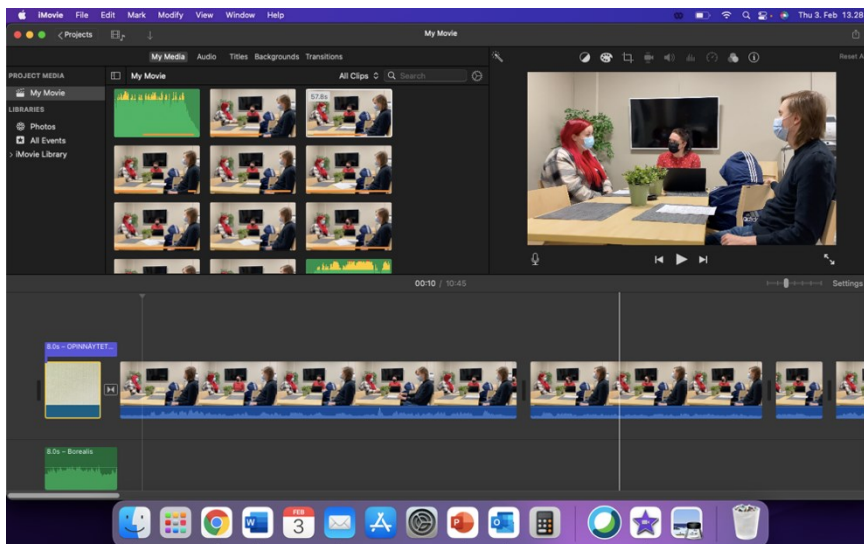
Kuva 3. Editointivaihe

Editointiohjelmasta valittiin sopiva musiikki videon alkuun ja loppuun. Alkuruudun ja lopputekstien haluttiin olevan mahdollisimman selkeät ja yksinkertaiset. Musta teksti yksinkertaisella fontilla neutraalilla taustalla tuntui sopivalta ratkaisulta asiapitoiselle videolle. Videopätkät ladattiin ohjelmaan, niitä leikattiin ja sitten yhdistettiin. Äänen-voimakkuutta piti lisätä, ja se onneksi onnistuikin ohjelman kautta. Videon pituudeksi oltiin ajateltu maksimissaan 10 minuuttia, mikä tuli pitää mielessä editoidessa. Melko lähelle sitä päästiinkin.