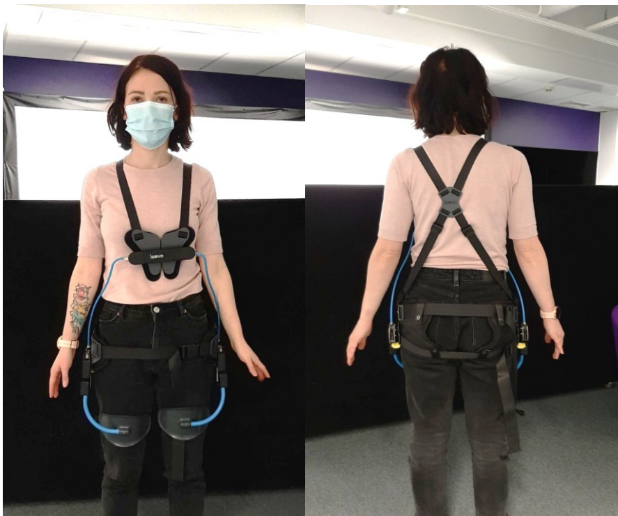
KUVA 2. Alaselkää tukeva passiivinen Laevo V2.56 -eksoskeletonon edestä ja takaa kuvattuna.