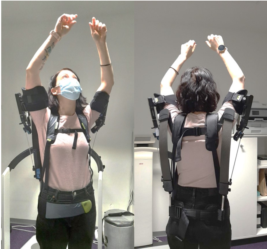
KUVA 1. Käsivarsia tukeva Skelex 360-XFR® -eksoskeletonon käyttäjän yllä.