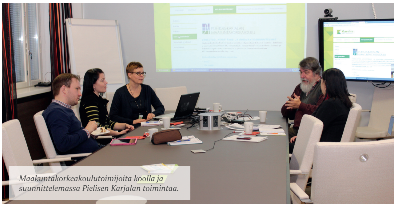
Maakuntakorkeakoulutoimijoita koolla ja suunnittelemassa Pielisen Karjalan toimintaa.

Pohjois-Karjalan maakuntakorkeakoulun toiminta perustuu yhteistyöhön ja vahvaan verkostoon. Seudulliset ohjausryhmät, paikalliset työryhmät, työvaliokunta ja maakuntakorkeakoulun ohjausryhmä ovat yhteistyön toiminnallisia foorumeja. Jokainen ryhmä kokoontui kahdesta neljään kertaa vuoden 2013 aikana. Lisätietoja ryhmien kokoonpanosta www.pohjois-karjalanmaakuntakorkeakoulu.fi