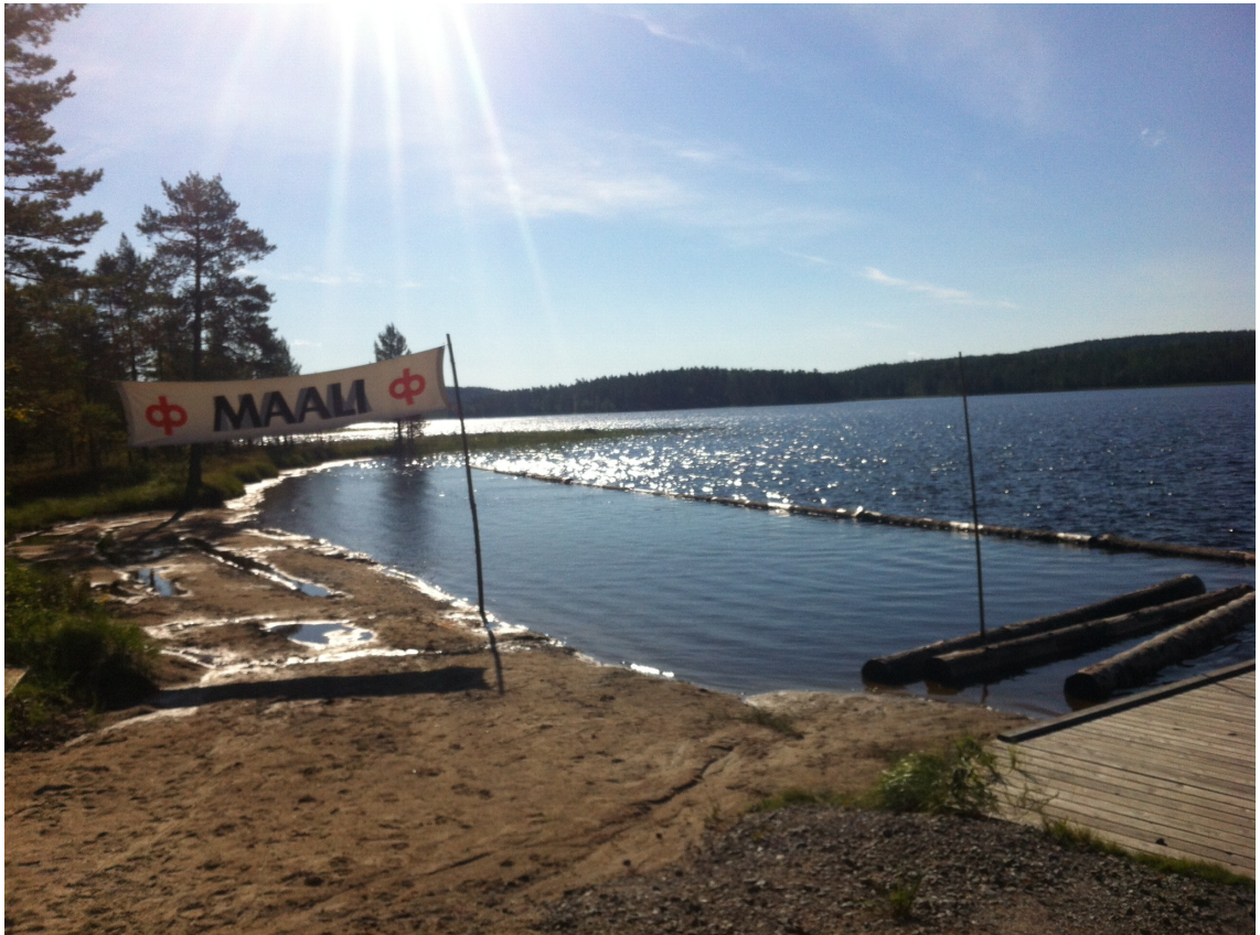
Kuva 1. Maali

Järjestelyt: Koska kyseessä oli aivan uusi tapahtuma, oli osanottajien määrää hankala arvioida. Lieksan Matkakaverit ovat alueella tunnettu yritys, voitiin olettaa, että tapahtumalle olisi paljon osanottajia. Kilpailijoiden määrä pystyttiin kartoittamaan ennakoilmoittautumisien pohjalta, mutta katsojien määrää ei voitu luotettavasti arvioida lainkaan. Koska tapahtuma ajoittui koulujen alkamisviikolle, arvioitiin yleisön koostuvan suurimmaksi osaksi paikallisista.