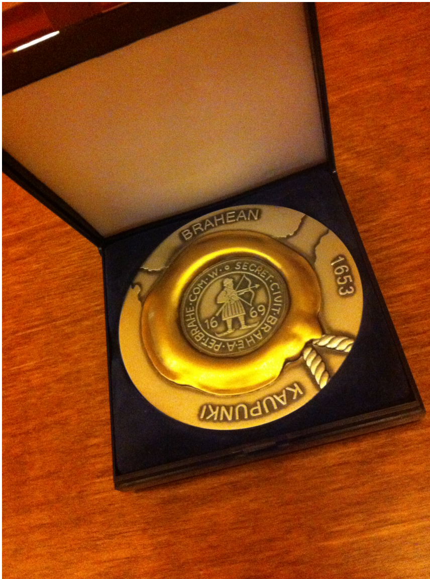
Kuva 4. Palkinto

Palkinnot: Kaislikkohiihdoissa molempien naistensarjan voittajille ja toiseksi sijoittuneille jaettiin palkinnoksi Brahean vaakunaa kantanut Sinettimatriisimitali. Sinettimatriisit saatiin lahjoituksena Suomen Ikime Oy:n heraldikolta (vaakunataiteilija) Rauno Lepiköltä.