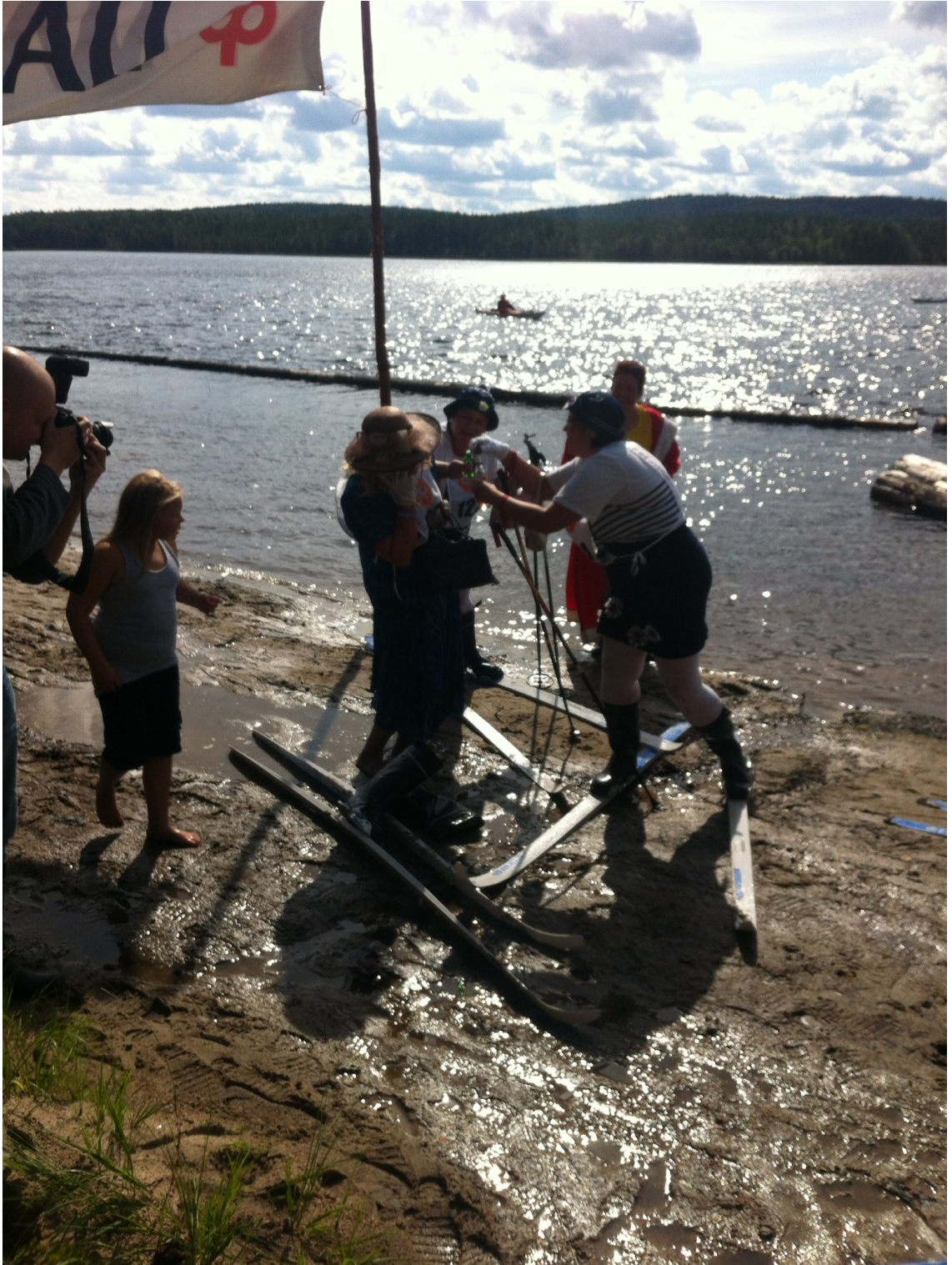
Kuva 2. Saapuminen maaliin