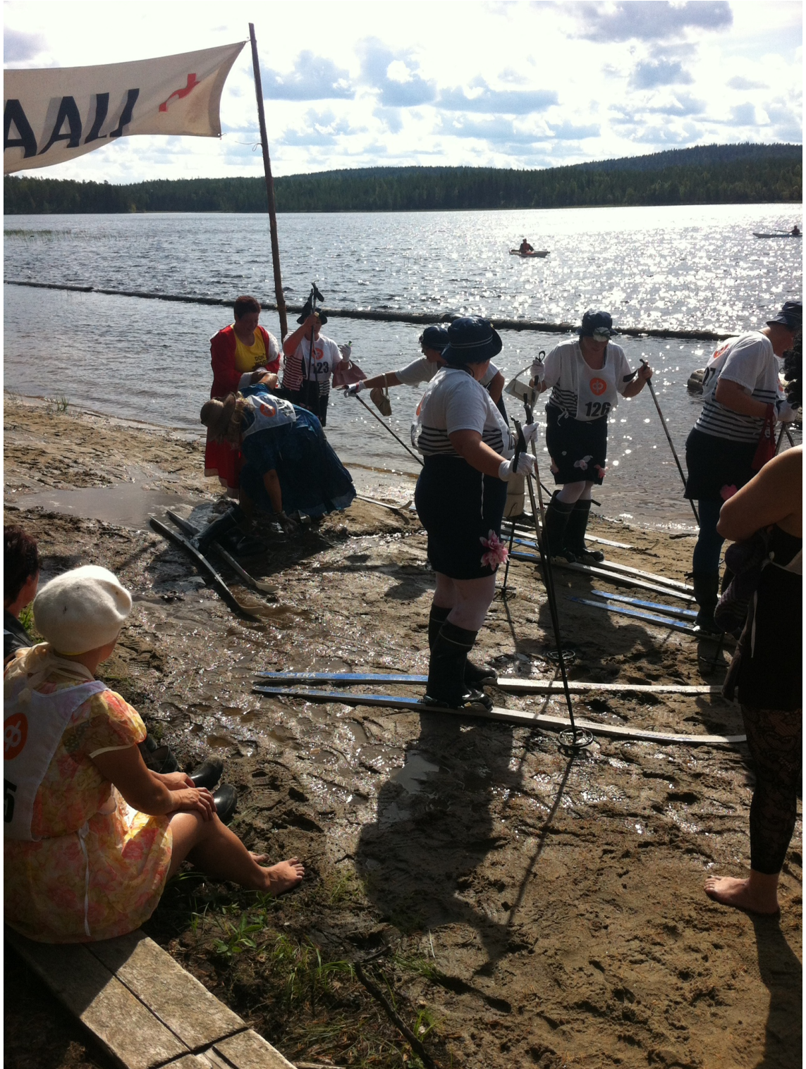
Kuva 3. Kilpailijoita