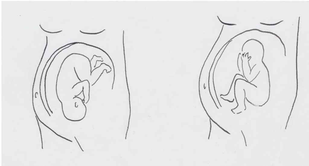
Kuvio 1. Sikiön päätarjonta ja perätarjonta (alkup. kuvio ks. Eskola & Hytönen 2002, 136.)

äidin uupuminen. (Rouhe ym. 2013, 83; Rouhe ym. 2007; Rahkala, Hautaniemi & Ilola 2013; Eskola & Hytönen 2008, 236.) Tarjonta tarkoittaa sikiön asentoa suhteessa synnytyskanavaan (Rahkala, Hautaniemi & Ilola 2013). Perätila on sikiön virhetarjonta, jossa sikiön perä on tarjoutuvana osana (ks. kuvio 1) (Eskola & Hytönen 2008, 201). Perätarjontaisen sikiön synnytystapa on usein suunniteltu sektio, mutta alatiesynnytys on mahdollinen. Synnytyksen suunnittelussa otetaan tällöin huomioon synnytysopilliset tekijät ja vanhempien toiveet. (Eskola & Hytönen 2008, 202; Kuismanen, Uotila & Kirkinen 2004.)