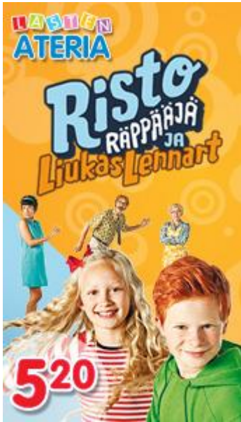
Kuva 1. Mainos Hesburger