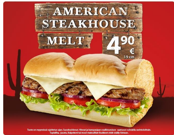
Kuva 2. Mainos Subway