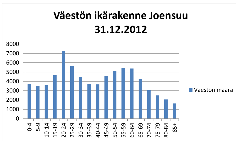
Kuvio 3. Väestön ikärakenne Joensuussa (Pohjois-Karjalan maakuntaliitto 2013)

Pohjois-Karjalan väestöluku 12/2012 tilaston mukaan oli 165 754, josta Joensuussa asuvia oli 74 168. Viiden vuoden tarkkuudella katsottuna 20–24-vuotiaita oli Joensuun seudulla 7252 ja se oli selvästi suurin ikäryhmä. Seuraavaksi suurin oli 25–29-vuotiaat, joita oli 5630. (P-K:n maakuntaliitto 2013.) Kun taas katsotaan laajemmalla ikäryhmällä, 35–54-vuotiaita oli Joensuussa n. 23 %, 25–35-vuotiaita n. 14 % ja 15–24-vuotiaita n. 16 %. (Tilastokeskus/ Josek 2013.)