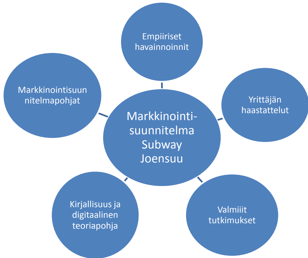
Kuvio 1. Opinnäytetyön teoreettinen viitekehys

tekemisen sanallistamista ja samalla ammatillisen viestintätaidon näyte. (Vilka 2010.)