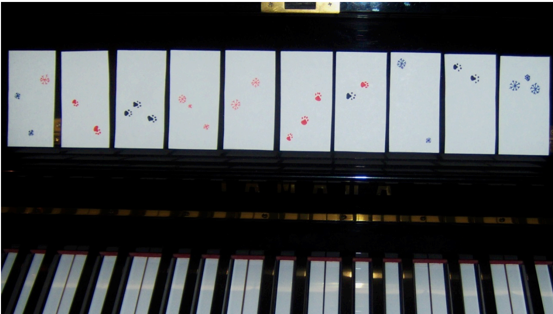
KUVA 2. Musiikkipelikortit, joissa on lumihutaleiden ja tassunjälkien kuvia.

Helputettu versio nuottipelistä vasta-alkajalle on pelikortit, joissa on kuvia eri korkeuksilla ja oppilas soittaa joko klustereita tai yksittäisiä ääniä siten, että kuvassa ylempänä olevat kuvat ovat korkeampia ääniä ja alempana olevat kuvat matalampia. Pelin avulla oppilaalle on helppo nuottikuvaan siirryttäessä selittää, että myös nuotit sijaitsevat eri korkeuksilla ihan samalla tavalla kuin tuossa pelissä. Tähän peliin voi liittää myös dynamiikan opetteluun eli oppilaan kanssa päätetään, mitkä kuvat soitetaan hiljaa ja mitkä voimakkaasti. Tai varioiden siten, että kuvissa ylöspäin mennessä soitetaan voimakkaammin tai hiljemmin. Myös eri kuviot ja värit voidaan soittaa erilailla, esim. jotkut kuvat mustilla, toiset valkoisilla koskettimilla tai joihinkin klusteri, toisiin yksittäinen ääni. Mahdollisuuksia on niin monta kuin opettajan ja oppilaan mielikuvitus vain keksii. Tätä peliä voisi käyttää myös improvisoinnin opettamiseen. Molemmat pelit ovat saaneet oppilailta innostuneen vastaanoton, ovatpa soittotunnit joskus venähtäneet yliajallekin, kun oppilas on halunnut vielä kokeilla yhtä erilaista versiota.