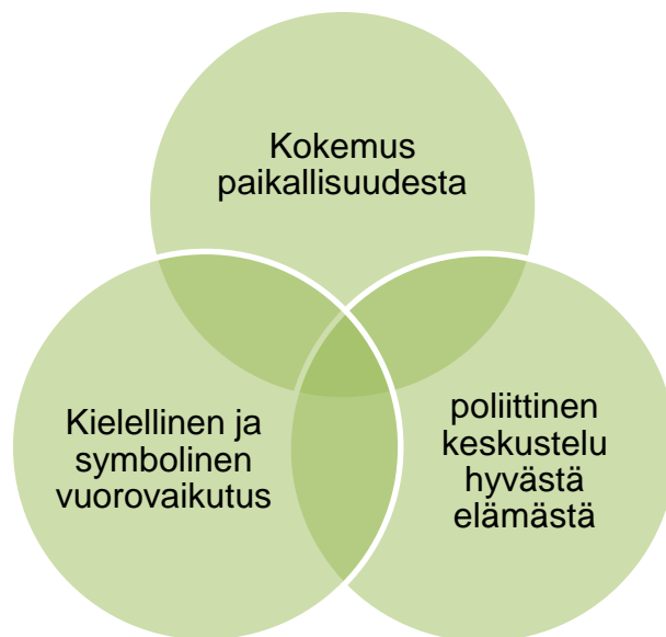
Kuvio 2. Yhteisötutkimuksen kolmijako

Yhteisötutkimuksen kolmijako voidaan tiivistää seuraavanlaiseen kuvioon: