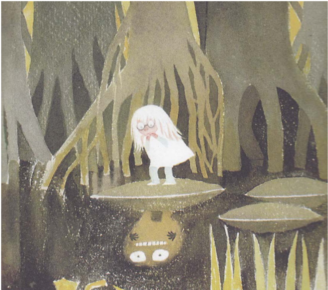
Kuva 3. Tove Janssonin "Vaarallisen matkan" kuvitus voi olla pienimmille pelottavaa.

Kirjan kestävän kehityksen kannalta huomattavin anti on luonnon ja sen muutosten kuvauksessa. Todellisen maailman muuttuessa esimerkiksi ilmastonmuutoksen seurauksena lapselle voi antaa keinoja ymmärtää muutosta elämyksellisen kirjan kautta. Kirjan henkilöiden selviytyminen vaaroista voi antaa turvallisuuden tunnetta lapselle.