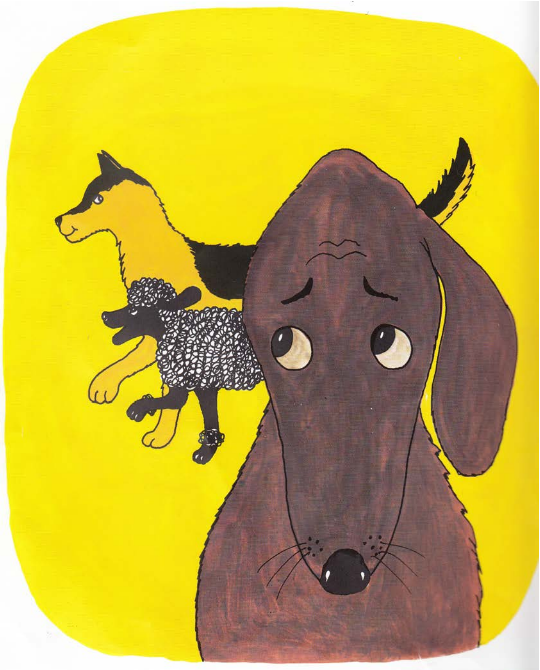
Kuva 2. Pekka Töpöhännän kuvitus vahvistaa tekstin herättämää myötätuntoa hahmoja kohtaan. (Gösta Knutsson: Pekka Töpöhännän ystävä)