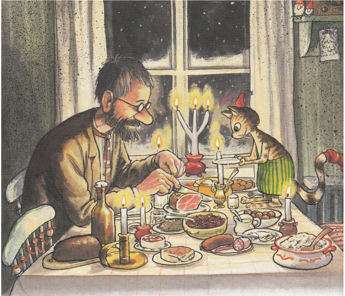
Kuva 4. Viiru ja Pesonen -kirjan kuvituksessa on lämminhenkinen tunnelma. (Sven Nordqvist: Viiru ja Pesonen saavat jouluvieraita)

useammankin katselukerran. Tapahtumien kuvaus kuvineen on värikästä ja elävää (Kuva 4). Tarina on lämminhenkinen ja korostaa naapureiden ja ystävien avunannon tärkeyttä. Viiru ja Pesonen osoittavat kiperässä tilanteessa myös neuvokkuutta ja kekseliäisyyttä, joka on inspiroivaa.