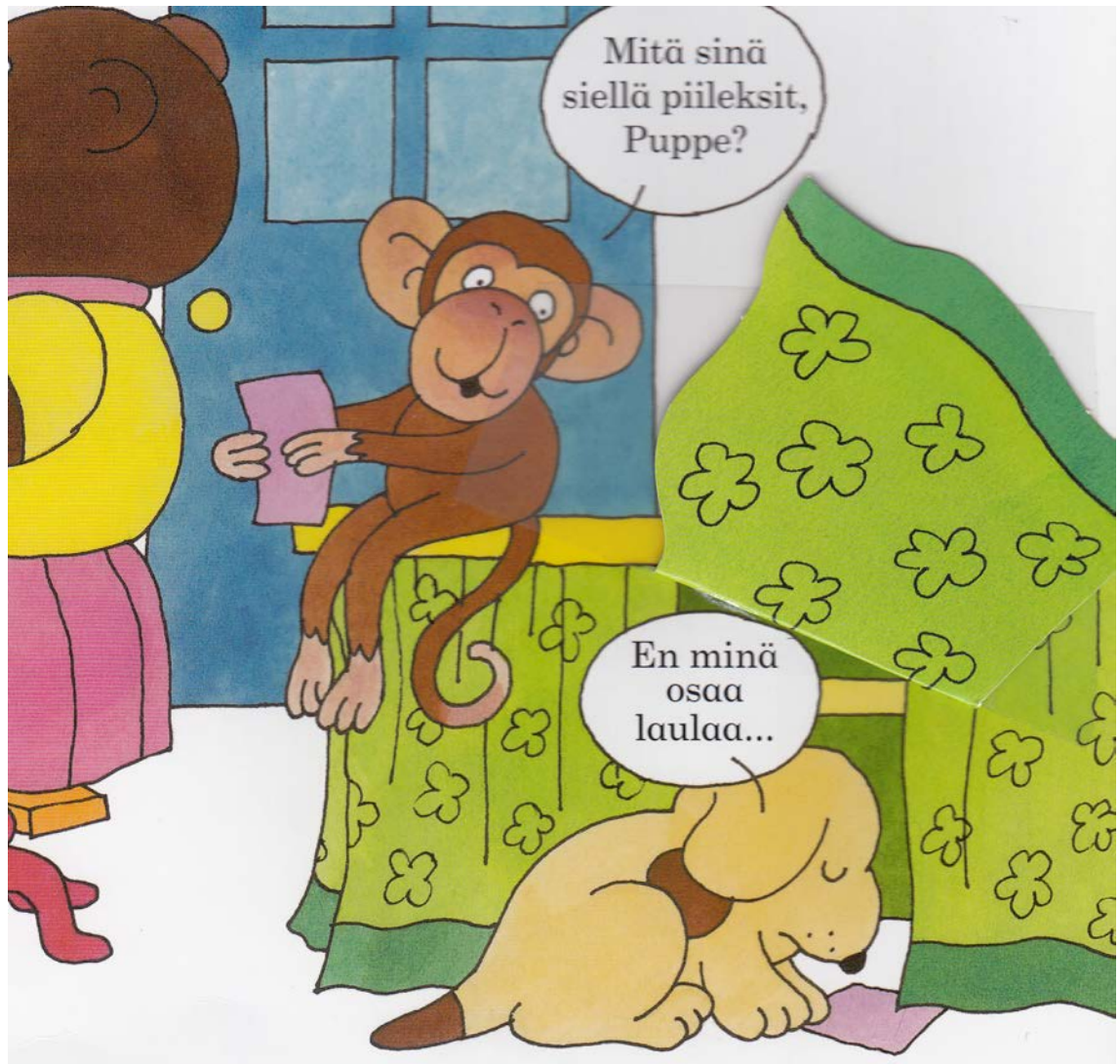
Kuva 5. Puppe-kirjassa on paljon toiminnallisuuteen kannustavia kurkistuskuvia. (Eric Hill: Puppe menee kouluun)