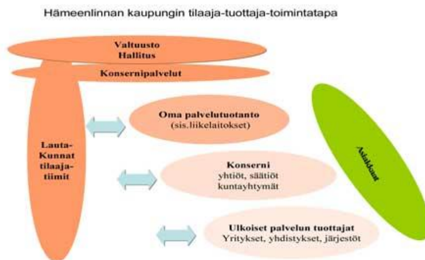
Kuvio 1. Hämeenlinnan organisaatiokaavio ( www.hameenlinna.fi/organisaatiokaavio )

Palveluntuotannosta vastaa kaupungin oman organisaation tuottamista palveluista budjetin ja palvelusopimuksen mukaisesti.