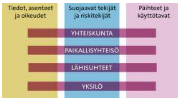
KUVA 1 vaikuttamiskohteet pylväinä ja toteutustasot palkkeina

Alla oleva kuva antaa kuvan ehkäisevän päihdetyön avarasta tilasta. Jokaisella työllä tulisi olla määriteltynä toiminnan taso ja vaikuttamiskohteet, kuitenkin huomioiden, että kaikki vaikuttavat osaltaan kaikkeen.