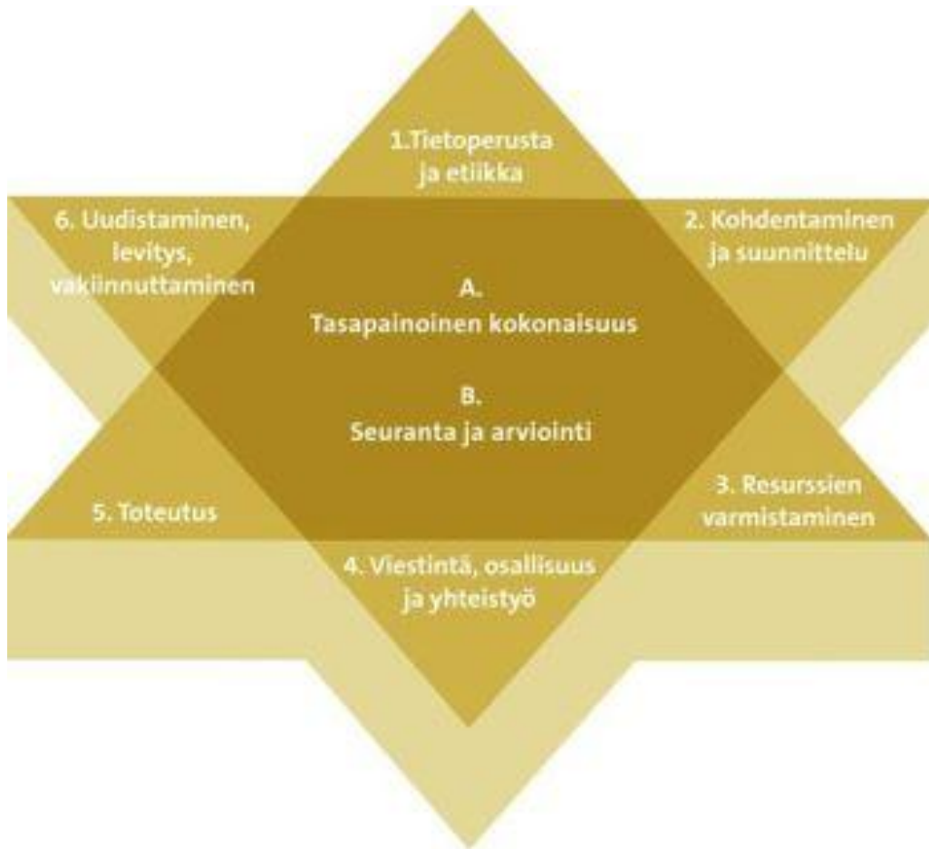
Kuva 2: Laatutähti ja sen tehtävät havainnoivassa muodossa

Laatutähti koostuu kahdeksasta tehtävästä ja niiden suhteesta toisiinsa, jotka on kuvattu yllä. Ytimessä olevia tehtäviä on pidettävä silmällä kokoaikaisesti suunnittelu- vaiheen akutekijöistä lähtien. Sakaroissa eteneminen myötöpäiväisesti helpottaa johdonmukaista etenemistä, mutta tärkeintä kuitenkin on tarkastella jokaista tehtävää suhteessa jokaiseen muuhun, koska kaikkiin tähden asioihin ei voi aina itse vaikuttaa.