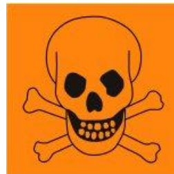
Erittäin myrkyllinen T+