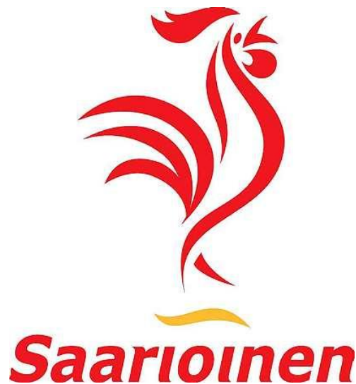
KUVA 1 Saarioisen tunnuksena oleva kukko esiintyi ensimmäisen kerran julkisuudessa jo vuonna 1954 kanalan hinnastossa. (Saarioinen 2009)

Sahalahdella sijaitseva Saarioisen kartano on ollut olemassa jo kauan ennen Saarioinen Oy:tä. Kartano mainitaan kirjallisissa lähteissä jo vuonna 1469 ja sillä on ollut parikymmentä eri omistajaa vuosien varrella. Vuodesta 1941 kartano on ollut kuitenkin saman suvun omistuksessa. Kartanon mailla yritystoiminta alkoi 1940-luvulla kanalan muodossa ja kanalan hinnastossa esiintyikin ensimmäisen kerran Saarioisen tunnuksena vielä tänä päivänäkin oleva kukko. Kuvassa 1 on tällä hetkellä Saarioisen logossa oleva kukko. (Saarioinen 2009.)