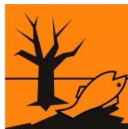
Ympäristölle vaarallinen N