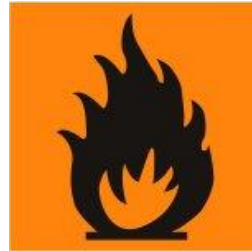
Erittäin helposti syttyvä F+