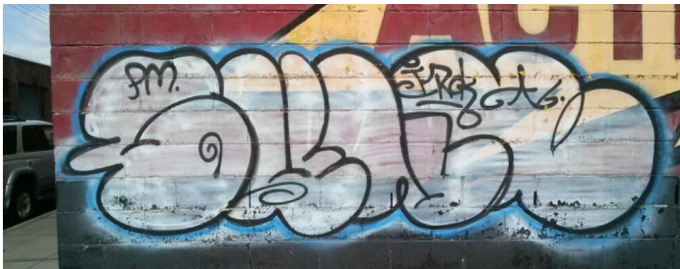
Kuva 2. Throw up, Hakupäivä 1.3.2014.

< http://stickurz.com/city-skyline/380-philadelphia.html >