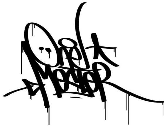
Kuva 1. Tagi, Hakupäivä 1.3.2014.

< http://stickurz.com/city-skyline/380-philadelphia.html >