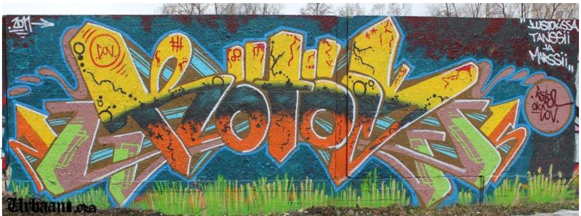
Kuva 3. Piissi, Hakupäivä 1.3.2014.

< http://stephenesherman.com/hunts-point-graffiti/ >