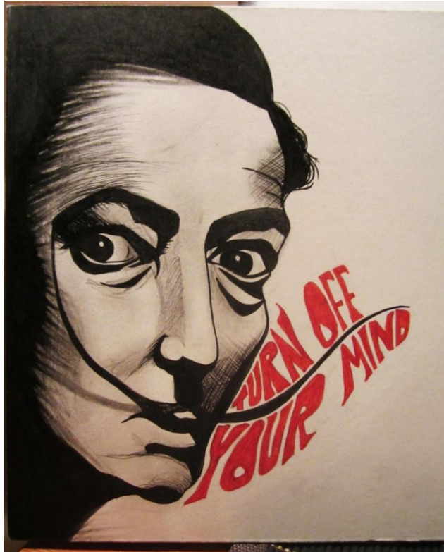
Kuva 1. Ensimmäinen kuvasuunnitelma

joka tunnistaa hahmon Daliksi ja tekstin Electric Wizardin kappaleeksi, osaa yhdistää objektit laajempaan kokonaisuuteen ja saa työstä enemmän irti.