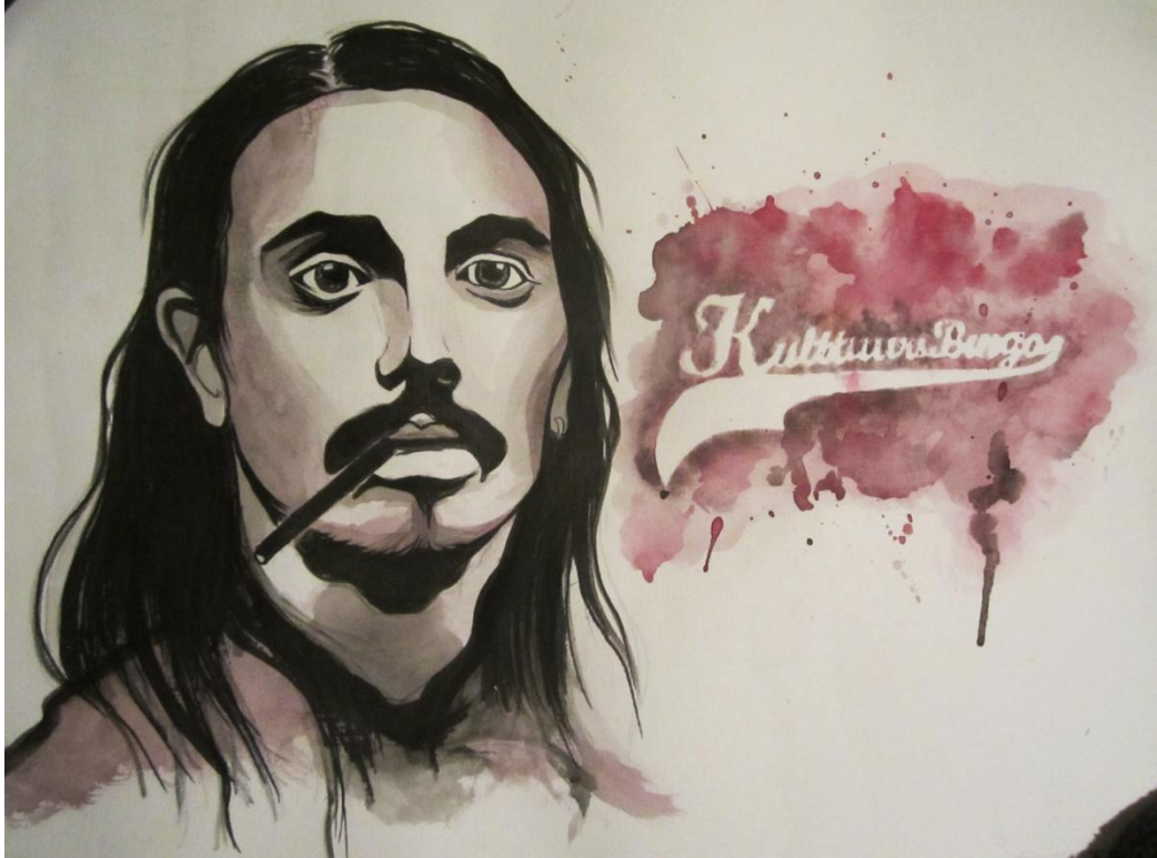
Kuva 3. Lopullinen kuvasuunnitelma