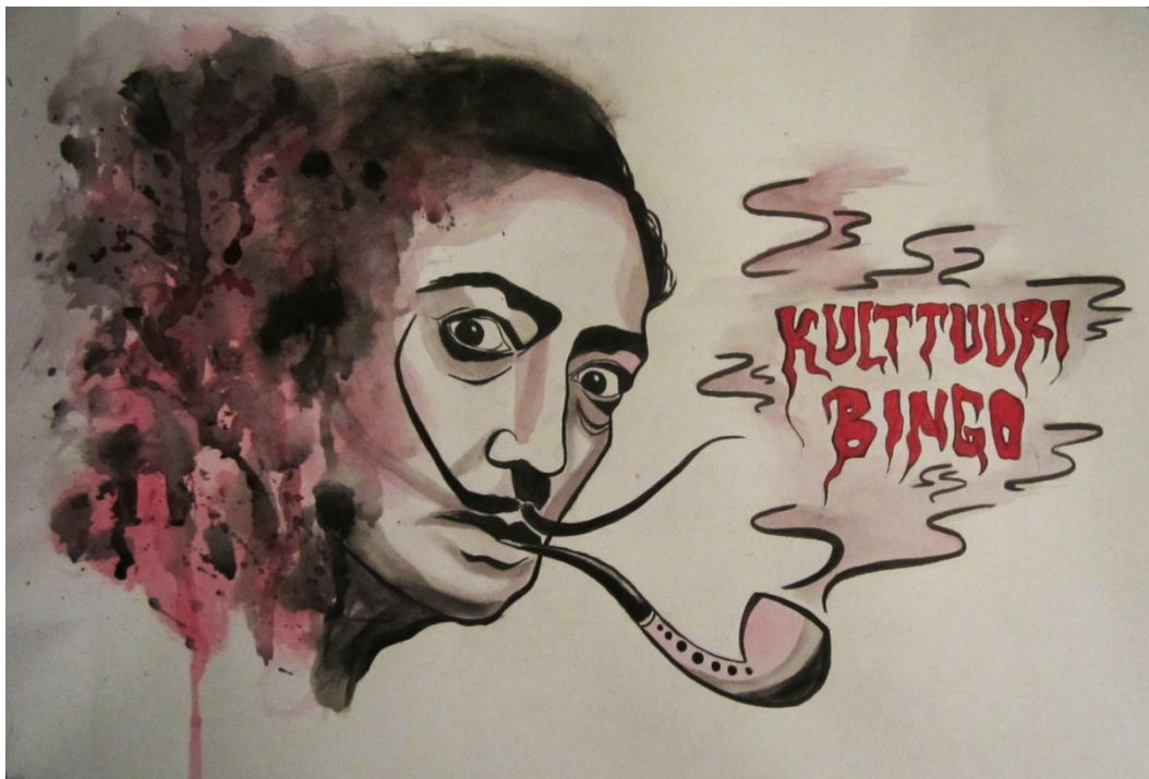
Kuva 2. Toinen kuvasuunnitelma

Mielessä kävi aluksi graffitityyppinen ratkaisu, mutta aika pian tulin siihen lopputulokseen, että tyyllisesti se ei ehkä sopisi tämän tyyppiseen teokseen. Toinen ongelma joka sai minut hylkäämään graffitin käytön, oli se että koin taitojeni olevan liian vähäiset tekemään tarpeeksi uskottavaa graffitia itse sitä harrastamattomana. Lopulta suunnitelin kirjainten nousevan ylös piipusta savun seasta, mutta asiakas halusi käytettävän heidän valmista fonttiaan (Liite 10) ikään kuin logomaisesti, jotta työ varmasti erottuisi omaksi kokonaisuudekseen ja irrottautuisi näyttelytilasta. Paikan ensisijainen tarkoitus on toimia näyttelytilana, joten muunkin ympäristön on tuettava näyttelytilan tarpeita.