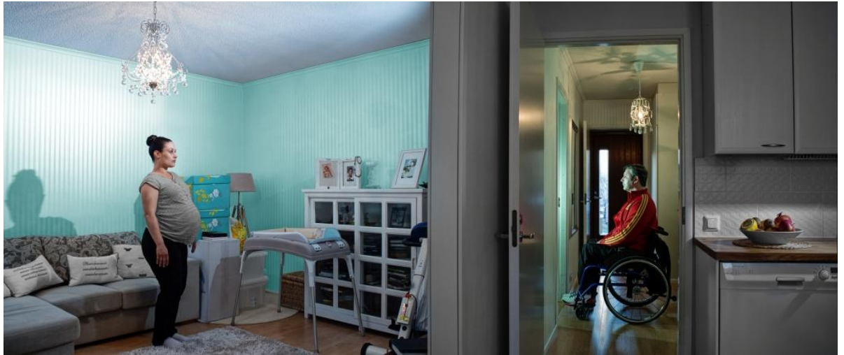
Kuva 7: Juhana Lappalainen, Vain sinun, vain minun, Ihmisen tarina 2013

Esimerkiksi hallitseva väri, joka puskee itsensä ikään kuin merkityksentuojaxi kuvaan, tuli vasta kuvaustilanteen jälkeen. Kyseisen kuvan kohdalla lamppu konkreettisesti syytyi useasti. Sain uppoutua ideaan, joka minulle aikaisemmin oli tullut. Nämä ovat sellaisia ihannetilanteita, mutta niitä tulee harvoin. Minulle nämä kaksi romanitaustaista ihmistä edustavat tietynlaista syrjintää. Ideassani minulle tuli monia kysymyksiä jotka haluan katsojalle välittää. Voiko invalidi saada lasta? Onko romaneilla oikeus onneen? Pohdin ennakkoluuloja, sekä opittuja tapoja.