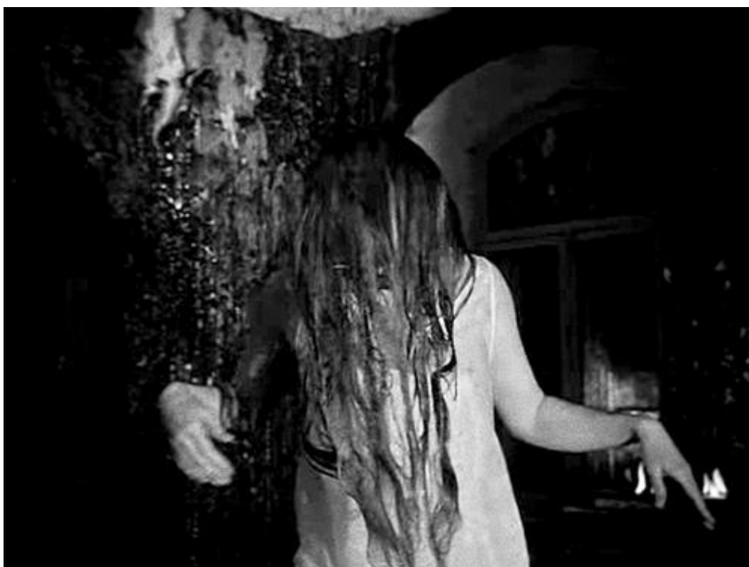
Kuva 6: Andrei Tarkovski: still kuva elokuvasta Peili 1975.

Kokemukseni jälkeen olen kuitenkin ollut erittäin onnellinen. Olen huomannut poikkeavuuksien voiman. Ihmismieli toimii selittämättömällä tavalla eikä siinä aina ole kromologiaa. Joskus on viisaampaa jättää katsojalle varaa pohtia elämäänsä ja totuuksiaan. Liika selittäminen on taiteessa mielestäni luopumista. Luopumista omasta konkretias- taan.