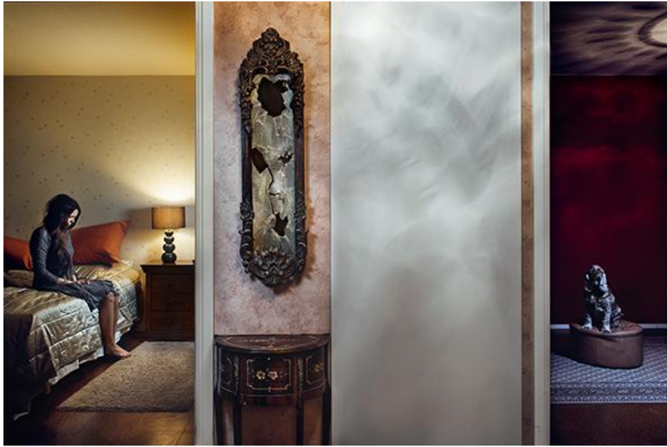
Kuva 1. Juhana Lappalainen, Omnipotens, sarjasta Ihmisen tarina 2013.