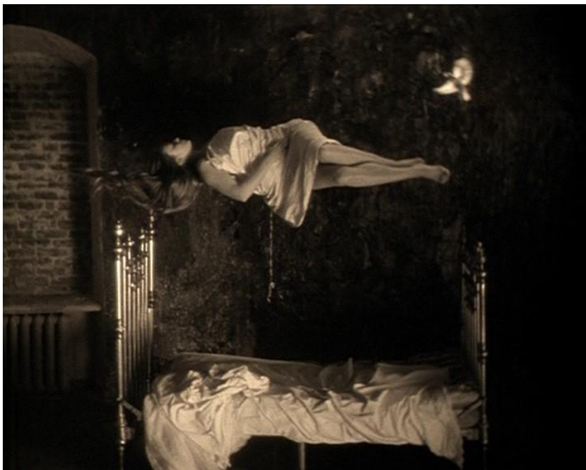
Kuva 5. Andrei Tarkovski: still kuva elokuvasta Peili 1975.

Koin suurta onnentunnetta itsessäni samaistuessani Tarkovskin kommenttiin. Minua on aina kiehtonut syvästi hänen elokuvansa, juuri tämän konstailemattoman selittämättömyyden takia.