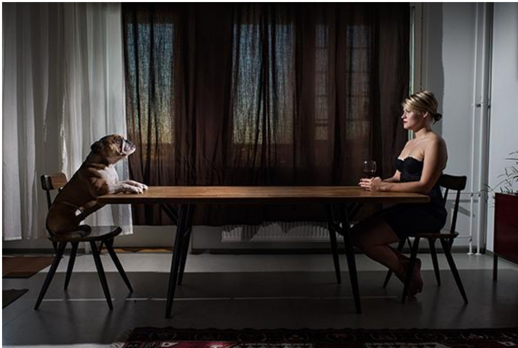
Kuva 3. Juhana Lappalainen, Damnum, Ihmisen tarina 2013.

Saavuttuani kuvauspaikalle sain idean. Idea syntyi kuin tyhjästä. Henkilöhahmot löysivät paikkansa ja pöytä vastasi mielikuviani. Idean syntymisen myötä minun oli helppo jatkaa kuvaustilanteessa syntynyttä prosessia. Tarina syntyi prosessin aikana tarkastellessani kuvattavia. Mieleeni nousi ajatus, osaisiko koira istua tuolilla kuvauksen ajan? Kuva syntyi nopeassa intuition prosessissa. Pöydän toisessa päässä istuu koira hyvin ihmismäisesti. Sillä on katse tiukasti suunnattuna nuoreen vaaleaan naiseen, joka istuu pöydän toisessa päässä. Valo on synkkä ja riitelevä, ehkä joka painostava. Esineitä ei ole. On vain kontakti ja etäisyys näiden kahden välillä. Verhot ovat suljetut. Vallitsee täydellinen pysähtyminen. Ei ole vihjeitä. On vain katse. Katse joka sanelee tarinan, fragmentin ja totuuden. Yksinäisyyden keskellä on toivoa. Vai onko?