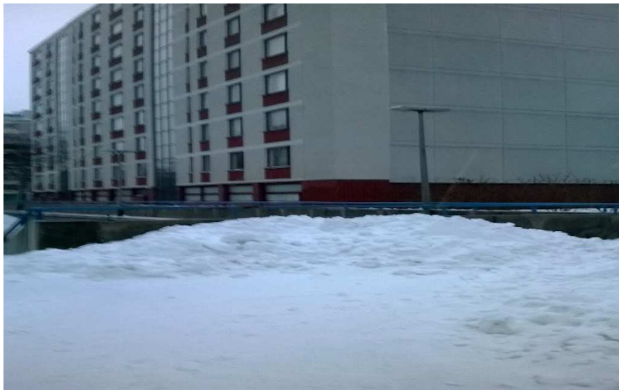
KUVA 3. Lumikasa Itä-Pasilassa sijaitsevan sillan kupeessa. Kuva otettu 2014.

Edellä mainituista käy hyvin ilmi, että asukkaat ovat kokeneet demokratiahankkeen tarjonnan heille jonkinlaista osallistumisen mahdollisuutta ja kokemusta. Toiselle kokemus on ollut sitä, että on voinut saada tietoa erilaisista mahdollisuuksista osallistua, kun taas toiselle on ollut tärkeää miettiä miten demokratiahankkeen synnyttämiä mahdollisuuksia voitaisiin jatkaa alueen kehittämistyössä tulevaisuudessakin. Alla olevassa kuva on yksi esimerkki siitä, miksi asukkaiden kuuleminen ja mukaan ottaminen päätöksien teossa on tärkeää tehtäessä alueellista kehittämistyötä.