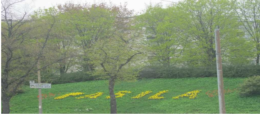
KUVA 2. Kukkasipuli teksti Mäkelänkadun rinteessä keväällä 2012

Junailijankujan asumispalveluyksikkö sekä Hoitokoti Päiväkumpu. Tärkeitä konkreettisia toimia olivat myös kukkasipuleiden suunnittelu- ja istuttamistapaamiset. Kukkasipulit ovat tärkeässä roolissa Itä-Pasilassa. Niiden kautta tai avulla on luotu hyvä yhteistyösuhde kaupungin rakennusvirastoon. Alla olevassa kuvassa näkyy keltaisilla narsisseilla istutetut kirjaimet.