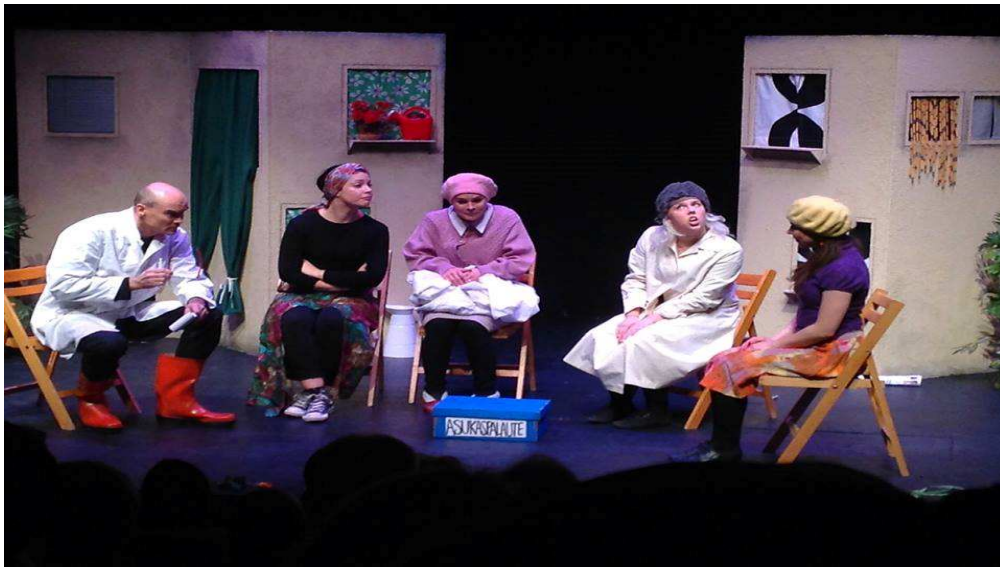
KUVA 1. Bölen kylä -näytelmän ensi-ilta Studio Pasilassa marraskuussa 2013.

Yksi hyvin tärkeä osallisuutta lisäävä toiminto oli Helsingin kaupunginteatterin toteuttama ”Pääroolissa Itä-Pasila” -hanke, joka tavoitti omalla tiedottamisellaan ja toiminnallaan laajasti alueen asukkaat. Hankkeessa haluttiin tuoda näkyviin Itä-Pasilan asukkaiden kokemuksia ja ajatuksia omasta yhteisöstään, samalla haluttiin tehdä esittävä taide näkyväksi Itä-Pasilan katukuvaan. Myös Itä-Pasilassa sijaitsevan Studio Pasilan ovet haluttiin avata asukkaille ja tätä kautta kutsua asukkaita kokemaan teatterin tarjoamat mahdollisuudet yhteistoiminnalle. (Itä-Pasilan demokratiapilotti 2013.) Alla olevassa kuvassa Studio Pasilassa ensi-iltansa saanut Bölen kylä -näytelmä, jonka toteuttivat Itä-Pasilan asukkaat yhdessä teatteritaiteenilmaisun ohjaajien sekä muutaman vapaaehtoisen näyttelijän kanssa.