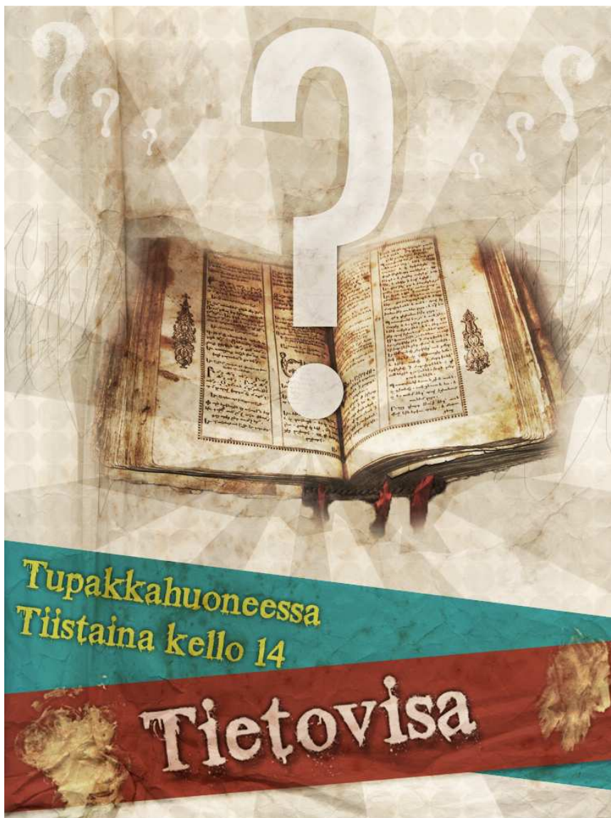
KUVA 1. Tietovisan mainos

Kuvassa 1 on esimerkki eräästä ryhmätoiminnan mainoksesta. Jokaista ryhmätoimintaa markkinoitiin ja mainoksissa oli suunnittelemassa tai toteutuksessa mukana olleiden asukkaiden nimet heidän sitä halutessaan. Mainostuksessa pyrittiin informaation tiiviiseen esittämiseen, yksinkertaisuuteen ja samalla huomion herättämiseen. Mainokset oli sijoitettu näkyville paikoille, joista asukkaat usein kulkevat ohi esimerkiksi hissien läheisyyteen. Mainokset sijoitettiin aina samoille paikoille, jotta asukkaat tietäisivät mistä niitä etsiä. Mainokset poistettiin ryhmätoiminnan jälkeen. Toimintatapa perustui Feantsa & Grundtvig Participation toolkit -oppaaseen (Feantsa & Grundtvig 2013, 29).