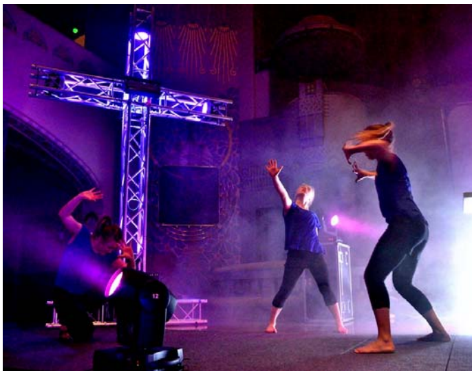
KUVA 6. Kuvassa GuiDance -tanssiryhmä Liedosta.