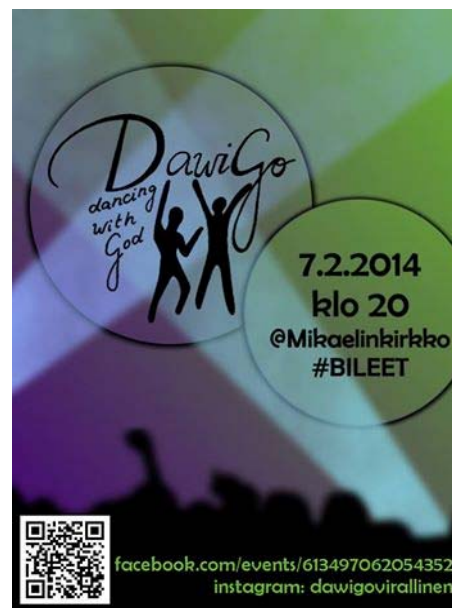
KUVAT 4. ja 5. Nuorten tekemät mainosjuliste ja flyer- joita jaettiin ennen tapahtumaa

Messulle tehtiin mainosvideo, jonka suunnittelun ja kuvaamisen toteuttivat nuoret kokonaan itse. Kuvauspaikkana käytettiin Turun kaupungin nuorisotoimen taide- ja toimintakeskus Vimmaa, jossa on loistavat tilat ja editointimahdollisuudet. Vimmassa vietettiin nuorten kanssa kaksi pitkää lauantapäivää, jolloin kuvattiin pätkiä videoihin ja tehtiin messun eri osissa käytettäviä videomateriaaleja. Mainosvideo julkaistiin ja jaettiin facebook:ssa sekä YouTube-verkkosivuilla. Nuoret suunnittelivat ja kuvasivat sekä editoivat messun eri vaiheissa käytetyt videot omatoimisesti kokonaan itse. Videotehosteita käytettiin messun alussa, synnintunnustusosuudessa ja rukousjaksossa. Messun muissa kohdissa taustalla oli kokoajan messun logo.