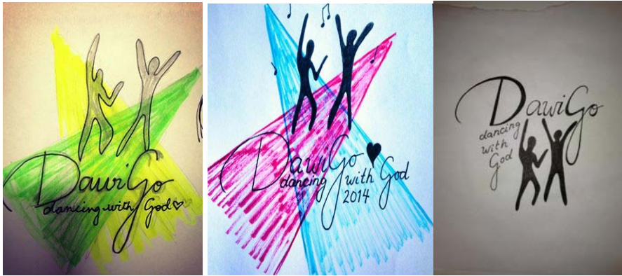
KUVAT 1., 2. ja 3. Kuvia logon suunnittelu vaiheista