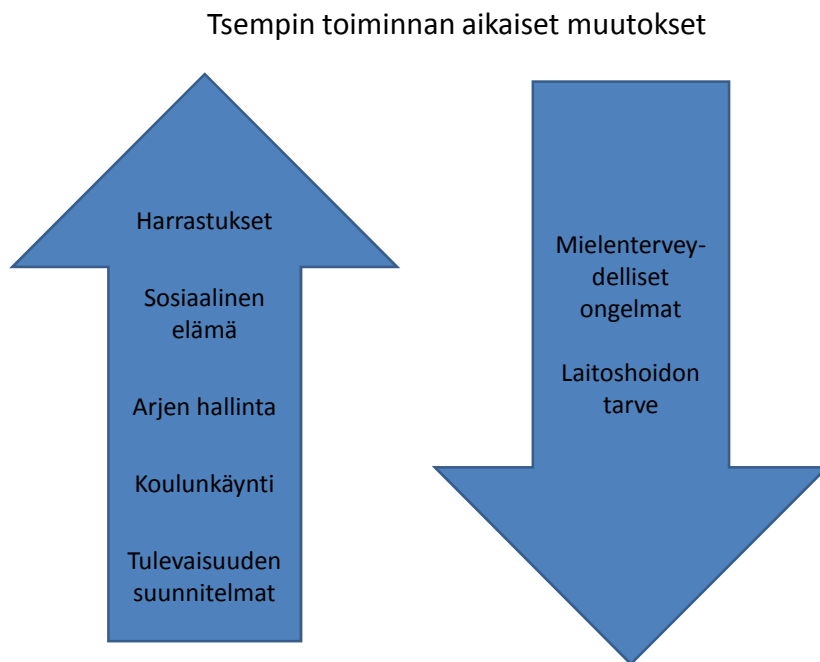
Kaavio 2. Tsempin toiminnan aikaiset muutokset.

Tsempin toiminnan myötä nuoret kokivat, että harrastustoiminta oli pikkuhiljaa lisääntynyt, tai järkevoitynyt. Sosiaalinen elämä oli huomattavasti parantunut niin läheisiin kuin ystäviinkin. Arjenhallinta alkoi sujua jokaisella vastaajalla, eikä ahdistuksen myötä jäänyt heti taka-alalle. Koulunkäynti oli edennyt jokaisella vastaajalla ja tulevaisuus oli saanut täysin uuden merkityksen elämässä. Sen sijaan mielenterveydelliset ongelmat oli nuorten mielestä hallinnassa, jopa vähentynyt ja laitoshoidon tarvetta kukaan ei nähnyt enää tarpeellisena.