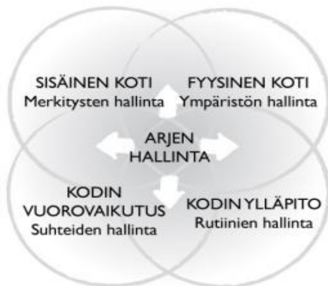
Kuva 1. Arjenhallinnan malli. Kivelä & Lempinen 2010.

nuoret kokivat tulevaisuudenuskon, terveyden, elintason ja yhteisöllisyyden. (Kallunki 2013,17–20).