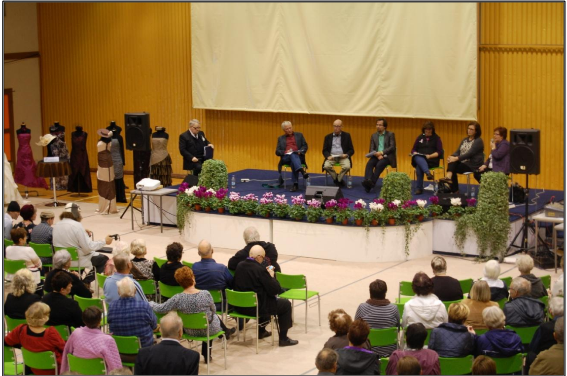
KUVA 1. Paneelikeskustelu keräsi runsaasti muun muassa kunnallisesta vanhuspolitiikasta kiinnostuneita

Paneelikeskustelun ottamista osaksi ohjelmaa alettiin harkita toukokuussa järjestetyssä messupalaverissa. Paneelia suunniteltiin sopimalla, että kaikki toisivat seuraavaan palaveriin ideoita keskustelun aiheista ja kysymyksistä, joista yhdessä kasataan keskustelun runko. Käytyämme läpi esiin tulleet ideat sovimme, että messupäällikkö vastaa sopivien paneelikeskustelijoiden kysymisestä ja tapahtuman juontaja suunnittelee Mannolan esityslistalla olevan kappaleen sanoituksista keskustelun otsakkeen ja sisällön. Pääteema päätettiin kollektiivisesti liittää hyvään vanhuuteen niin että panelistit voisivat orientoitua aiheeseen Vanhustyön keskusliiton ”Hyviä vuosia” -lehden avulla, jotka messupäällikön tehtävänä oli heille lähettää. Panelisteiksi kysyttiin vanhustyön viranomaisia sekä kunnallispoliitikkoja eri puolueista. Paneelikeskustelun aikana myös yleisölle annettiin mahdollisuus esittää kysymyksiä ja kannanottoja: pyrkimyksenä oli mahdollistaa ikään-tyneiden sosiaalinen aktiivisuus, johon viittasin aiemmin käsitellessä ikäihmisten sosio-ekonomista asemaa. Foorumin otsikoksi tuli ”Sellaista elämä on – vai onko?” ja ennakkoon vain panelisteille annetut aiheet olivat seuraavat: