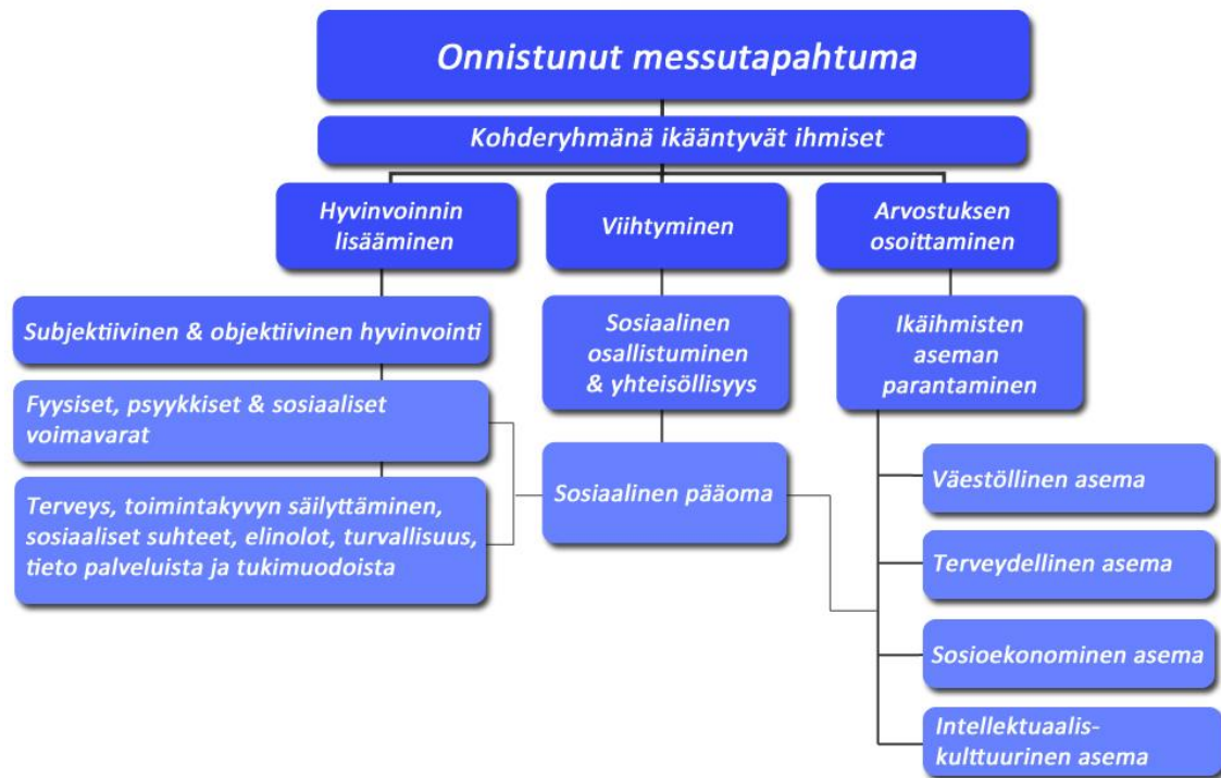
KUVIO 2. Tapahtuman tavoitteet