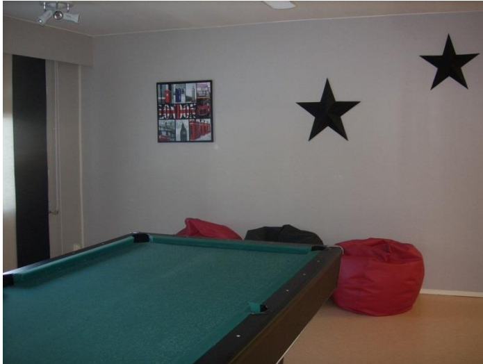
Kuvio 5. Vapaa-ajantila jälkeen

Niin sanotun vanhan kanttiinin alakerrassa on huone, jossa voi hakata nyrkkeilyssä. Nuoret pääsevät purkamaan energiaansa säkkiin, samalla kunto kohe-nee. Syksyllä haastatteleman poika kyseli, missä voisi korjata skootteriaan. Säkkihuoneen vieressä oli tyhjä huone, joten hetkessä huoneesta tuli korjaamo. Alkukysyistä pojat pitivät huonetta treenikämpänä, soittivat omilla kitaroillaan ja kosketinsoittimella. Nyt talvella on hiljaisempaa, mitä keväemmäksi mennään, sitä aktiivisempia nuoret ovat. Alakerrassa on myös saunatilat. Osa pojista saunoo, 2-3 kertaa viikossa.