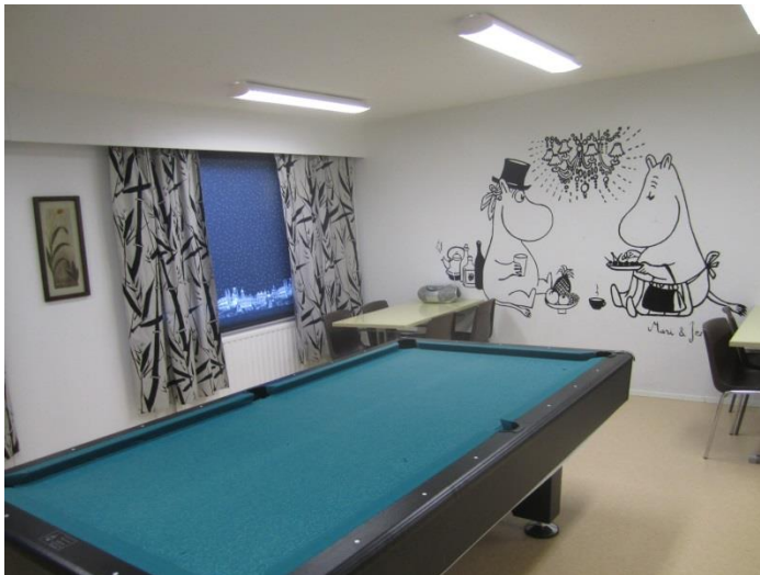
Kuvio 4. Vapaa-ajantila ennen

Toinen asuntolassa asuvista tytöistä kiersi ja kyseli asuntolassa asuvilta nuorilta, mitä muutoksia he haluavat vapaa-ajantilaan. Nuoret kertoivat, että paikka on niin väritön. Yhtenä toivomuksena heillä oli, että yksi huoneista voisi olla elokuvien katseluhuone. Vuoden 2013 lopulla kolme rakennuspuolen opiskelijaa teki remonttia vapaa-ajantiloissa. Seinät saivat uutta väriä pintaa. Sähkötyöt on tehty. Katossa on uusia kohdevaloja, loisteputkivaloja on vähennetty. Ikkunoihin on hankittu uudet paneeliverhot. Seinällä on kello ja tauluja. Lattialla on säkkituoleja. Entisestä tietokonehuoneesta on tehty elokuvien katseluhuone. Oppilaskunnan hallituksessa vaikuttavat, asuntolassa asuvat tytöt, näkevät itsensä toimijoina, jotka voivat saada aikaan muutoksia ympäristössään. He tuntevat osallisuutta.