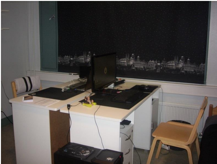
Kuvio 3. Poikien huone