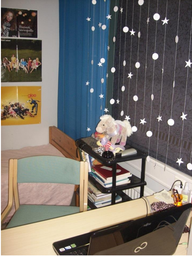
Kuvio 2. Tytön huone