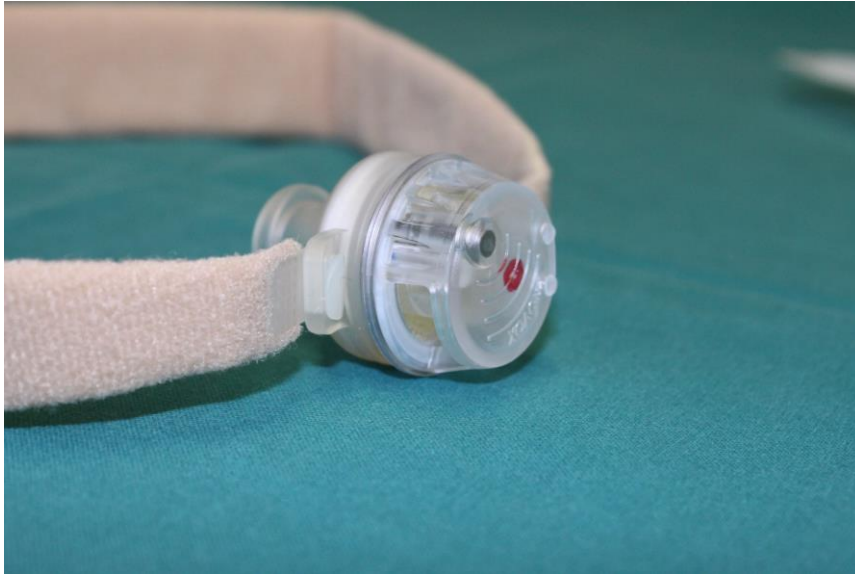
KUVA 9. Freehands kiinnitettynä larybuttoniin ja kiinnitysnauhaan

Freehandsiä (kuva 9) eli automaattisella puheläpällä varustettua kosteuslämpövaihdinta, voivat käyttää kaikki potilaat, joille on asetettu puheproteesi. Freehandsissa on kosteuslämpövaihdin, joka sulkeutuu automaattisesti puhuttaessa. Freehandsillä hengittäminen ja puhuminen on raskaampaa kuin normaalilla kosteuslämpövaihtimella, mutta se on varsin kätevä tilanteissa, joissa tarvitaan molempia käsiä muuhun käyttöön. Freehandsin ja kosteuslämpövaihtimen voi kiinnittää liimapohjaan, larytuubiin tai larybuttoniin. (Bäck & Mäkitie 2007, 10-11; Atos Medical 2005, 10.)