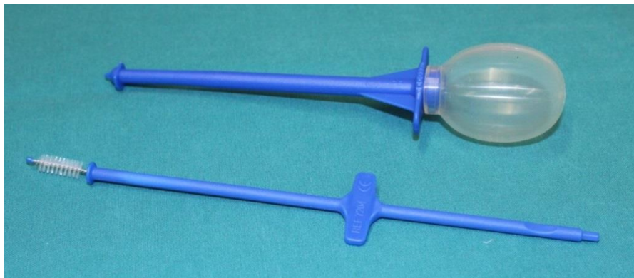
KUVA 2. Huuhtelulaite ja puhdistusharja

nessa ja peilin edessä. Harja tulee työntää proteesin siniseen renkaan läpi ja liikuttaa sitä edestakaisin pyöriin liikkein proteesissa. Näin proteesista saadaan poistettua ruoka ja lima. Ääniproteesi voidaan puhdistaa myös huuhtelulaitteella, jolla suihkutetaan puhdasta vettä proteesin läpi. Huuhtelupumppuun imetään puhdasta vettä, asetetaan se tiiviisti proteesiin kiinni ja huuhdellaan proteesi puristamalla palloa, jolloin vesi suihkuu proteesin läpi. Huuhtelussa on erittäin tärkeää huomioida, että huuhtelupumppu on tiiviisti kiinni proteesissa koko huuhtelun ajan, jotta vesi ei pääse valumaan keuhkoihin. (Atos medical 2005, 8-9; Ollgren 2014.)