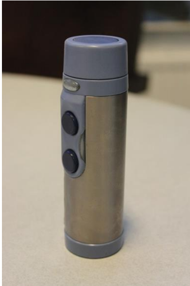
KUVA 3. Puhevibraattori

Puhevibraattori (kuva 3) on elektroninen laite, jota painetaan kädellä kaulalle, haluttaessa tuottaa puhetta. Puhuttaessa kudosten värähtely muuntuu puheääneksi puhevibraattorin avulla (Atos medical 2005, 6). Puhe on helppo oppia, mutta tuotetun puheen ääni on mekaanisempaa, kuin muissa puhemenetelmissä. (Atos Medical 2011, 6.)