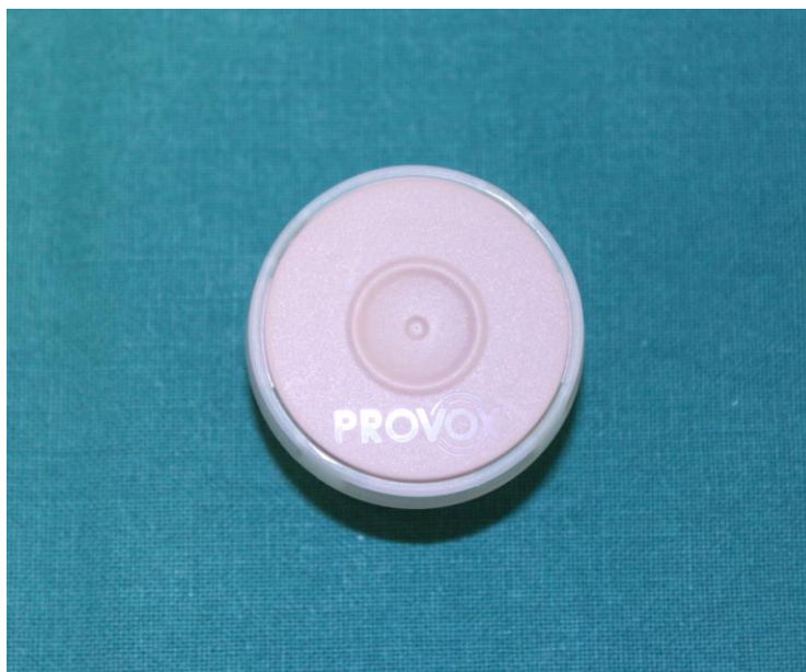
KUVA 7. Kosteuslämpövaihdin

Kosteuslämpövaihtimessa hengitysilma kulkee sivussa olevien aukkojen kautta. Puhuttaessa sen päällä oleva läppä painetaan alas, jolloin ilma ohjautuu ääniproteesiin. Kosteuslämpövaihtimia on saatavissa normaalikäyttöön ja vähäisemmällä hengitysvastuksella fyysisiin aktiviteetteihin. Kosteuslämpövaihdinta suositellaan käytettäväksi jatkuvasti ja se tulisi vaihtaa vähintään kerran vuorokaudessa. Kosteuslämpövaihtimen käyttö vähentää erilaisia keuhko-oireita, kuten yskimistä sekä limantuottoa ja sen on todettu parantavan puheen laatua. Kosteuslämpövaihtimen käyttö ei vaadi ääniproteesia, joten myös sitä voi käyttää kaikki äänentuoton menetelmästä riippumatta. (Ollgren 2014; Bäck & Mäkitie 2007, 10; Atos Medical 2005 10.)