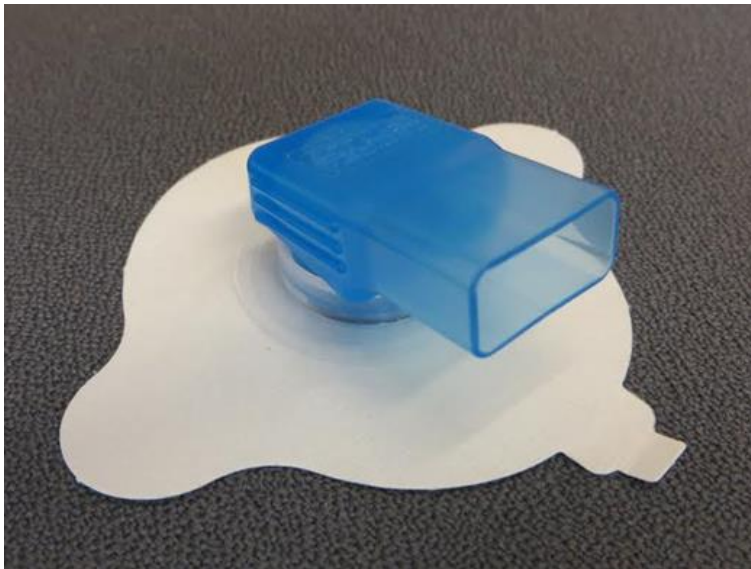
KUVA 10. Suihkusuoja kiinnitettynä liimapohjaan

Muutaman kuukauden ajan leikkauksen jälkeen parranajo voi olla haasteellista leikkauksen aiheuttaman ihon tunnottomuuden vuoksi. Ihon viiltämisen välttämiseksi on suositeltavaa käyttää elektronista parranajokonetta, kunnes ihon tunto palautuu. (Atos Medical 2011, 10.)