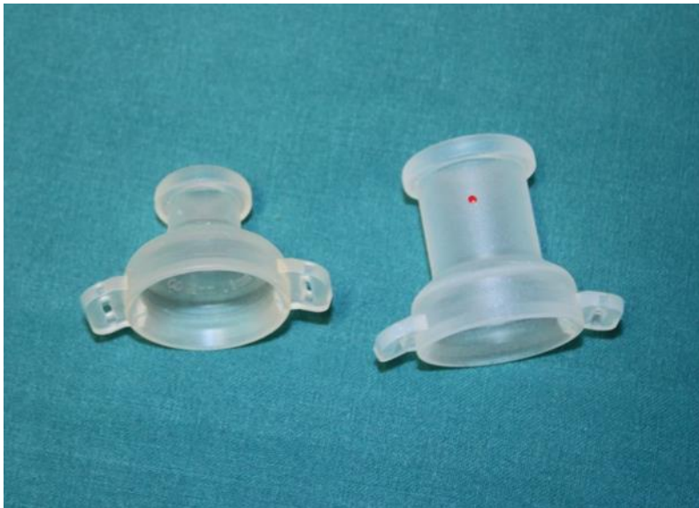
KUVA 5. Erilaisia larybuttoneita

Larytuubit ja –buttonit tarvitsevat pysyäkseen paikoillaan kiinnitysmekanismien. Tällaisia ovat kiinnitysnauhat ja –palat (kuva 6). Kaikkiin muihin larytuubeihin ja –buttoneihin käyvät sekä klipsi- että teippikiinnikkeelliset kiinnitysmekanismit, paitsi sinirenkaiseen larytuubiin, missä kiinnikekohtaa ei ole. Sinirenkainen larytuubi on tarkoitettu kiinnitettäväksi liimapohjaan. Sopivimman kiinnitys vaihtoehdon voi potilas valita itse. Kiinnitysnauhvoja ja –paloja saa sekä ihonvärisinä, että valkoisina. (Ollgren 2014.)