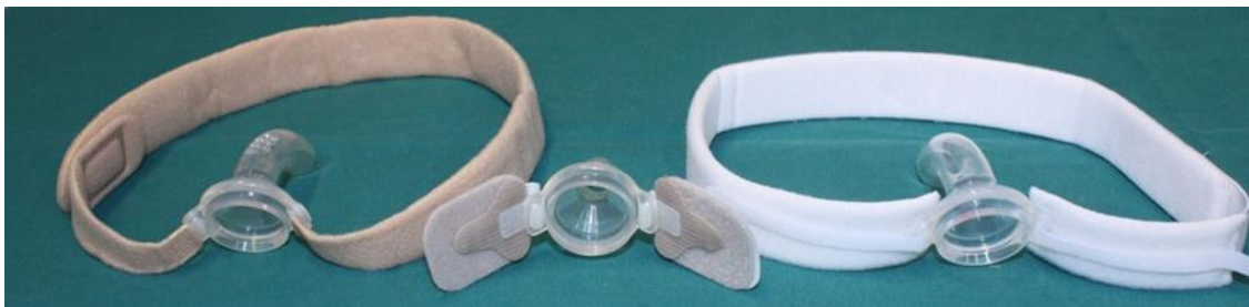
KUVA 6. Erilaisia larytuubien/-buttonien kiinnitystarvikkeita

Larytuubit ja –buttonit tarvitsevat pysyäkseen paikoillaan kiinnitysmekanismien. Tällaisia ovat kiinnitysnauhat ja –palat (kuva 6). Kaikkiin muihin larytuubeihin ja –buttoneihin käyvät sekä klipsi- että teippikiinnikkeelliset kiinnitysmekanismit, paitsi sinirenkaiseen larytuubiin, missä kiinnikekohtaa ei ole. Sinirenkainen larytuubi on tarkoitettu kiinnitettäväksi liimapohjaan. Sopivimman kiinnitys vaihtoehdon voi potilas valita itse. Kiinnitysnauhvoja ja –paloja saa sekä ihonvärisinä, että valkoisina. (Ollgren 2014.)