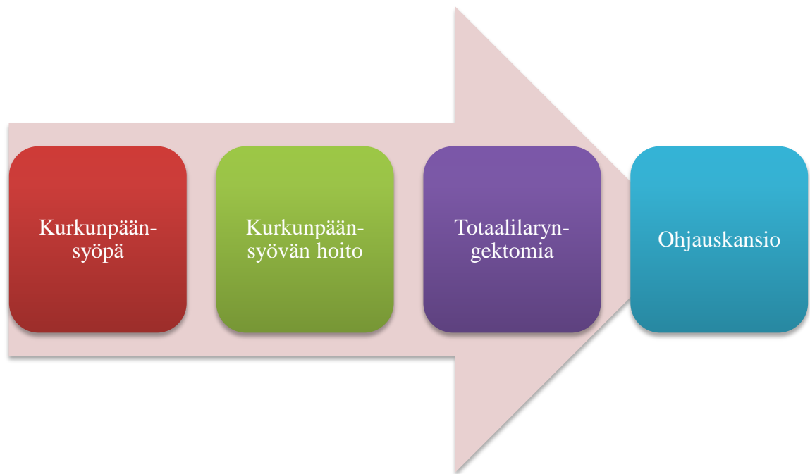
KUVIO 1. Opinnäytetyön keskeiset käsitteet

Opinnäytetyömme aihe ja teoreettiset lähtökohdat muodostuivat työelämäyhteyshenkilön kanssa käytyjen keskustelujen pohjalta. Työmme teoreettiset lähtökohdat perustuvat käsitteisiin, jotka on esitetty kuvion muodossa (kuvio 1). Opinnäytetyömme tuotoksena syntyy ohjauskansio totaalilaryngektomoiduille potilaille. Keskeisimmät käsitteet ovat kurkunpäänsyöpä, kurkunpäänsyövän hoito, totaalilaryngektomia ja ohjauskansio.