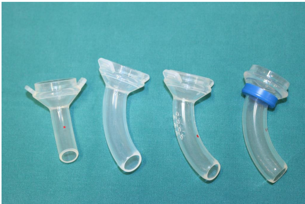
KUVA 4. Erilaisia larytuubeja

Larytuubilla voidaan estää aukon kureutumista. Myöhemmin kun aukko on muotoutunut ja haava arpeutunut, voi larytuubin käytön lopettaa kokonaan tai sitä potilas voi käyttää esimerkiksi vain öisin. Kun larytuubia joutuu käyttämään pitkään, on hyvä vaihtaa se uuteen kuukauden välein. Larybuttonit (kuva 5) ovat tuubien tapaan silikonista valmistettuja, mutta tuubia lyhyempiä ja leveämpiä putkia. Larybuttonia voidaan käyttää etenkin sellaisissa tapauksissa, joissa larytuubi aiheuttaa yskänärstyystä pituutensa vuoksi. (Bäck & Mäkitie 2007, 10; Atos Medical 2005, 13; Ollgren 2014.)