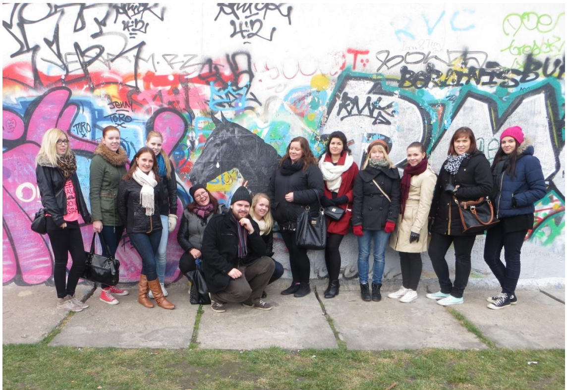
KUVA 11. Osa ryhmästä Berliinin muurilla

Oheisohjelmasta ei haluttu suunnitella liian tiukkaa, koska matka oli hyvin lyhyt. Mikään oheisohjelmasta ei ollut opiskelijoille pakollista vaan osallistua saivat kaikki halukkaat. Päätettiin tehdä pieni nähtävyyssierros, johon kuului Berliinin muurin ihmetteleminen East Side Galleryssä ja maisemien ihailu Berliinin televisiotornissa, sekä yhteinen illallinen ensimmäisenä iltana Pangea People hostelin ravintolassa.