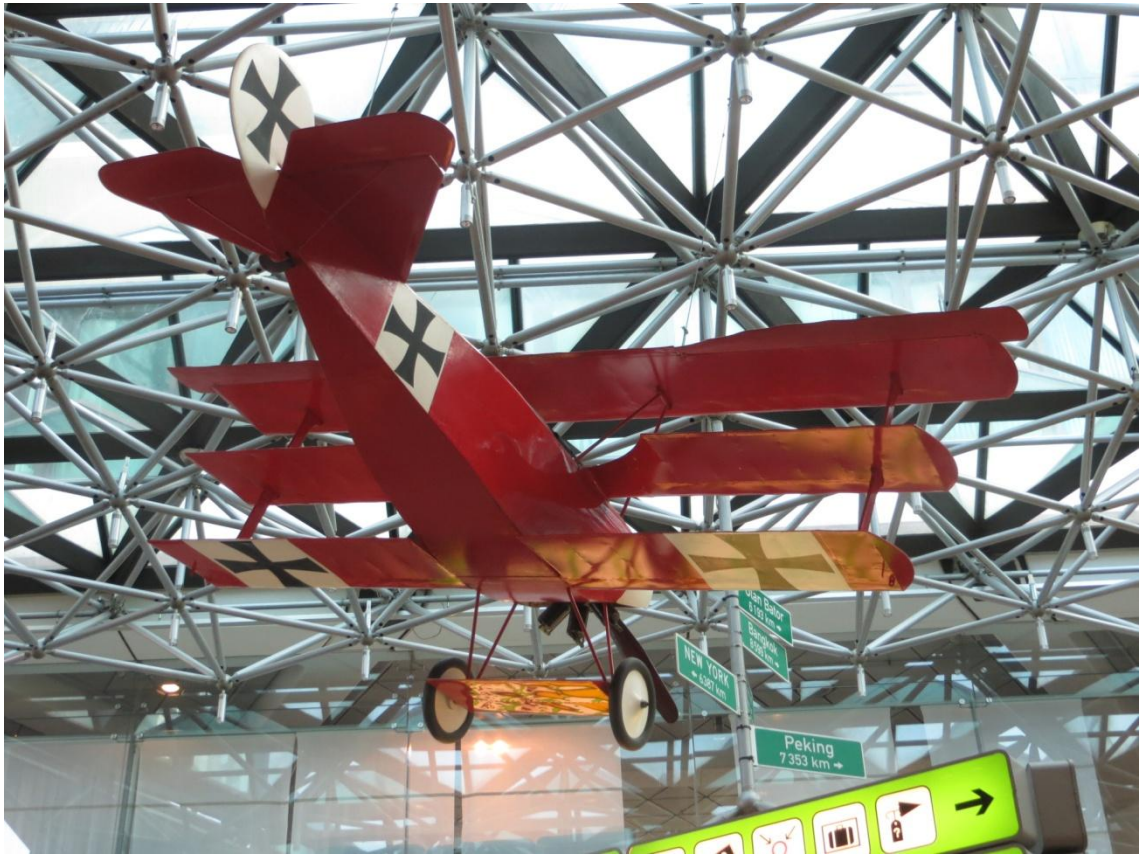
KUVA 2. Pieni lentokone Tegelin lentokentällä

Berliinissä on kaksi lentokenttää, Schönefeld ja Tegel, joihin julkisella liitenteellä on hyvät yhteydet. Suomesta Berliiniin voi matkustaa myös muillakin kulkuvälineillä kuin lentokoneella. Berliiniin voi matkustaa junalla, laivalla, autolla tai vaikkapa bussilla. Junalla matkustettaessa Berliiniin pääsee InterCityExpress-, InterCity-, EuroCity- ja InterRegio junilla. Juna-asemat Berliinissä ovat hyvin yhteydessä julkisen liikenteen kanssa. Junaliput kannattaa ostaa etukäteen, sillä niihin voi saada erikoishintoja. Suosittu on Bahncard, jolla saa alennuksia junalippuihin vuoden ajan. (Visit Berlin 2014.)