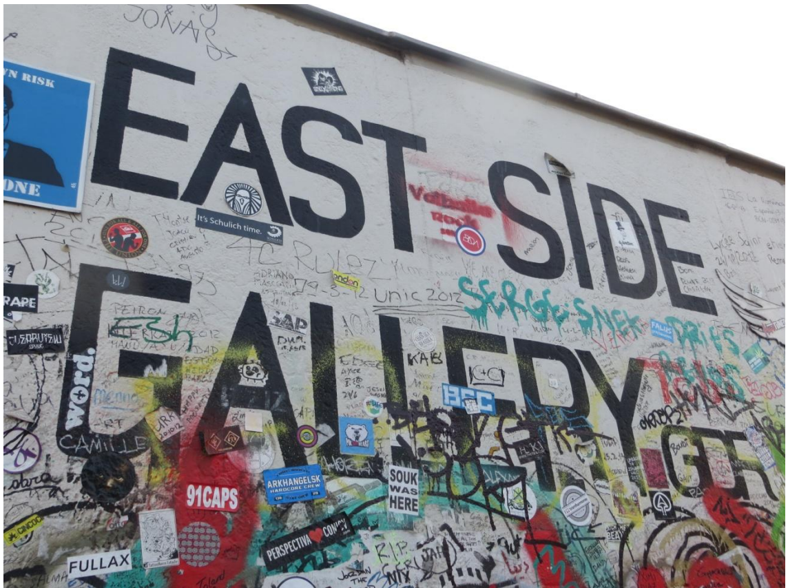
KUVA 5. Berliinin muuria East Side Galleryssä

Pisin pätkä Berliinin muuria on pystyssä East Side Galleryssä. 1,3 km pituinen muurinpätkä on jätetty paikalleen muistuttamaan kahtia jaetusta Berliinistä. Useat kansainväliset taiteilijat koristelivat muurin pian rajojen avautumisen jälkeen ja nykyään muuri onkin maailman suurin ulkoilmagalleria. Aika, sää, turistit ja graffitin tekijät ovat jättäneet myös oman jälkensä muurin pintaan. 40-metrinen osuus muurista on siirretty hieman kauemmas, jotta O2 Areenalle saatiin suora pääsy joelta, jonka vieressä East Side Gallery sijaitsee. (Lonely Planet, 147, 150.)