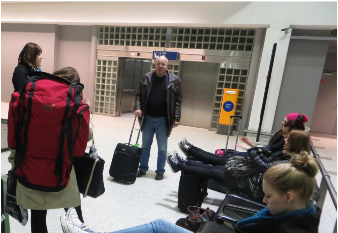
KUVA 22. Kiitospuhe Helsinki-Vantaalla

Lennon ilmestyttyä lähtevien lentojen listalle huomattiin, että lento lähti eri terminaalista, kuin minkä eteen bussi oli ryhmän jättänyt. Koko ryhmä oli huomannut tämän ja siirtyi nopeasti oikealle lähtöselvitysalueelle. Mitään ongelmia lähtöselvityksessä ei taaskaan ollut eikä tulostettuja lentolippuja tarvittu. Tällä kertaa myös turvatarkastuksessa useammat ihmiset saivat pitää kengätkin jaloissaan. Terminaali josta lento lähti, oli hyvin pieni eikä siellä ollut kuin yksi kahvila, muutama hyvin pieni kioski ja pieni tax free -myymälä. Suurin osa ryhmästä istui yhdessä ryppäässä lentokentän tuoleilla ja lattialla syöden kahvilasta ostettua pientä evästä. Aika kului nopeasti ja pian olikin jo aika nousta koneeseen. Koneeseen nousu tapahtui kävelemällä ulkokautta portaita pitkin ja kaikki löysivät paikkansa helposti. Ensin lennettiin Osloon, missä oli tunnin vaihto aika. Oslostalennettiin Helsinki-Vantaalle ja molemmilla lennoilla tarjoiitiin ilmaisen kahvia ja teetä. Kentältä jokainen sai lähteä omia aikojaan kotiin ja ryhmäläisten, jotka jäivät odottamaan bussia Tampereelle, kesken pidettiin pieni opettajan johtama kiitospuhe.