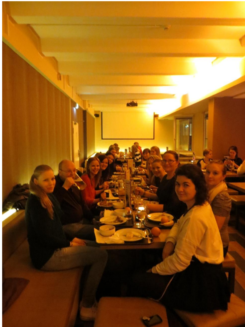
KUVA 16. Illallinen hostellin ravintolassa

Hostellin ravintolasta oli varattu kello 19 illallisbuffet koko ryhmälle ja kaikki saapuivatkin paikalle. Buffet oli hyvin niukka ja melkein koko ryhmälle pettymys. Ryhmäläiset nauroivat, että olo on kuin kouluruokalassa. Ainoana erona oli se, että monilla oli ruokajuomana olutta. Ruokajuomat vettä lukuun ottamatta olivat omakustanteisia. Ruokailun jälkeen ryhmä jäi halpojen cocktailien innoittamana istumaan hostellin baariin, joka oli siis sama paikka kuin ravintolakin. Tämän jälkeen osa ryhmästä jatkoi iltaansa vapaasti kaupungilla ja osa päätti mennä nukkumaan, jotta olisi virkeänä aamulla.