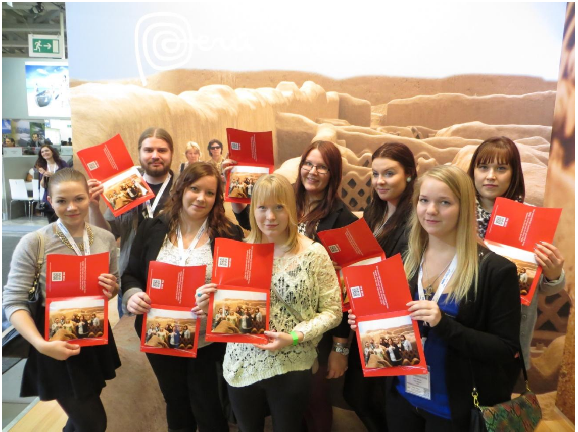
KUVA 17. Perun osastolla messuilla

Aamiaisbuffet oli varattu klo 8.30. Ruokailuun oli aikaa vain puoli tuntia, koska aamiaistilat olivat pienet ja ryhmän jälkeen oli tulossa aamiaiselle toinen suuri ryhmä. Klo 10 ryhmä kokoontui hostellin edessä ja kaikille jaettiin messuliput. Muutamia ryhmäläisiä jouduttiin odottamaan, mutta klo 10.30 mennessä oltiin jo etsimässä oikeita junaraiteita Alexanderplatzilla, josta meni suora juna messukeskukselle.