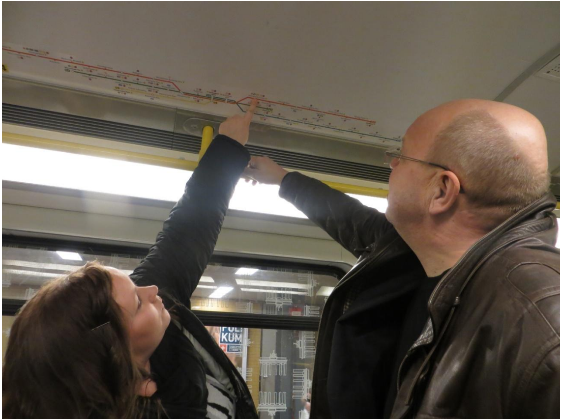
KUVA 12. Metrokartan tulkitsemista

nattaa ostaa vasta Tegelin lentokentältä. Korteilla oli myös mahdollista saada alennusta lukuisista nähtävyyksistä ja turistikohteista.