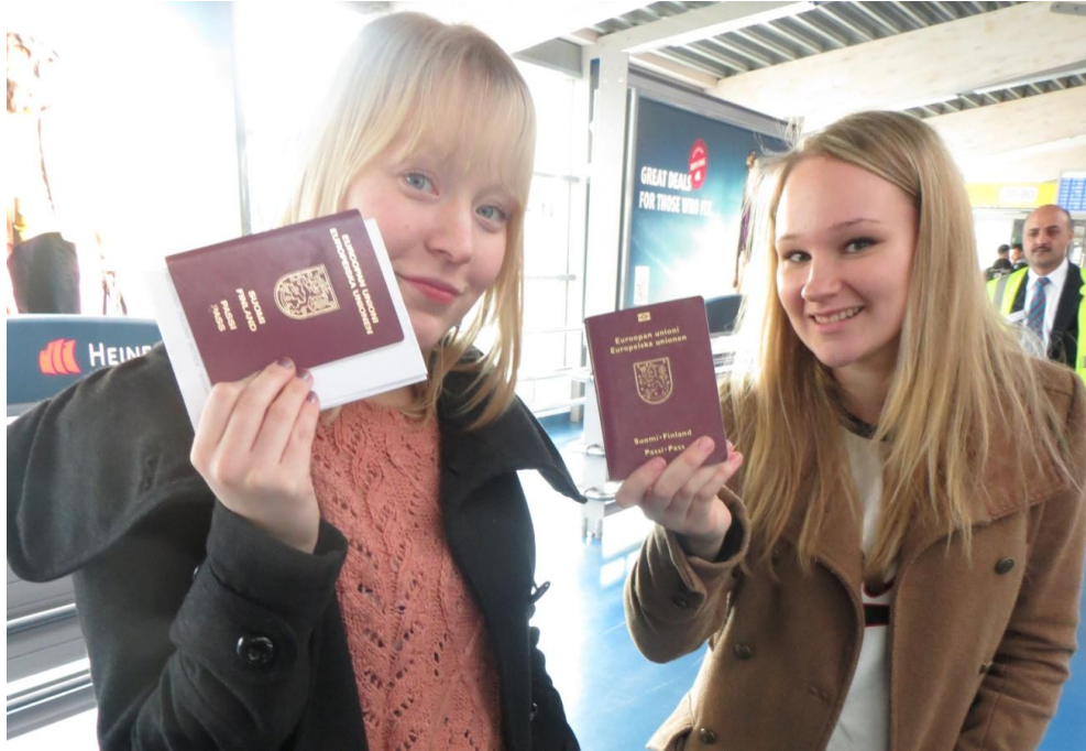
KUVA 7. Kaikilla oli passit mukana