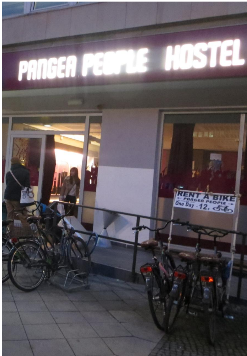
KUVA 3. Hostellin sisäänkäynti

Hostellissa majoittuminen on yleensä edullisempi vaihtoehto hotellille. Huoneiden kunto ei myöskään yleensä ole hotellien luokkaa, mutta edullisuutensa vuoksi hostellit ovat suosittuja majoitusvaihtoehtoja. Hostelleissa viehättää myös muiden matkailijoiden seura. Hostellissa tapaa helposti ihmisiä eri puolilta maailmaa ja heidän kanssaan on mukava vaihtaa kuulumisia ja vinkkejä matkailuun liittyen. (Unipress 2010, 53.)