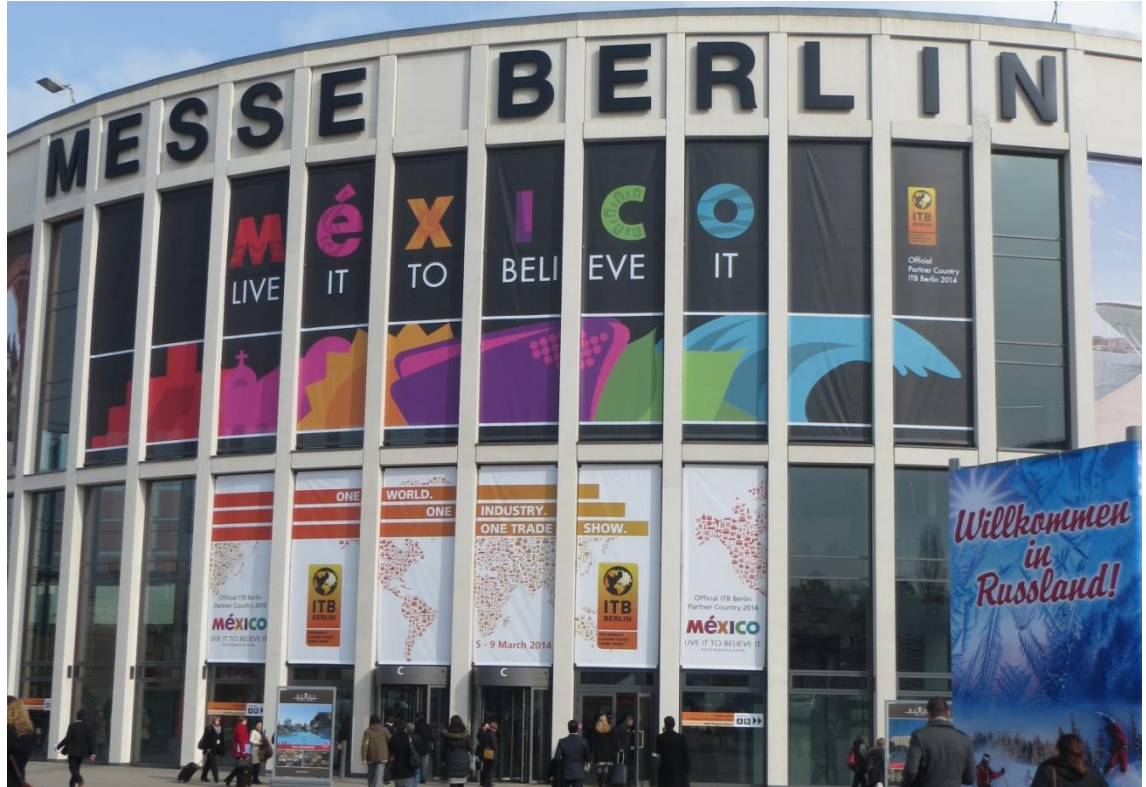
KUVA 6. Berliinin messukeskus

Messualueen koko on yhteensä 160 000 m 2 ja erikokoisia messuhalleja on 25 kappaletta (ITB Berlin 2014). Näytteilleasettajat oli messuilla niputettu loogisiin ryhmiin ja järjestetty näin ympäri messualueetta. Messualueen karttaan eri ryhmät oli värikoodattu, mikä teki kartan lukemisesta ja messujen tarjontaan tutustumisesta helpompaa.