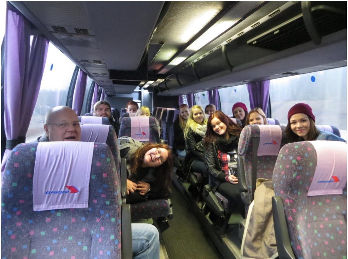
KUVA 13. Linja-autossa matkalla lentokentälle

Lento lähti Helsinki-Vantaan lentokentältä klo 10.45. Opiskelijoiden täytyi itse hankkia kuljetukset lentokentälle. Halvimmaksi vaihtoehdoksi suositeltiin julkisista liikennevälineistä bussia, joka lähti Tampereen linja-autoasemalta klo 6.30. Moni ryhmästä päätti tulla suositellulla bussilla, mutta jotkut tulivat omilla autoilla tai viettivät jo edellisen yön Helsingissä.