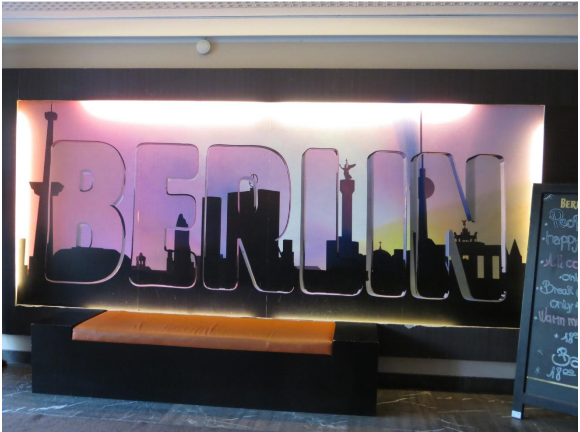
KUVA 23. Hostellin aulasta

Kyselyn kolmas kategoria oli majoituspaikka. Apukysymyksinä käytettiin seuraavia kysymyksiä: Mitä mieltä olit illallisesta ja aamupaloista? Olitko tyytyväinen huoneisiin? Millainen mielestäsi oli hostellin sijainti? Tässä kategoriassa yleisarvosanojen keskiarvoksi tuli 4,3. Kaikkien ryhmäläisten mielestä aamupalat olivat hyvät, mutta keskiviikkoillan illallinen oli suurimmalle osalle pieni pettymys. Hostellin sijainnista saatiin myös palautetta. Suurin osa oli todella tyytyväisiä hostellin sijaintiin, mutta yhden mielestä sijainti oli hassu ja yksi ei tiennyt tarkasti, missä kohtaa Berliiniä hostellimme oli. Positiivista palautetta tuli myös siitä, että kaikki ryhmäläiset majoittuivat samassa kerroksessa. Miinuksina nähtiin hostellin ohuet seinät, jotka eivät eristäneet käytävän ääniä kovin tehokkaasti. Toivottiin myös, että hostellihuoneissa olisi ollut enemmän pistorasioita, ja että jokaisen sängyn vieressä olisi ollut oma yölamppu. Huoneiden ainoat valaisimet olivat kattolamput. Myös suihkujen lämmin vesi tuntui joidenkin mielestä olevan kortilla.