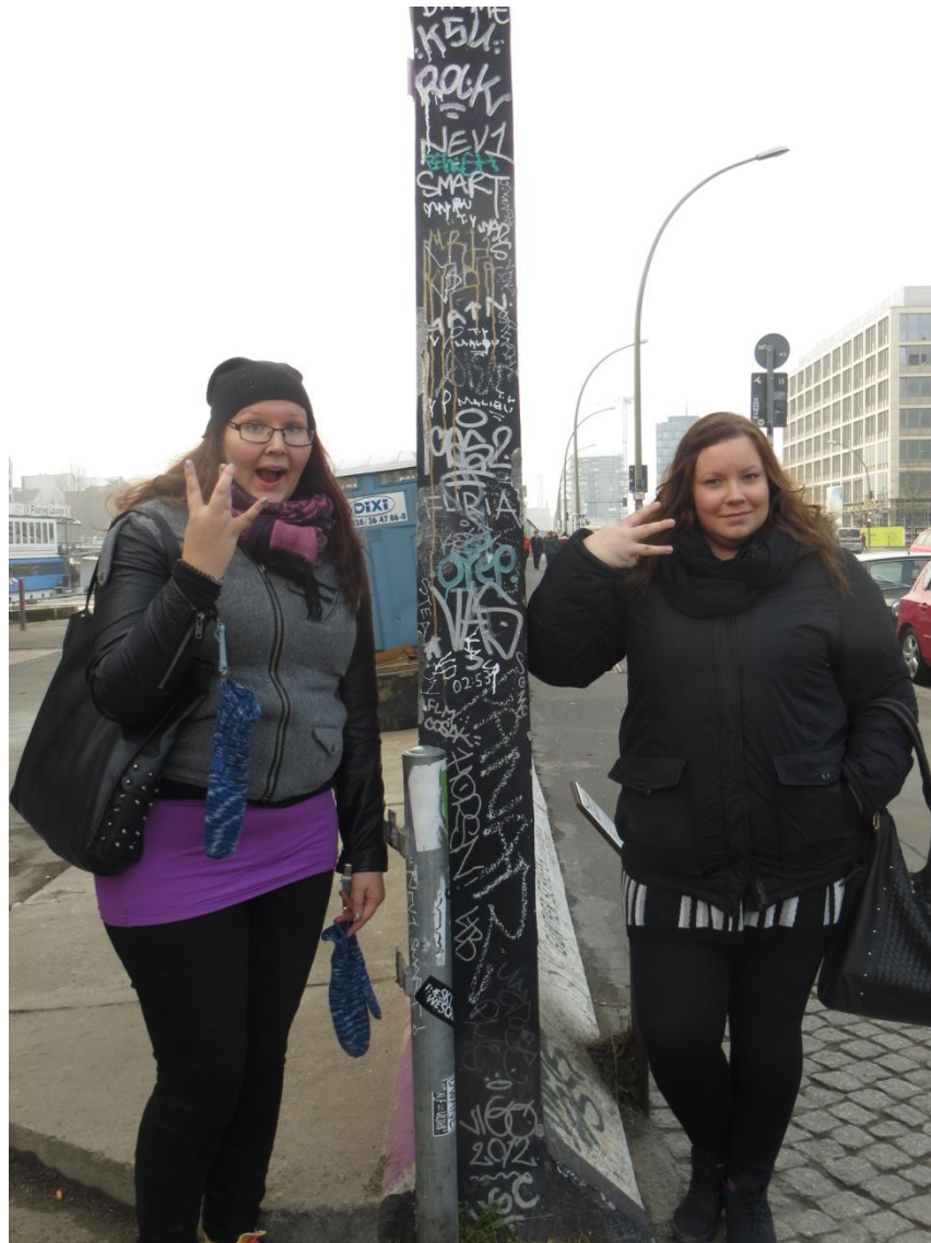
KUVA 9. Matkanjohtajat Berliinin muurin molemmin puolin

Toinen matkanjohtajista piti matkan ajan matkapäiväkirjaa, johon kirjasi tuoreeltaan tapahtumia ja tunteita (ks. Liite 4). Iltaisin hän kirjasi päivän yleistunnelmat ja tekemiset. Tarkoituksena oli muistaa jällempäin kaikki tapahtunut ja matkalaisilta tullut suullinen palaute ja mielipiteet. Matkapäiväkirjaan matkanjohtaja kirjasi myös mahdollisia kehityskohteita, miten jokin asia olisi voitu tehdä fiksummin tai tehokkaammin.