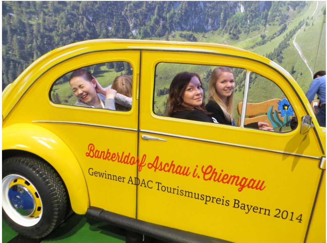
KUVA 18. Messuista nautiskelua

Messuilla koko joukko kiersi vapaasti omissa pienissä ryhmissään ja lähteä sai kun koki olevansa valmis. Ryhmä, jossa matkanjohtajat olivat mukana, kiersi todella suurta messualuetta kello neljään asti. Messualuetta ei yhden päivän aikana ehtinyt kiertää kokonaan, vaan messukartasta valittiin kiinnostavimmat alueet. Heti alkuun Perun pisteellä otettiin yhteiskuva heidän lavasteessaan sekä messujen lopuksi SAT.1 televisiokanavan toimittaja bongasi matkanjohtajien ryhmän ja haastatteli heitä hetken aikaa televisioon.