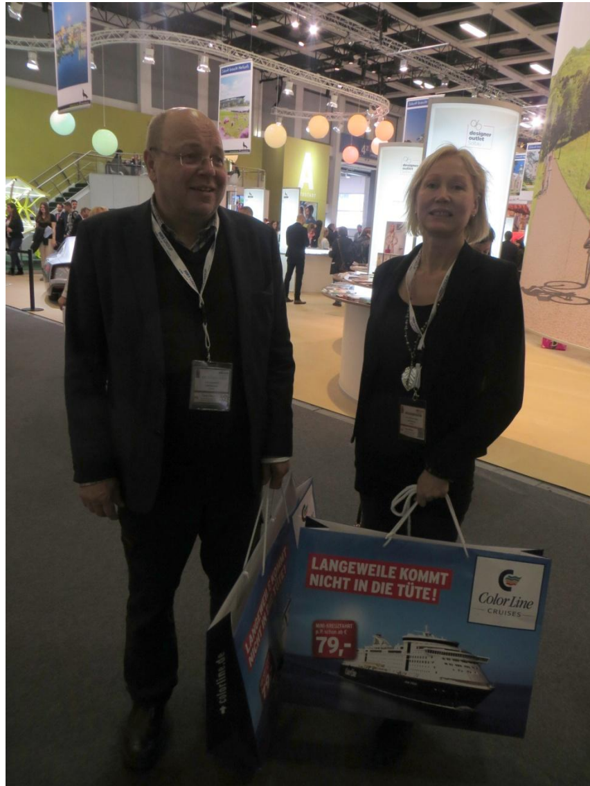
KUVA 19. Opettajat messuilla

Kaikki ryhmäläiset lähtivät messuilta omia aikojaan eikä loppupäivälle ollut yhteistä ohjelmaa. Moni ryhmästä lähti kaupungille ostoksille ja syömään. Tämän jälkeen osa ryhmästä kävi ostamassa liput televisiotorniin, johon jonoa tällä kertaa oli noin kaksi tuntia. Berlin Welcome Cardilla he saivat lipuista alennusta 25 %. Pitkän jonotusajan vuoksi oli ilta jo hämärtynyt, kun he pääsivät ylös torniin. Sää oli kuitenkin tällä kertaa kirkas ja kaupungin valot loistivat kauniina kaukaakin ylös asti.