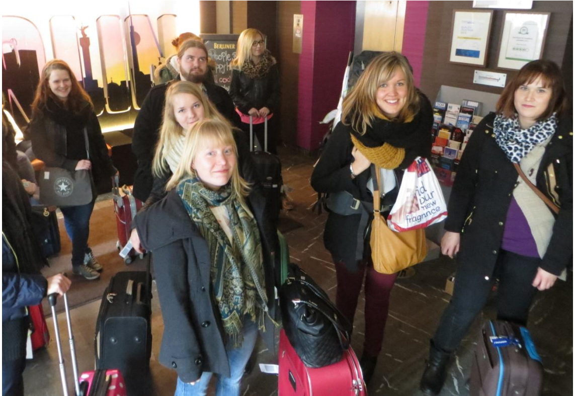
KUVA 14. Saapuminen hostellille

Hostellin huoneissa nukuttiin kerrossängyissä. Sänkyjen lisäksi huoneissa oli pieni pöytä ja yksi kaappi jokaista sänkyä kohden. Kaapin pystyi lukitsemaan omalla lukolla. Huoneet olivat pelkistettyjä, niin kuin hostellilta saattaakin odottaa, mutta silti siistejä. Matkan aikana ja sen jälkeen saadun palautteen perusteella ryhmäläisiä häiritsi huoneissa eniten pistorasioiden vähäinen määrä ja niiden huono sijoittelu. Samalla käytävällä huoneiden kanssa oli myös naisten ja miesten WC:t sekä suihkuhuone. Kuudennessa kerroksessa toimi hostellin ravintola sekä baari. Siellä oli myös mahdollista pelata biljardia. Samassa tilassa tarjottiin myös aamupala- sekä illallisbuffet. Happy Hourin aikana klo 18–21 kaikki cocktailit olivat tarjouksessa 4 €/kpl, mikä houkutti ryhmäläisiä.