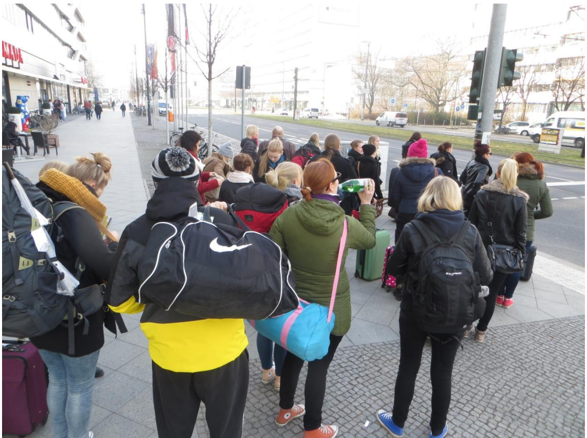
KUVA 21. Ryhmä lähdössä lentokentälle

Aamiaisbuffet oli varattu yhdeksäksi eikä sinne aikaisemmin päässyt syömään, koska isompi ryhmä söi tällä kertaa aamiaista ennen TAMKilaisten ryhmää. Kaikki ryhmäläiset eivät saapuneet aamiaiselle, mutta suurin osa oli kuitenkin paikalla. Heti aamiaisen jälkeen klo 10 oli sovittu tapaaminen hostellin edessä tavarat pakattuina ja huoneet luovutettuina. Hostellin edessä kaikille jaettiin tulostetut lentoliput, vaikkei niitä tullessakaan oltu kummemmin tarvittu. Kaikki ryhmäläiset eivät aivan tähän aikatauluun kyenneet, mutta onneksi matkanjohtajat olivat varanneet hieman extra-aikaa lentokentälle siirtymiseen aavistaen, että joillakuilla silmäluomet painavat aamulla. Näin ollen noin puolen tunnin myöhästyminen suunnitellusta lähdöstä ei haitannut ollenkaan. Lentokentälle siirryttiin TXL bussilla, joka lähti samalta kadulta muutaman sadan metrin päästä hostellista. Matkalla bussille osa jätti kortteja postilaatikkoon. Bussi vei ryhmän suoraan lentokentälle. Lento ei ollut vielä näkyvillä lähtevien lentojen listassa, joten matkalaiset saivat vapaasti kuluttaa aikaansa lentokentän ravintoloissa tai kahviloissa.