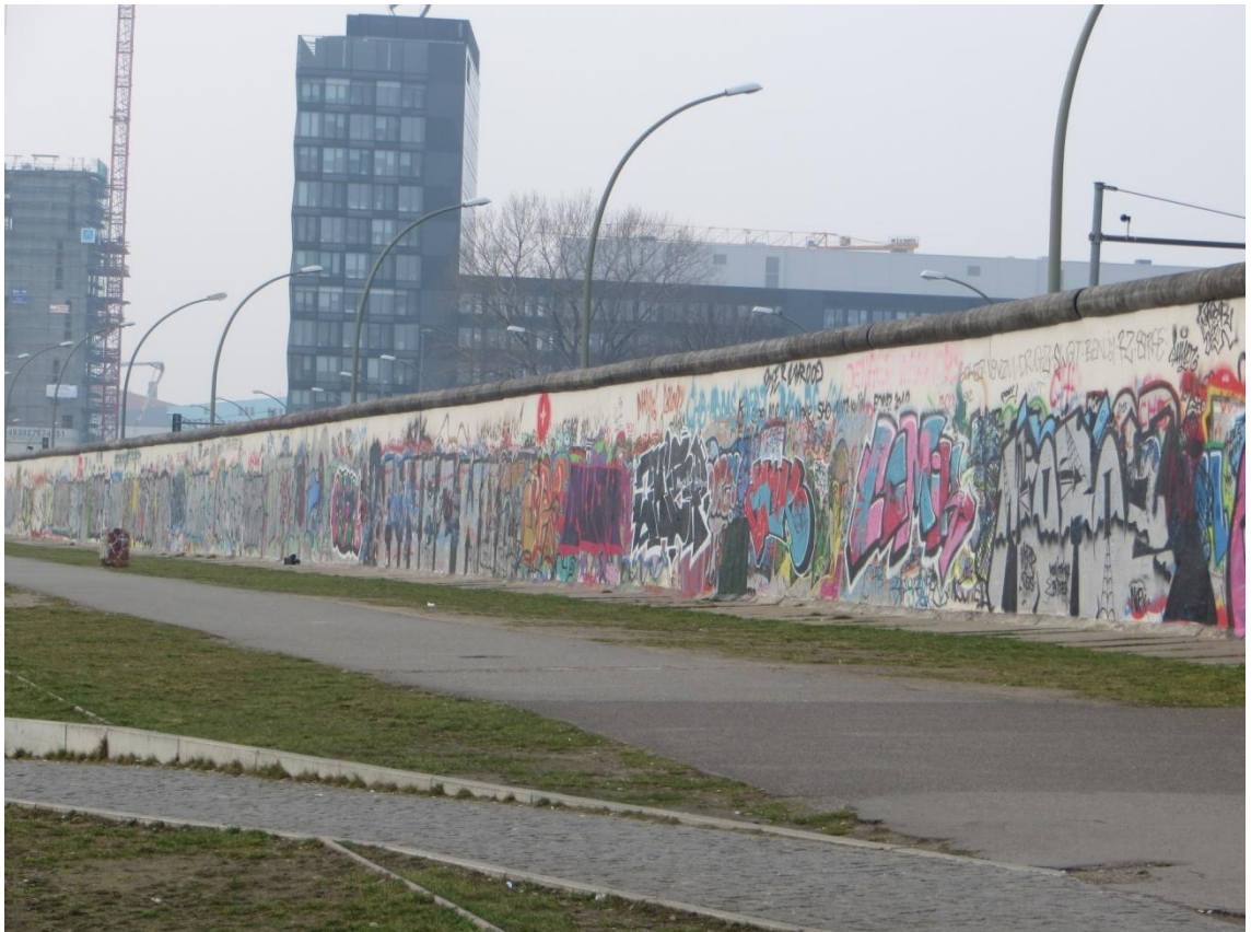
KUVA 15. Berliinin muuria

kulkea metron sijaan junalla. Oikea juna löytyi helposti ja määränpäähän päästiin. Sieltä suunnistettiin kävellen maamerkkien ja kartan avulla kohti East Side Galleryä. Ryhmä oli hyvin innoissaan Berliinin muurin ja siihen maalatun taiteen näkemisestä ja muutamat myös kirjoittivat itse omat tervehdyksensä ja nimikirjaimensa muuriin. Ryhmä käveli koko ulkoilmagallerian päästä päähän, mikä olikin yllättävän pitkä matka, noin 1,3 km ja aikaa kävellessä kului yllättävän paljon. Matkan varrella pysähdyttiin matkamuistomyymälässä ja otettiin myös ryhmäkuva muurin vierellä. Osa ryhmästä kulki nopeammin kuin muut ja he innokkaina kävelijöinä kulkivat pitkälti ohitse rautatieasemasta, josta oli tarkoitus matkata takaisin Alexanderplatzille. Tässä ryhmässä oli mukana myös opettaja ja heidät saatiin puhelimitse kiinni nopeasti matkanjohtajien huomattua heidän kulkeneen rautatieaseman ohi.