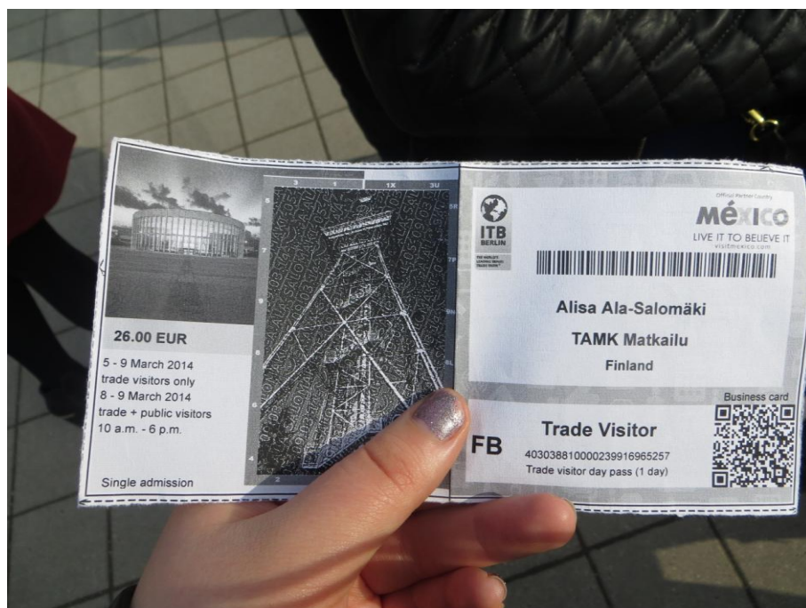
KUVA 10. Messulippu

Avustusta messulippuihin yritettiin hankkia useammasta kohteesta, mutta avustuksen tai ilmaisten lippujen saanti oli vaikeaa. Kuitenkin liput onnistuttiin saamaan messujen ammattilaispäiväksi hieman alennettuun hintaan Saksan messujen kautta. Opettaja haki avustusta myös ryhmän messulippuihin Expomarkkila ja hän onnistui saamaan 500 € avustuksen, joka teki lippuhinnasta opiskelijoille erittäin alhaisen.