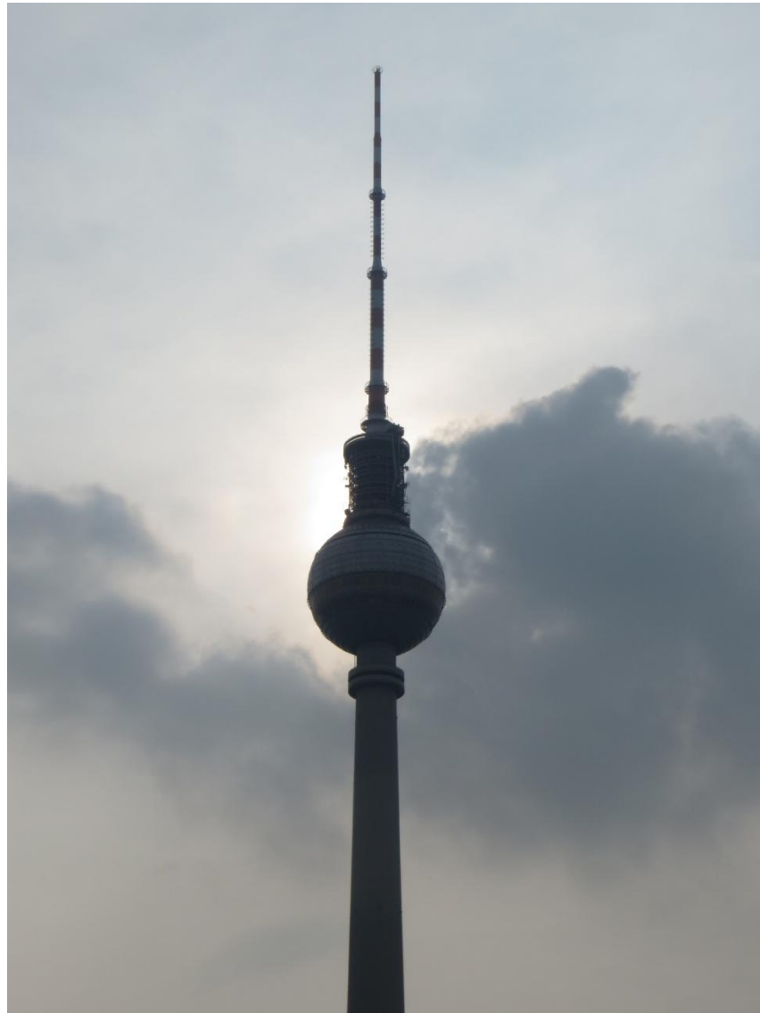
KUVA 4. Berliinin televisiotorni

Saksojen yhdistymisen myötä Berliinissä on kaksi eläintarhaa. Tierpark Friedrichsfelde, joka sijaitsee entisen Itä-Berliinin puolella ja suosituimpi Zoologischer Garten entisen Länsi-Berliinin puolella. Zoologischer Garten on yksi Euroopan vanhimmista eläintarhoista. Se on perustettu vuonna 1844. Siellä on eläimiä yhteensä noin 14 000, joista erikoisimpiin kuuluu jättiläispanda. Lisäksi eläintarhassa on yksi Euroopan suurimmista akvaarioista. (Matkalla maailmalla 2014.)